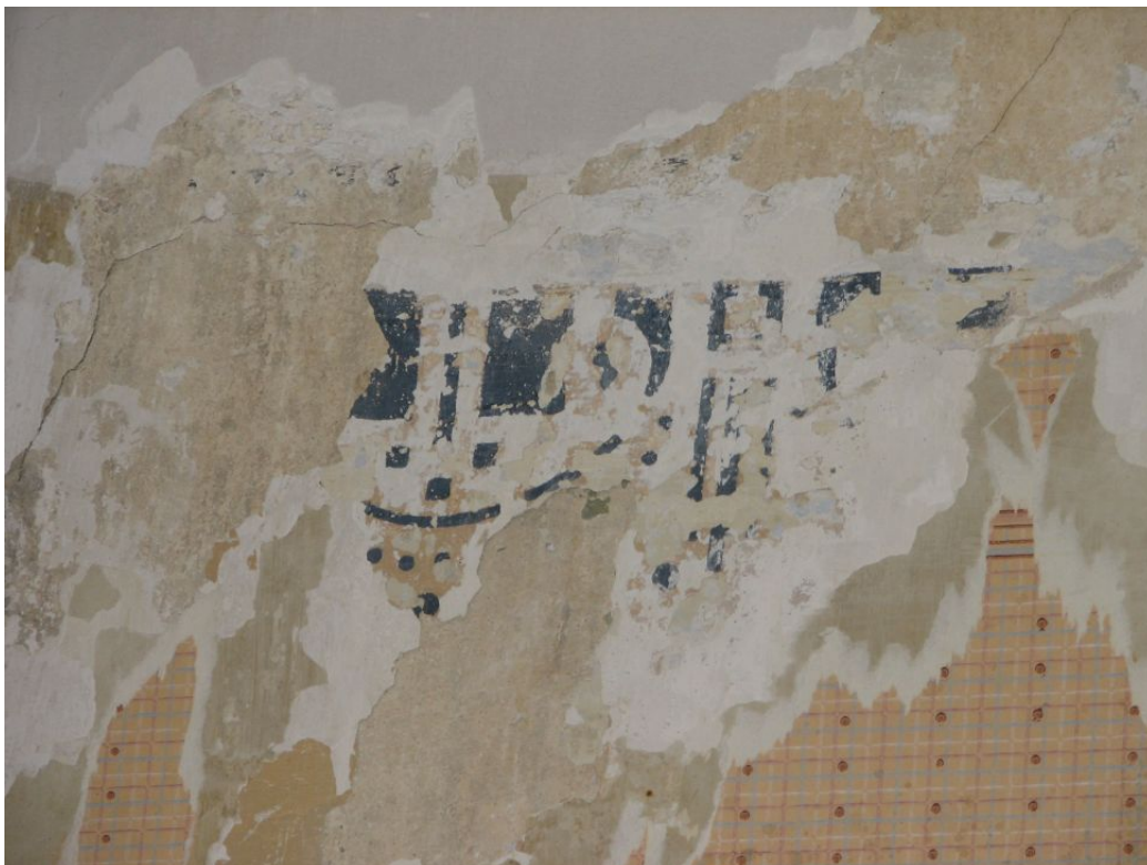
Foto nr. 28 Trafarettmaaling ruumis nr. 10