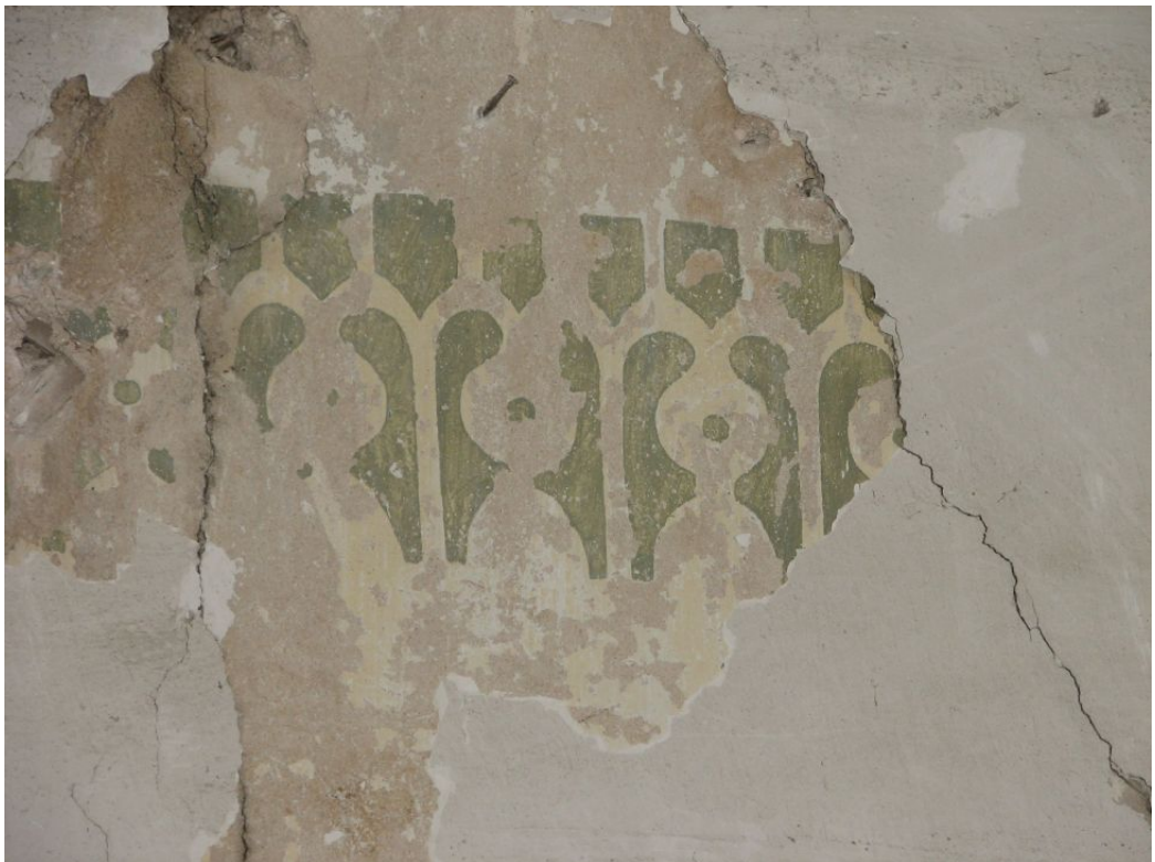
Foto nr. 24. Trafarettmaaling ruumis nr. 6