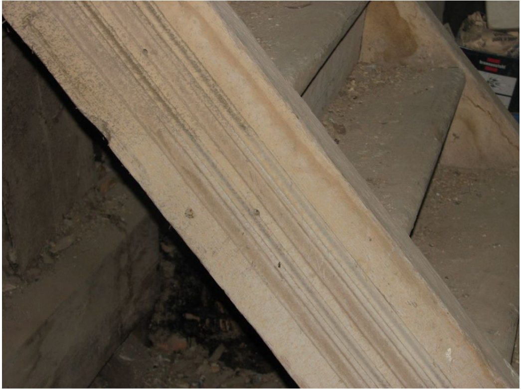
Foto nr. 20 Trepipõsk