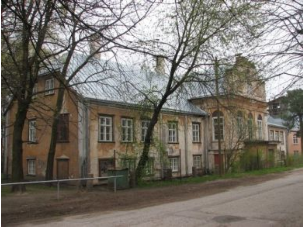
Foto nr. 4 Peafassaad