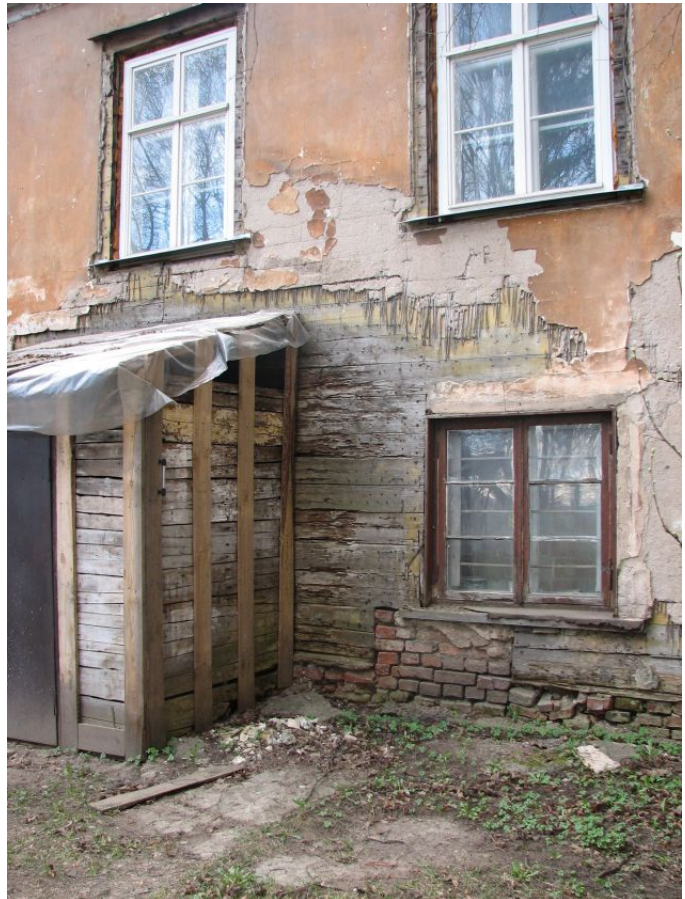
Foto nr.21 Sadevetest kahjustatud sein