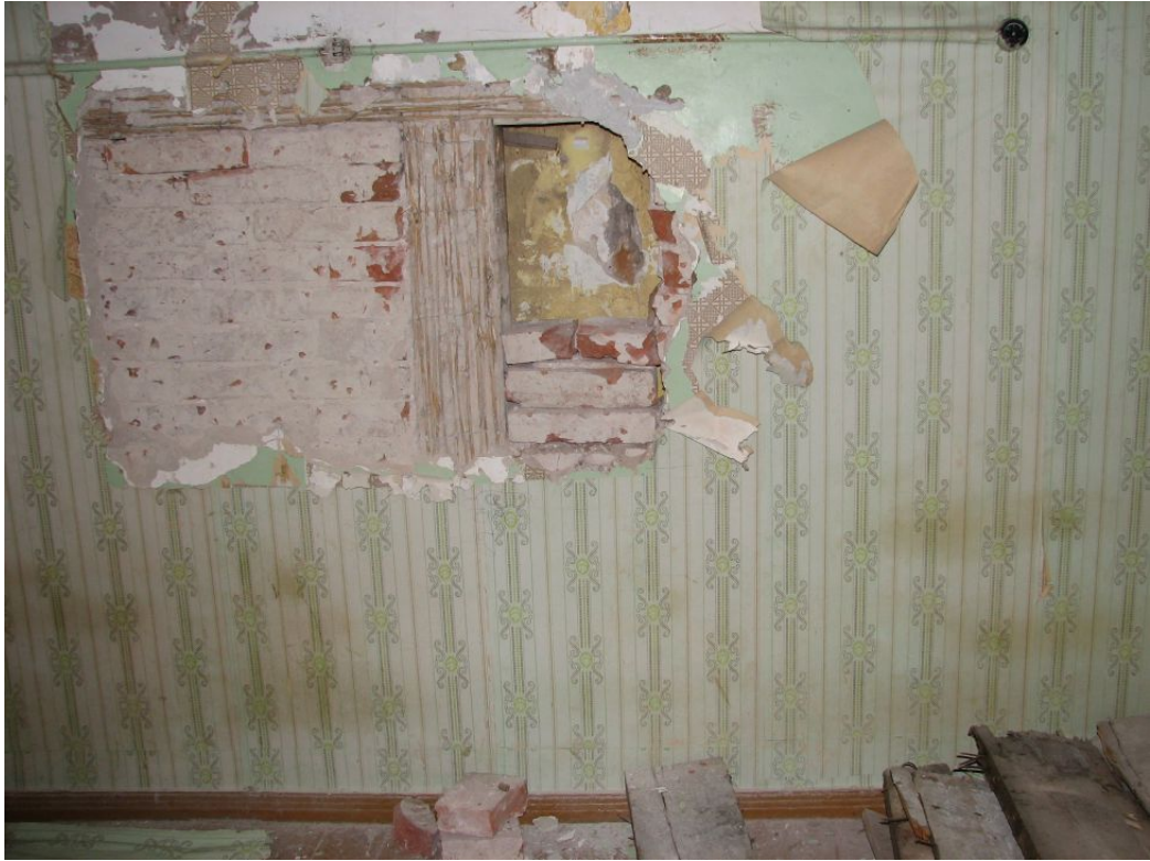
Foto nr.18 Vaadeldav topeltvälissein