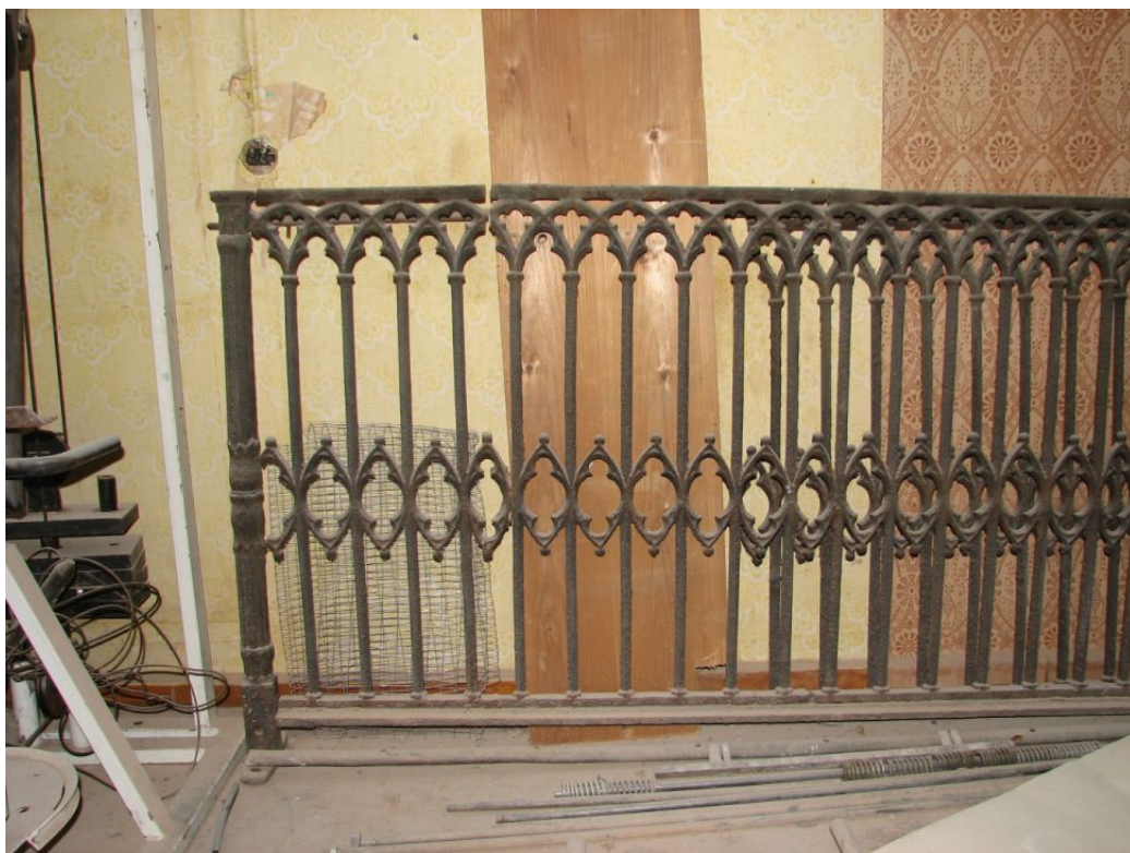
Foto nr. 8 Rõduvõre