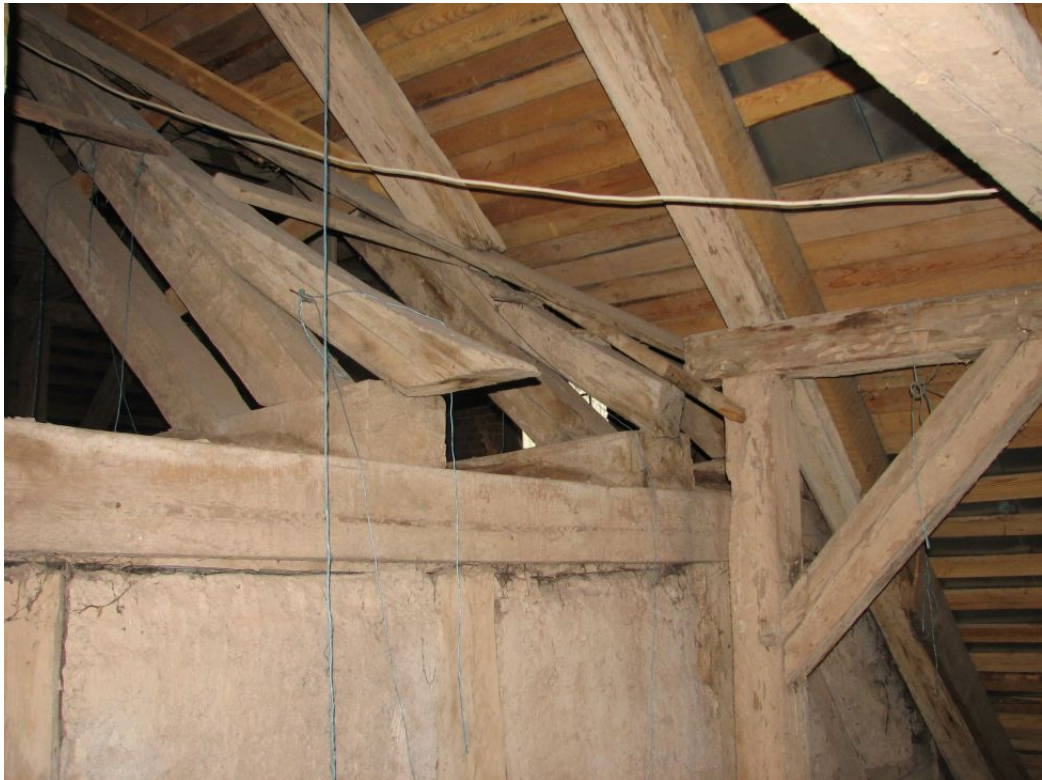
Foto nr.19 Suure saali talaotsad