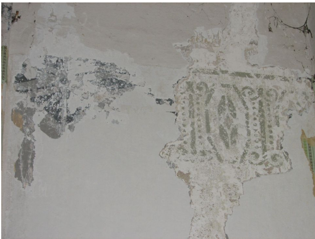
Foto nr. 29 Trafarettmaaling ruumis nr. 11 (vasak uuem, parempoolne vanem)