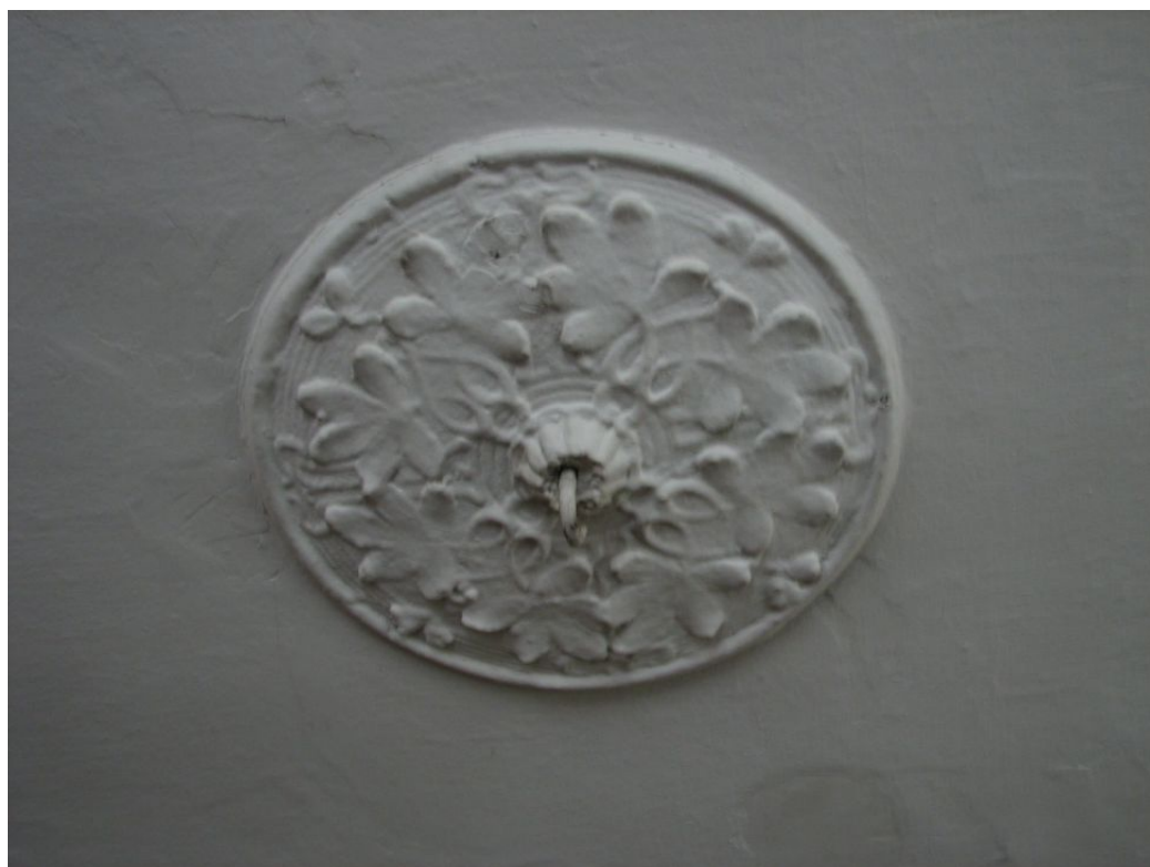
Foto nr. 13 Rosett põhikorrusel