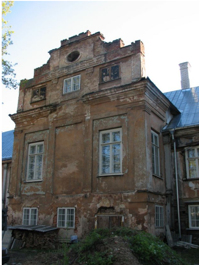
Foto nr. 9 Varaklassitsistlik fassaadiosa