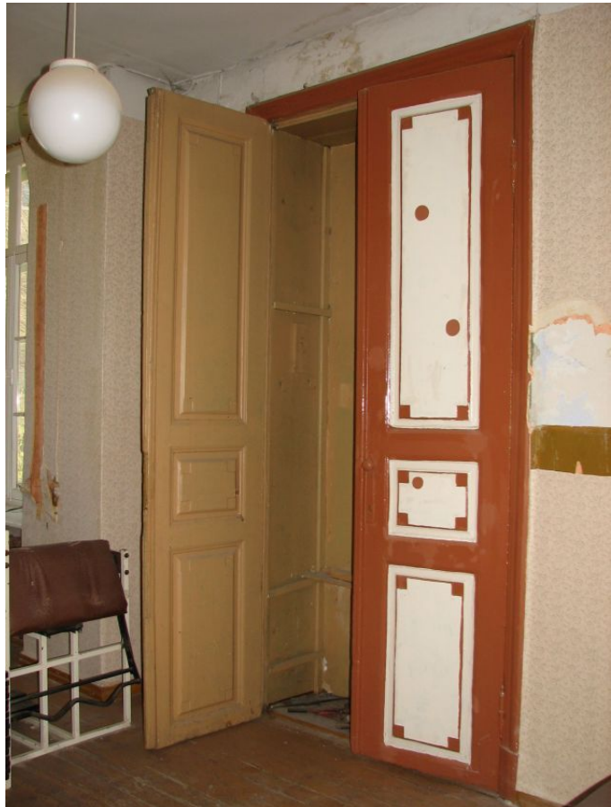
Foto nr. 15 Suure saali uks