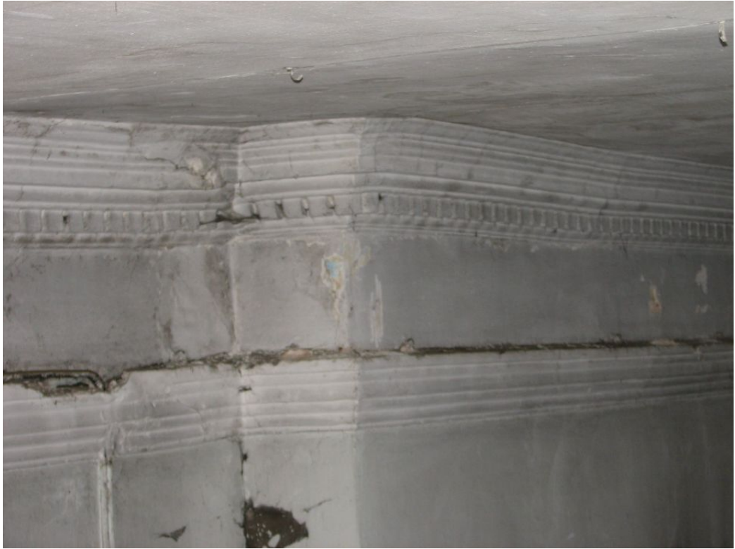
Foto nr. 14 Suure saali laekarniis