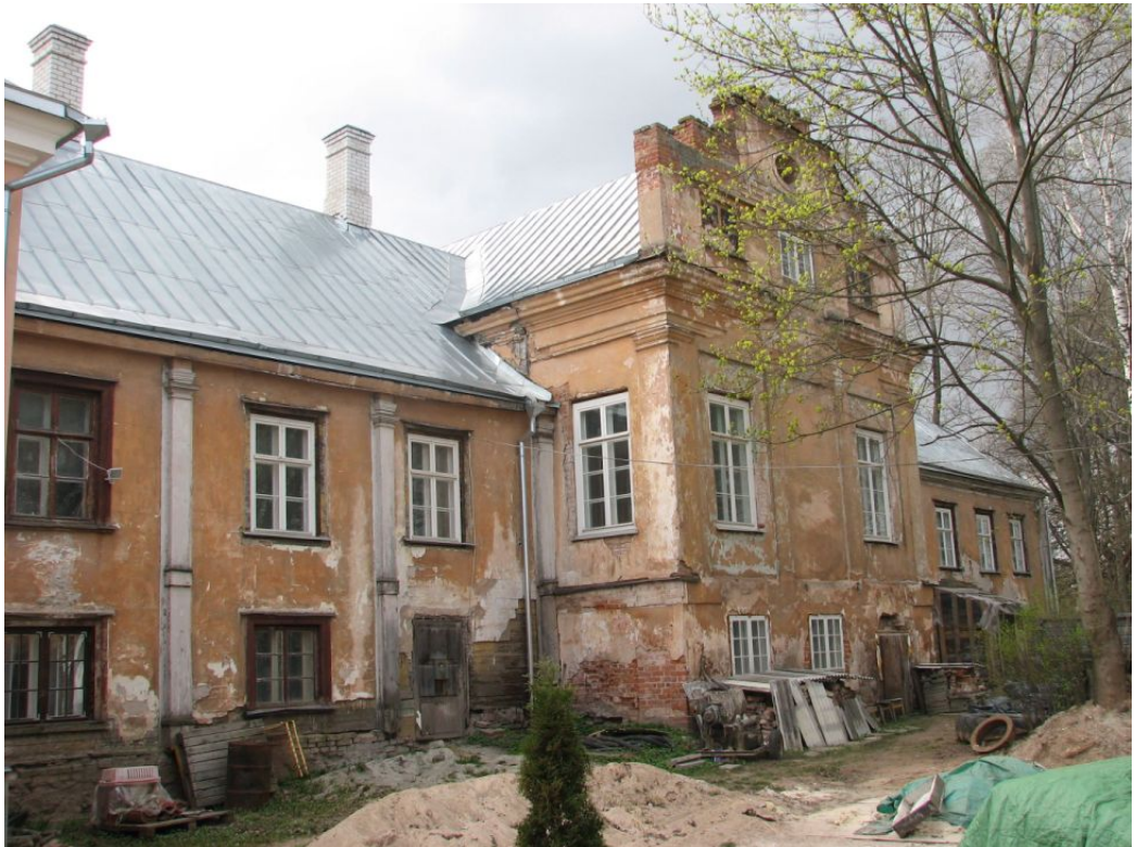
Foto nr.5 Hoovipoolne fassaad