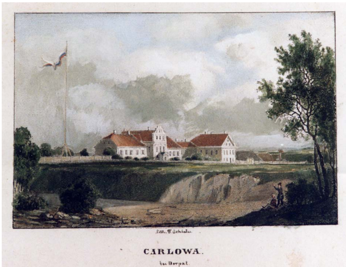
Foto nr. 2 Karlova mõis, 19.saj algus. G. J. Schlater`akvarell, erakogu.