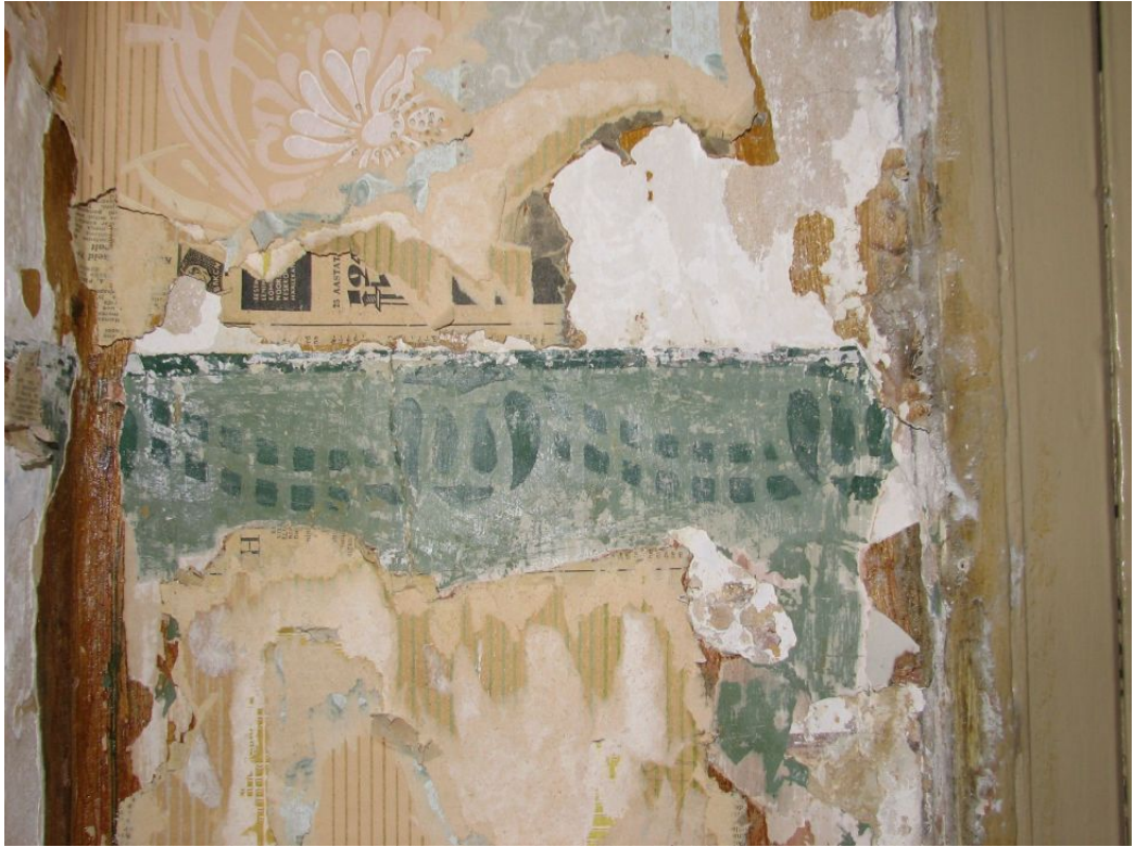
Foto nr. 24. Trafarettmaaling ruumis nr. 2