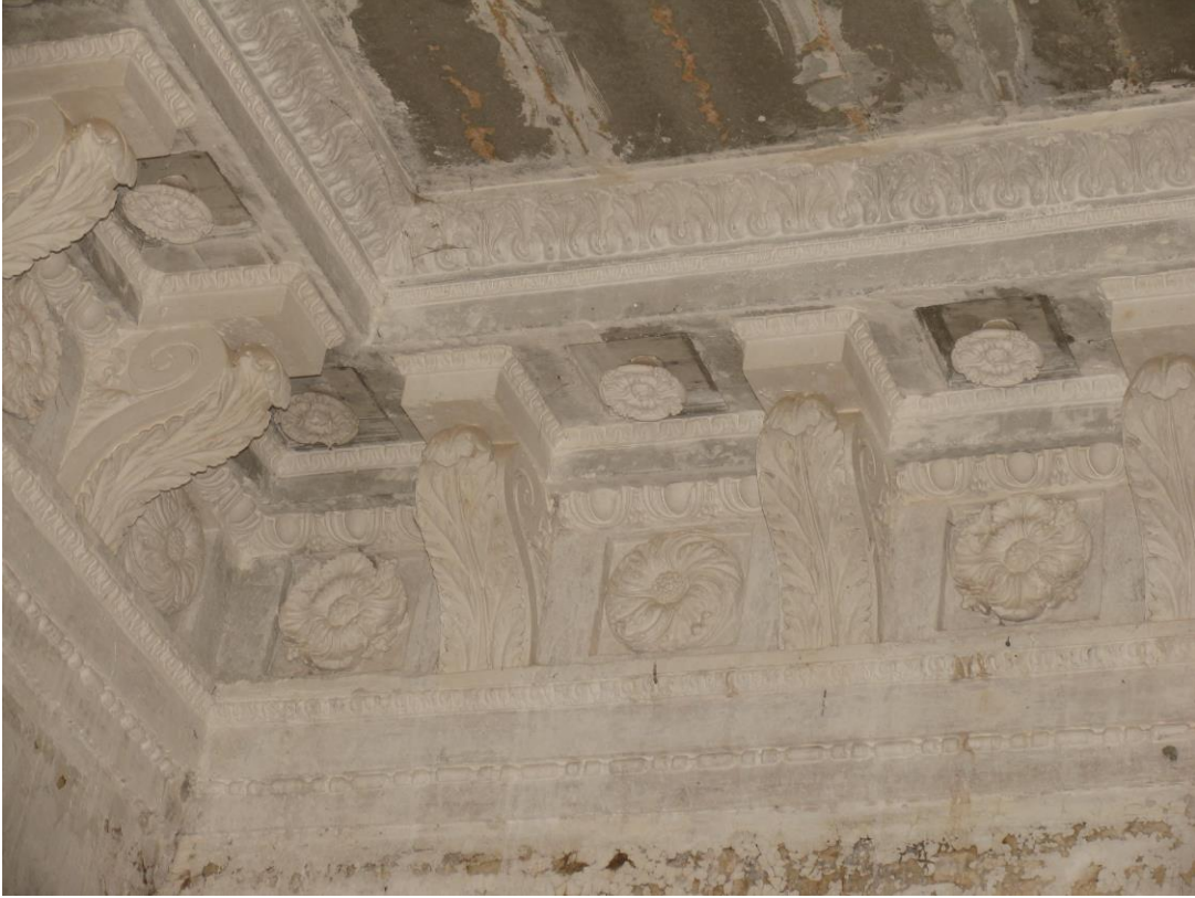
- 2.korruse peasaalis stukkdekoor