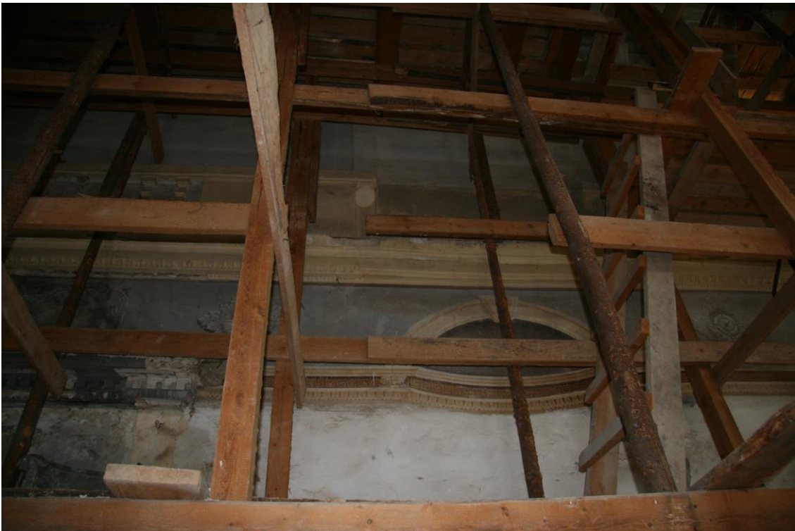
- seinamaalingud 2. korruse kabeliruumis