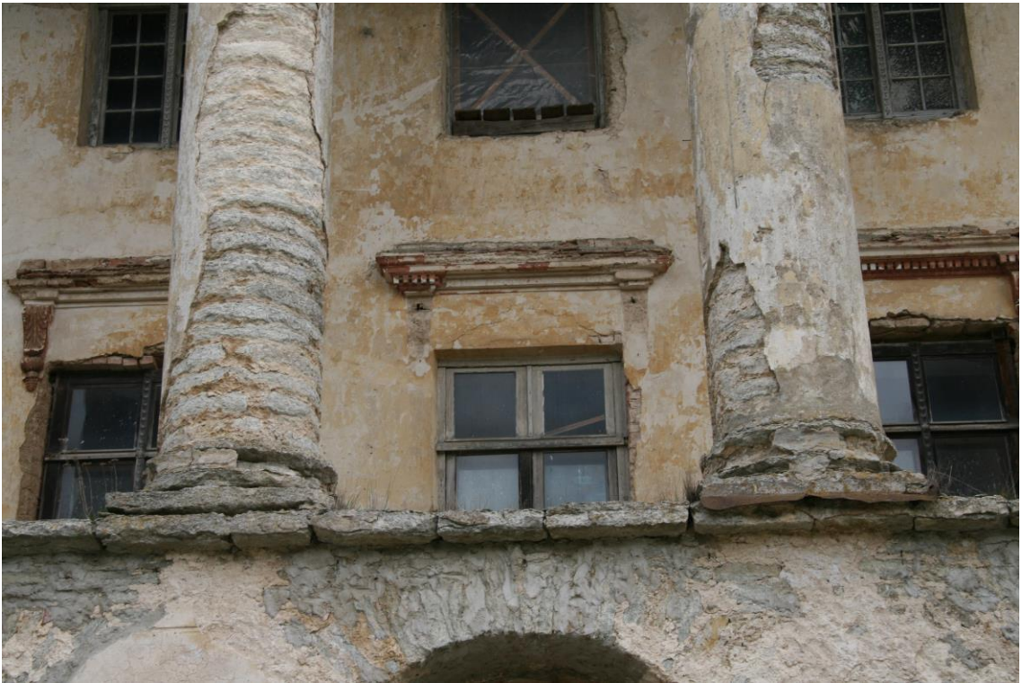
- esifassaad, 2.korruse sambad