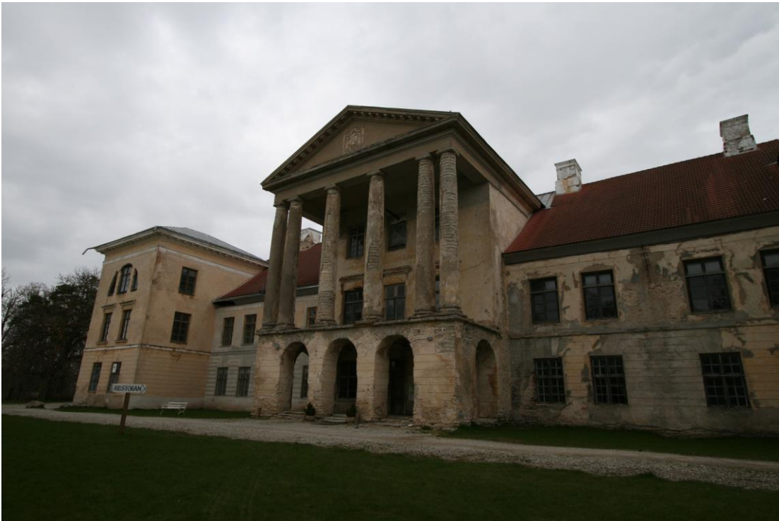
- fotol näha nii kivikatus kui osaliselt hoonet kattev tsinkplekk-katus

Ajaloolistest dokumentidest võib välja lugeda, et hoone ehitusperioodil kaeti katus baroksele ajastule iseloomuliku puitkimmkatusega, kuid 18.sajandil hoone ümberehitusel klassitsistlikuks vahetati puitkatused välja kivikatuste vastu.