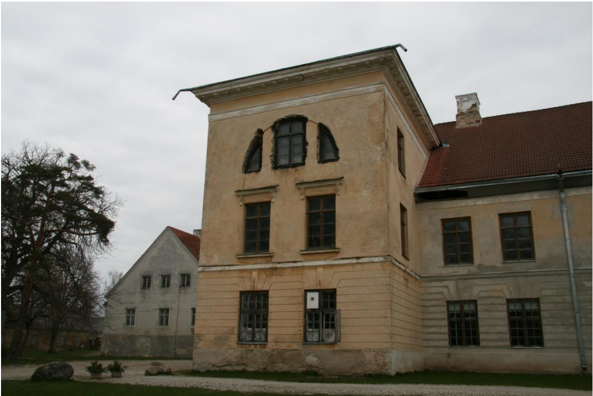
- esifassaad, näha osalist niiskuse kondenseerumist fassaadipinnal