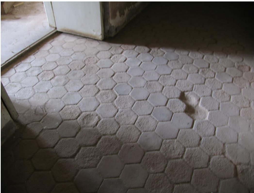
- 6-nurksed põrandakivid 2. korruse koridorides, originaal