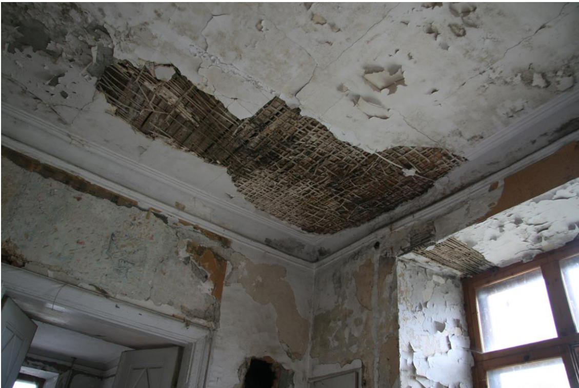
- 2.korruse vahelagi niiskuskahjustustega