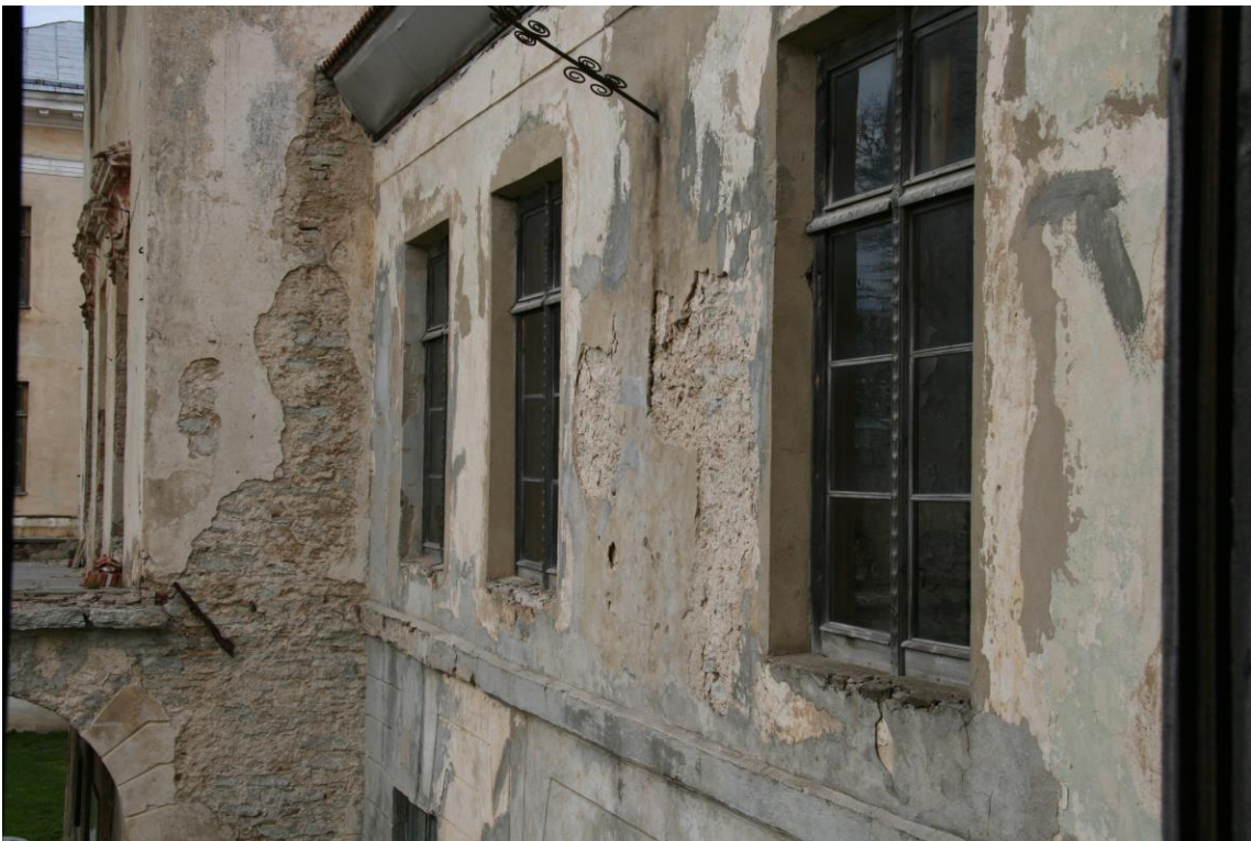
- esifassaad, 2.korruse pragunev fassaadikrohv