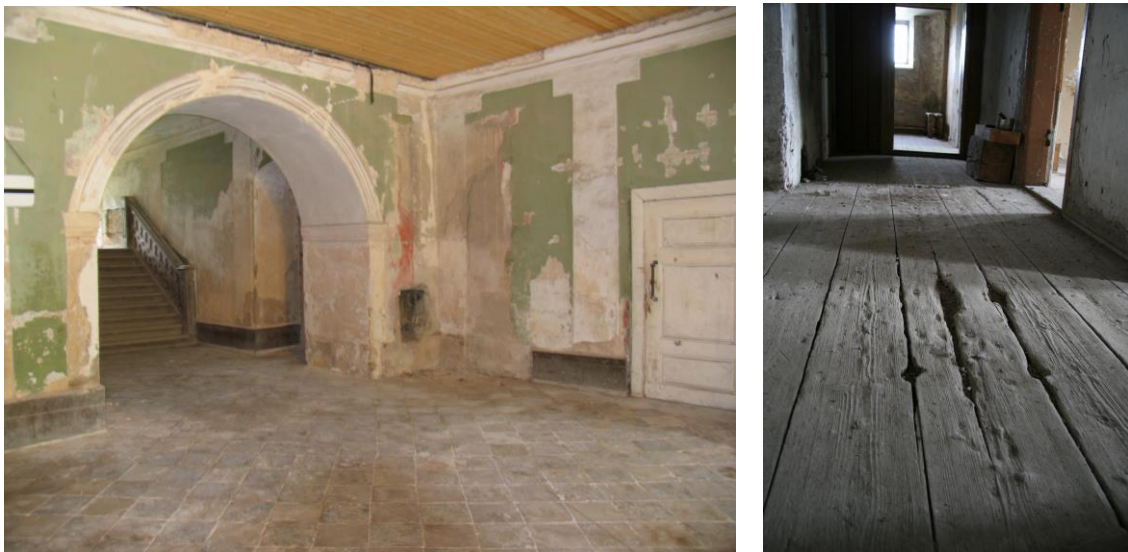
- 1.korruse kivipõrand vestibüülis ja vana laudpõrand 3. korrusel

Uuendatud peasaali põrandatalasid katab veel rida originaalparketti, mis kahjuks enam kasutuseks ei kõlba. Küll aga aitab see valmistada uut parketti vana originaali eeskujul.