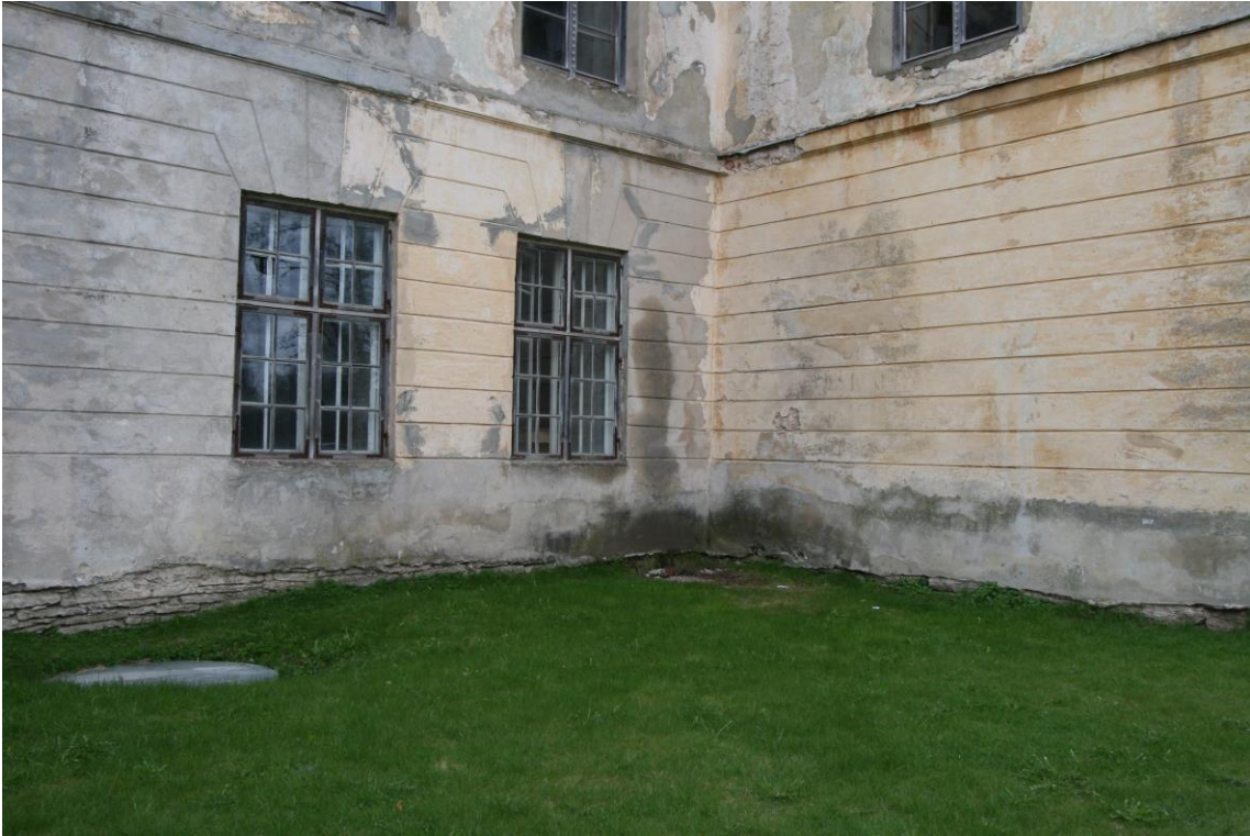
- esifassaad, niiskuskahjustused