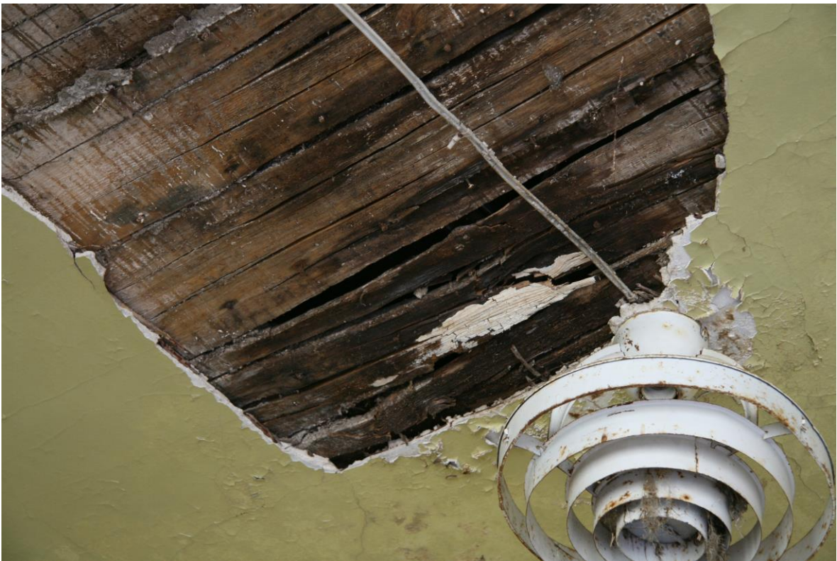
- 2.korruse vettinud ja hallitav vahelagi