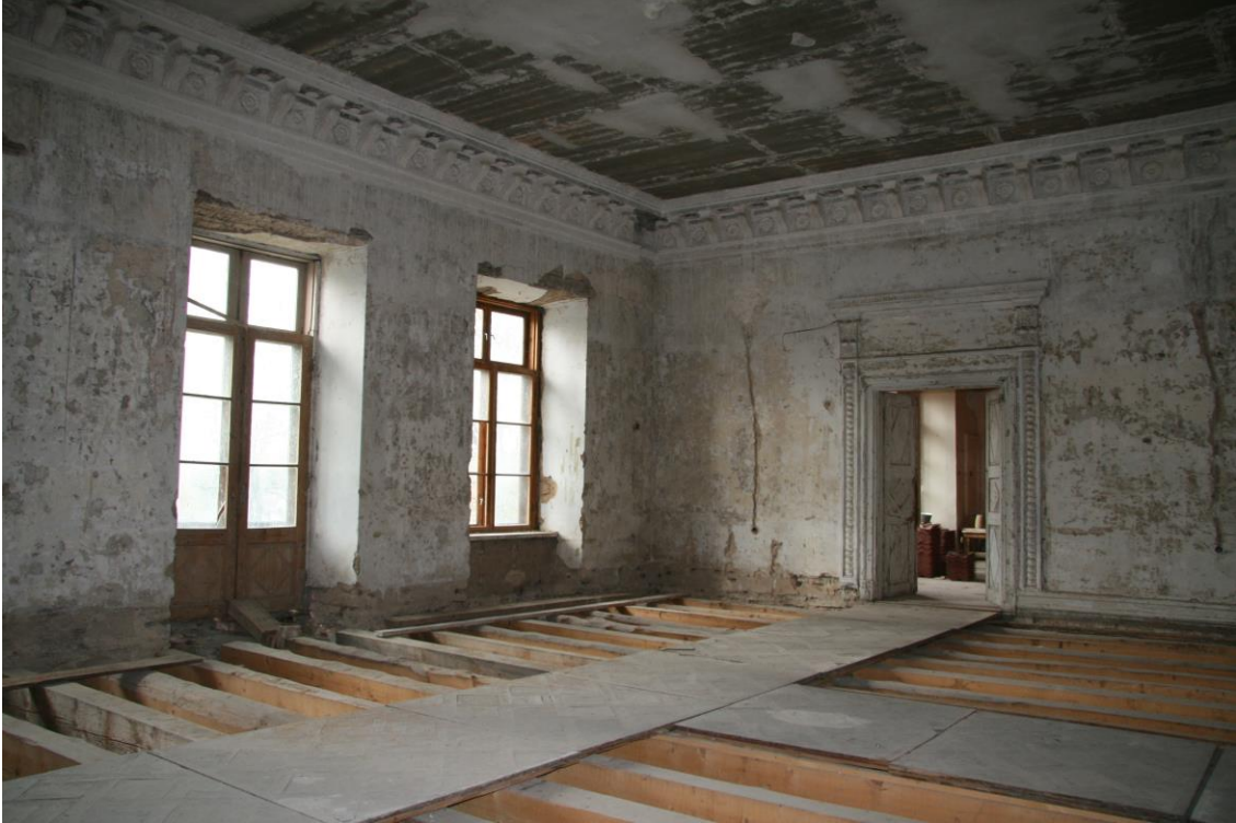
- peasaal puitlaega ja uute põrandataladega