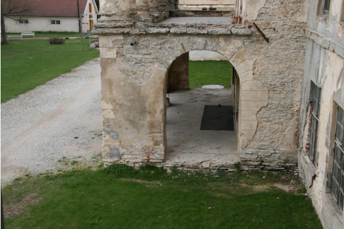
- esifassaad, vaade peasissepääsule