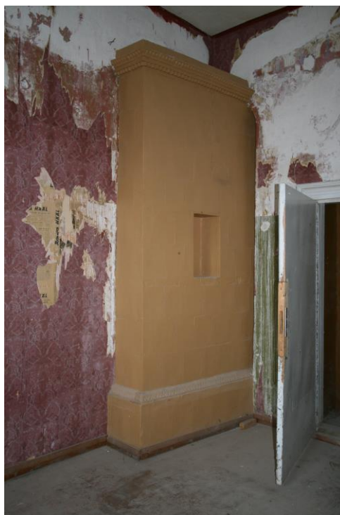
- ahjuase 2. korruse peesaalis ja ülevõõbatud ahi kõrvalruumis