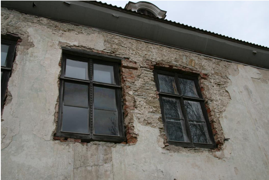
- aknad hoovipoolsel fassaadil

80-ndate aastate alguse restaureerimistöõde käigus vahetati välja enamus peahoone aknaid, mis valmistati originaalide eeskujul. Uued aknad tunduvad esmapilgul üsna head koopiad ja esmajärjekorras väljavahetamist ei vaja, küll aga restaureerimist. 70-ndatel aastatel teostatud värvisondaazide tulemusena peaksid kõik peahoone aknad olema värvitud valgeks. Soovitatav on kasutada uuel tehnoloogial baseeruvaid hingavaid välistöödeks sobivaid õlivärve.