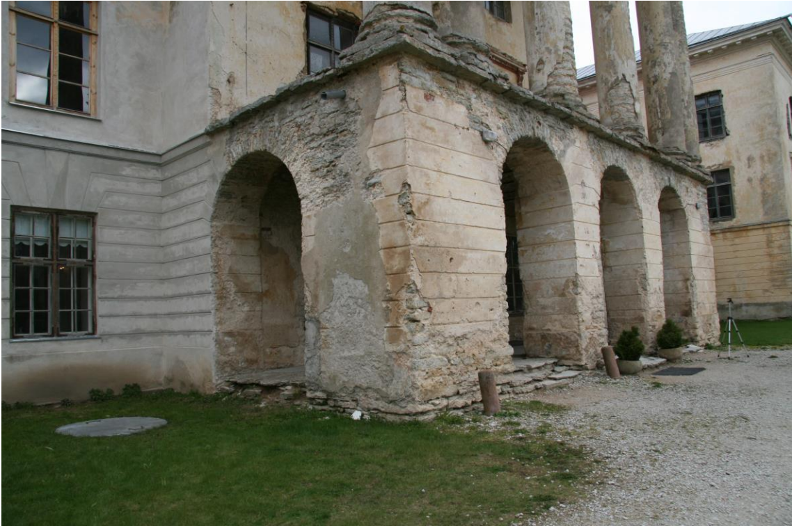
- esifassaad, peasissepääs