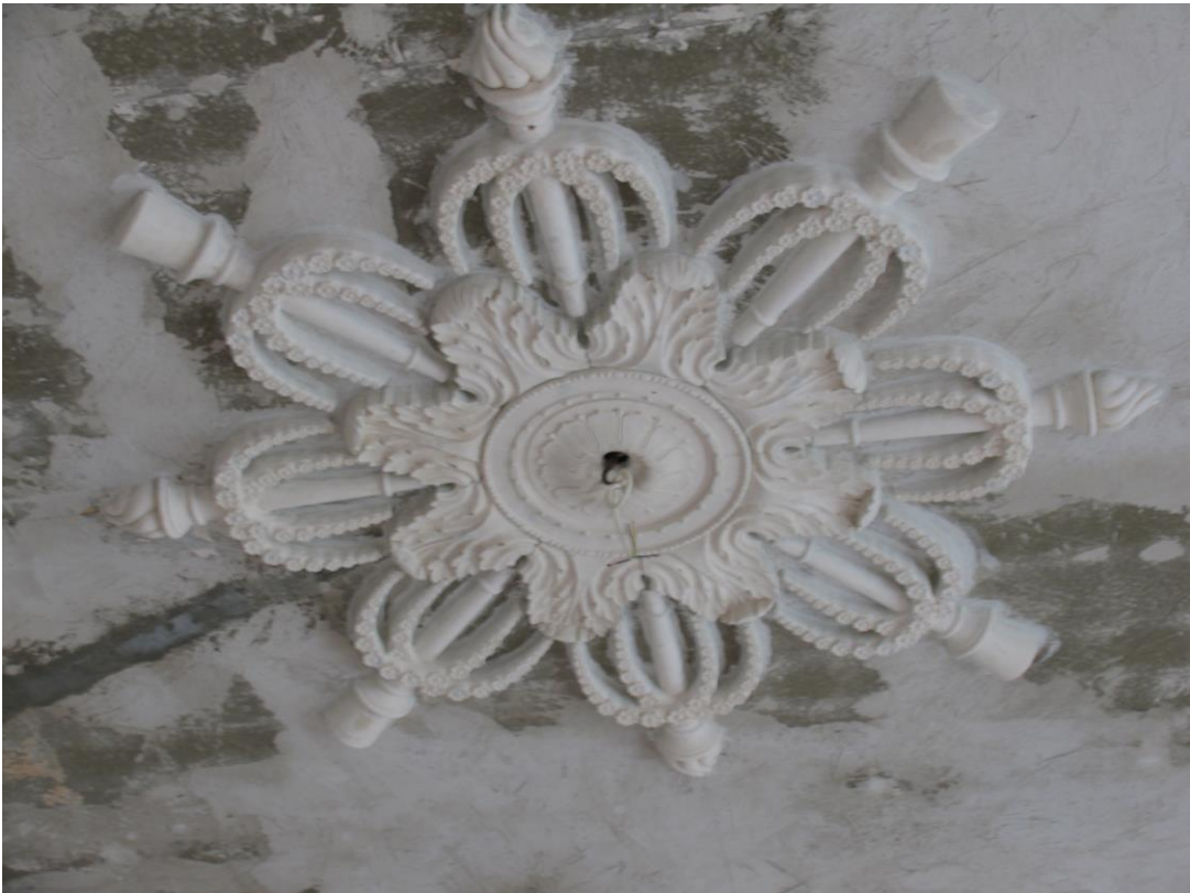
- 2.korruse peasaali lagi