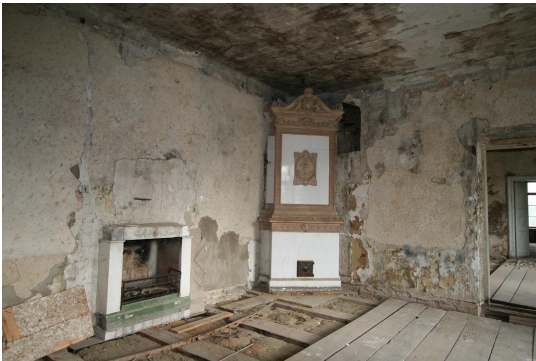
- 2.korruse säilinud rokokoostilis ahi

Ahjudest on säilinud üks rokokoostili meenutav ahi. Vanimad ahjud on lammutatud juba aastaks 1956 nii esimeselt kui teiselt korruselt.