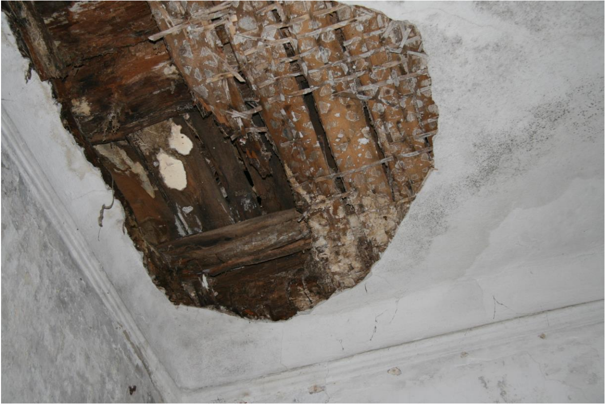
- 2.korruse vahelagi niiskuskahjustustega