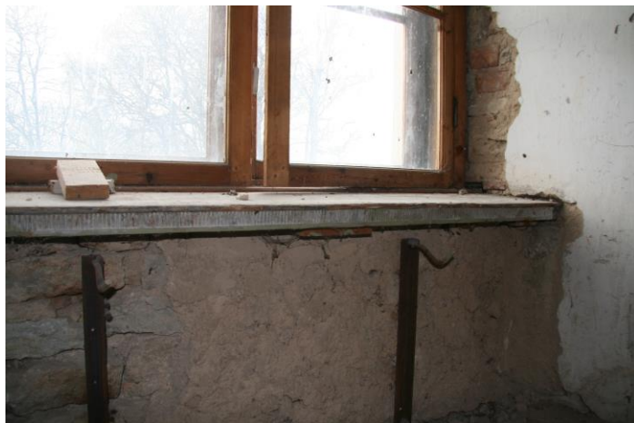
- baroksete detailidega aken sissepääsu kõrval, aknalaud