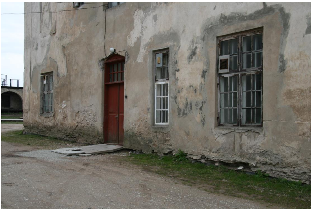
- vaade külgfassaadile, näha niiskuskahjustusi ja kinnimüüritud avasid

Peahoone külgedel ja siseõue poolsel fassaadil võib näha mitmeid hilisaegsmaid muudatusi: kinnimüüritud ja muudetud aknaavasid ja uksi. Enne restaureerimistöde alustamist peab välja selgitama, milleks on muutused fassaadis olnud vajalikud ja kas neid saaks taastada algsel originaalse fassaadilahenduse eeskujul.