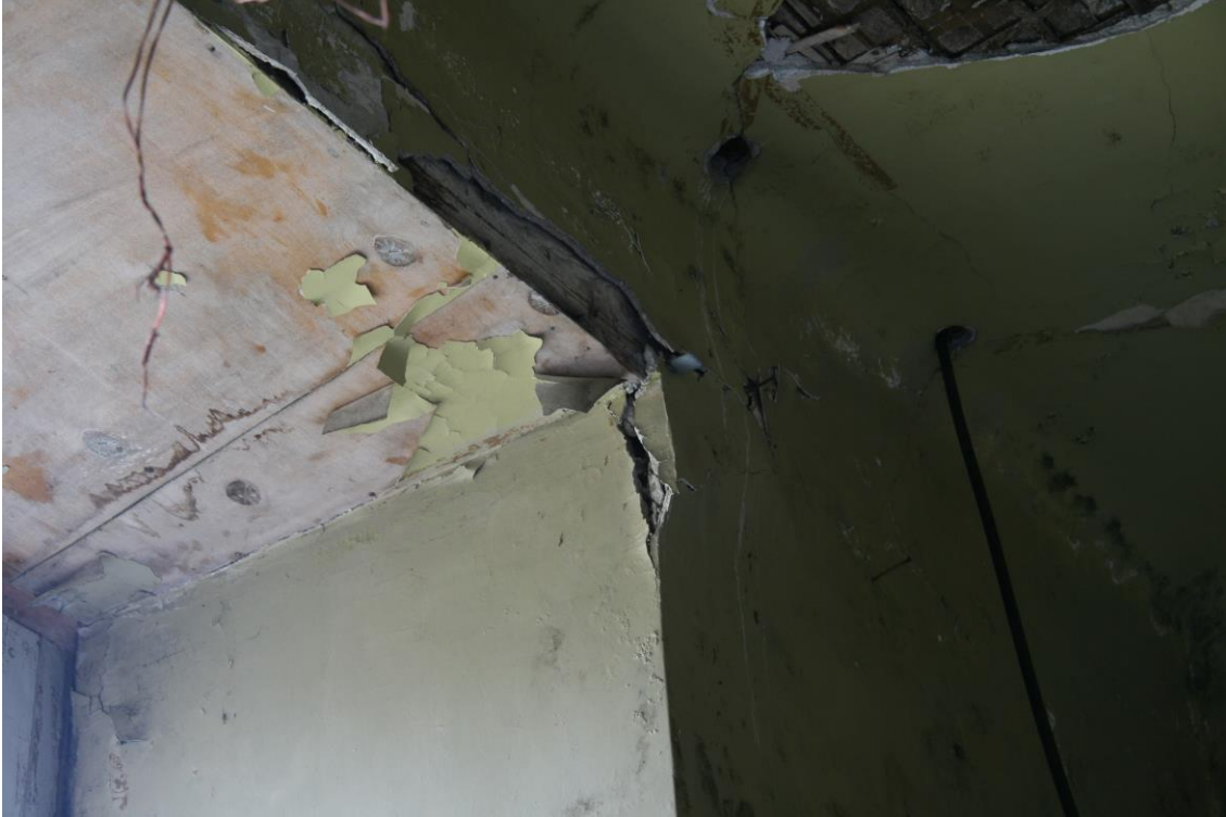
- 2.korruse niiskuskahjustused