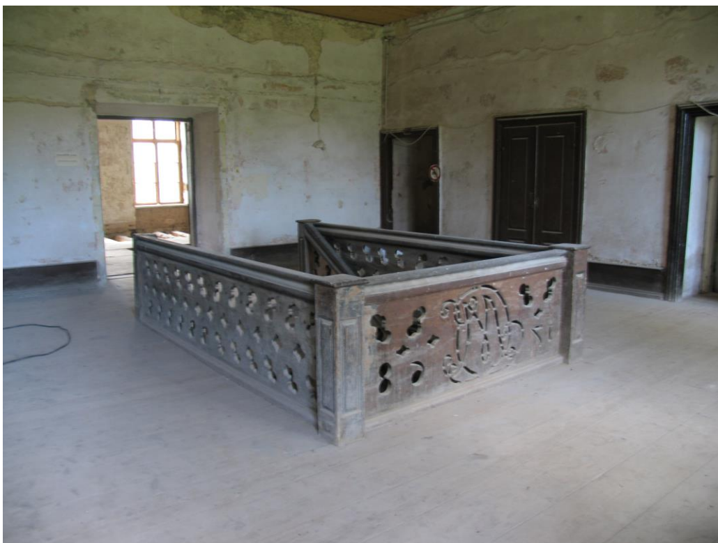
- uus laudpõrnand 2. korruse trepiahallis