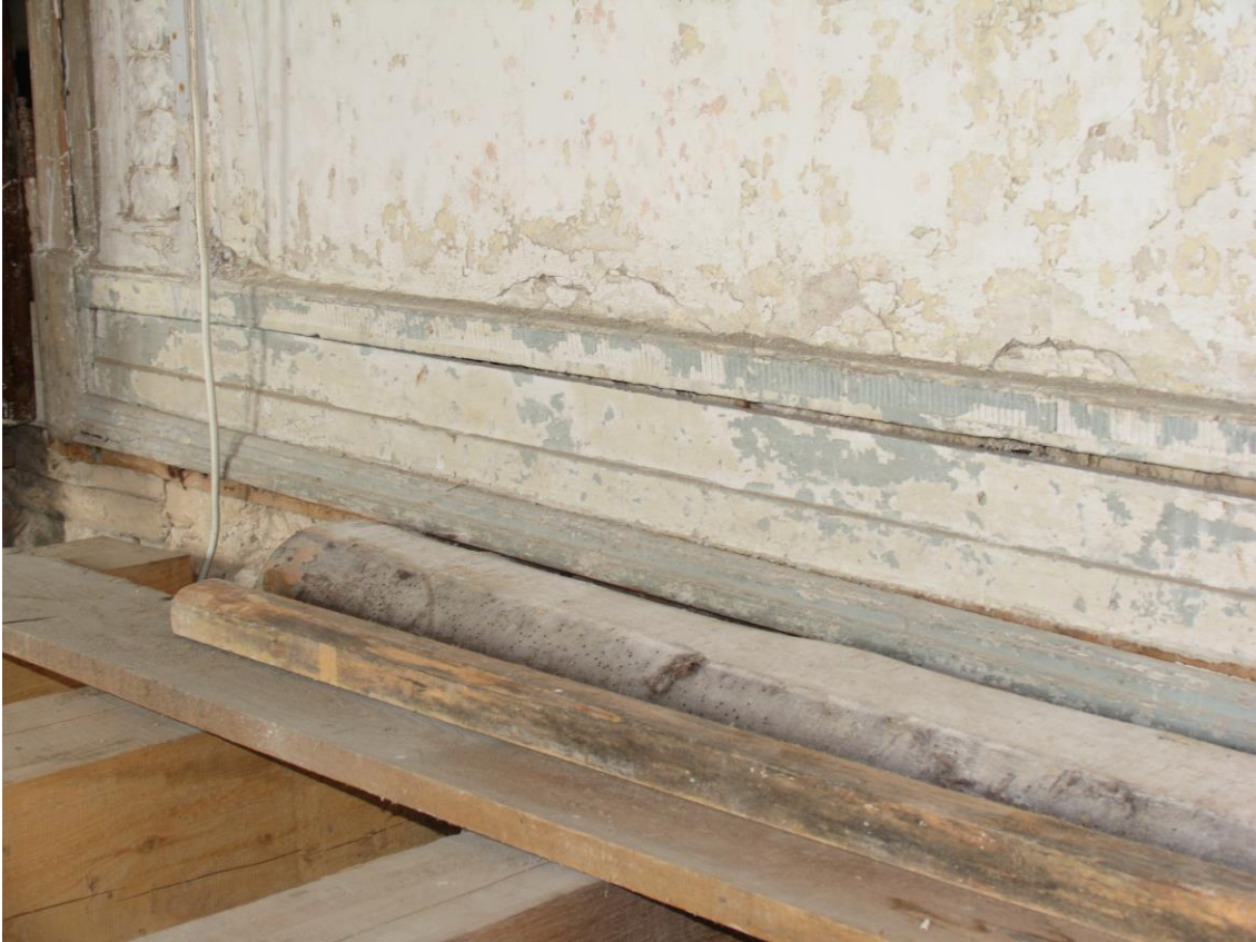
- põrandaliist, mis on säilinud 2.korruse peasaalis