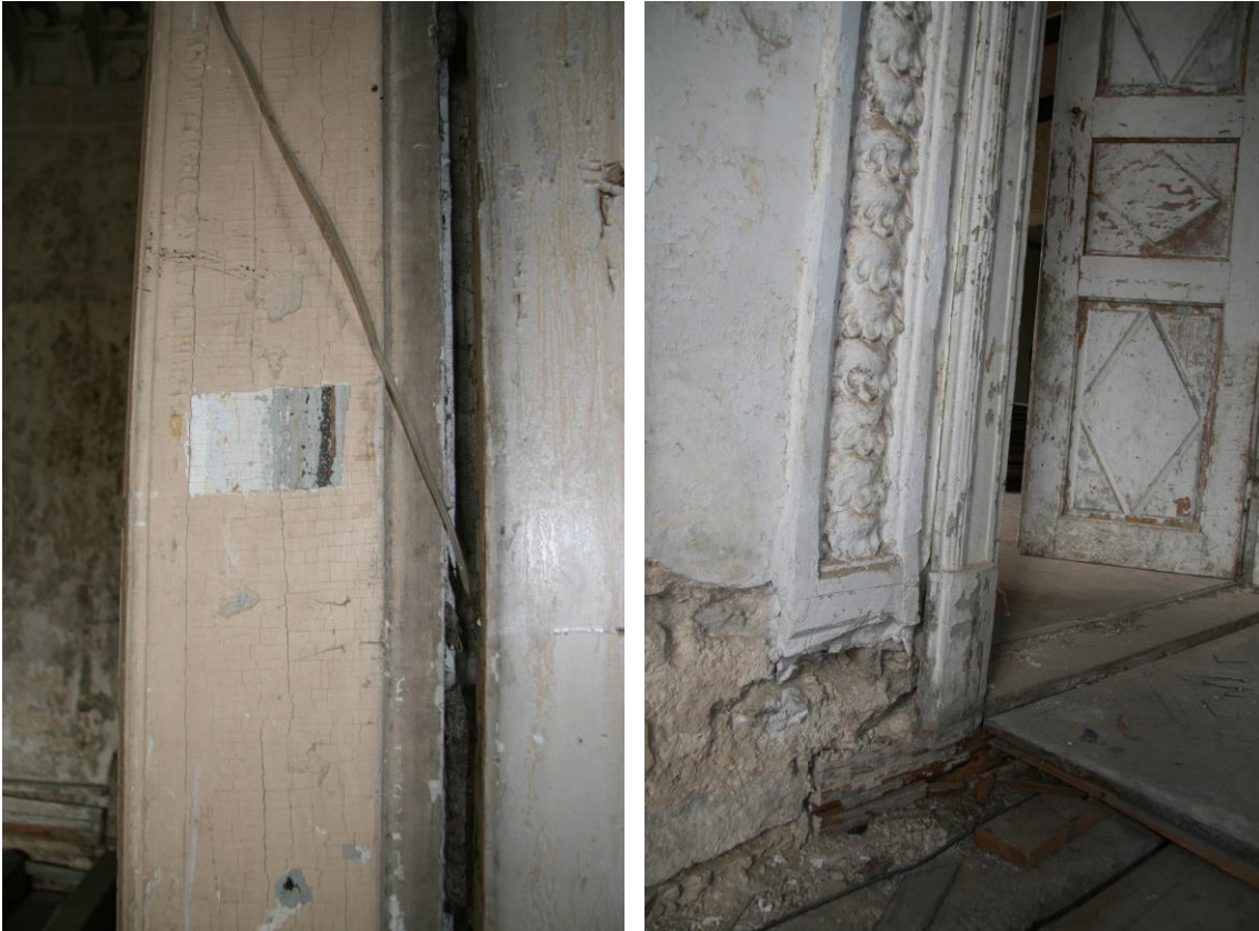
-värvisondaaz peasaali uksepiidal ja säilinud klassitsistlikud ukse piirdeliistud

Läbi aastakümnete on teostatud värvisondaaze siseseintele ruumide kaupa, ja need ka dokumenteeritud.