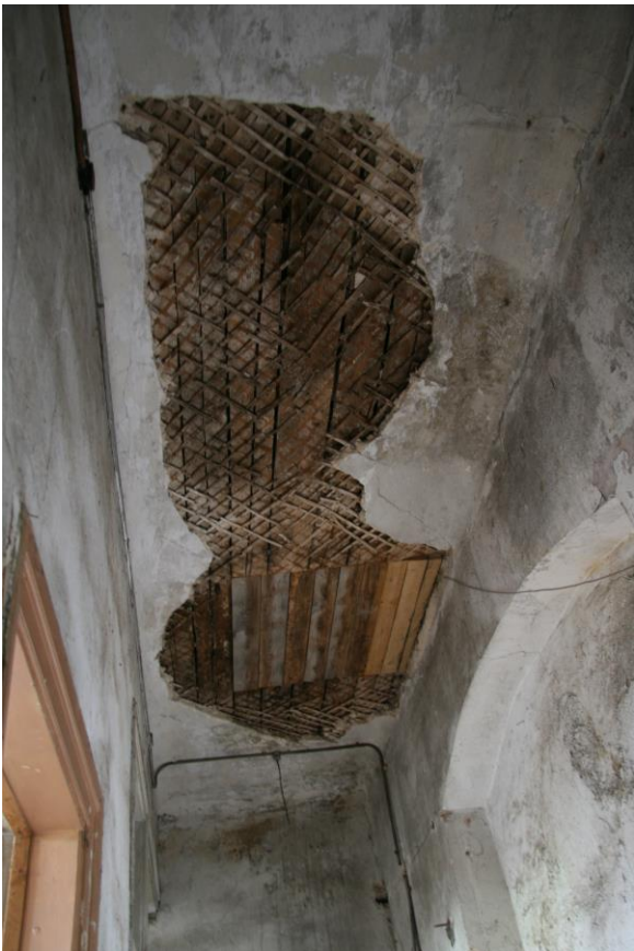
- 3.korruse vahelagi