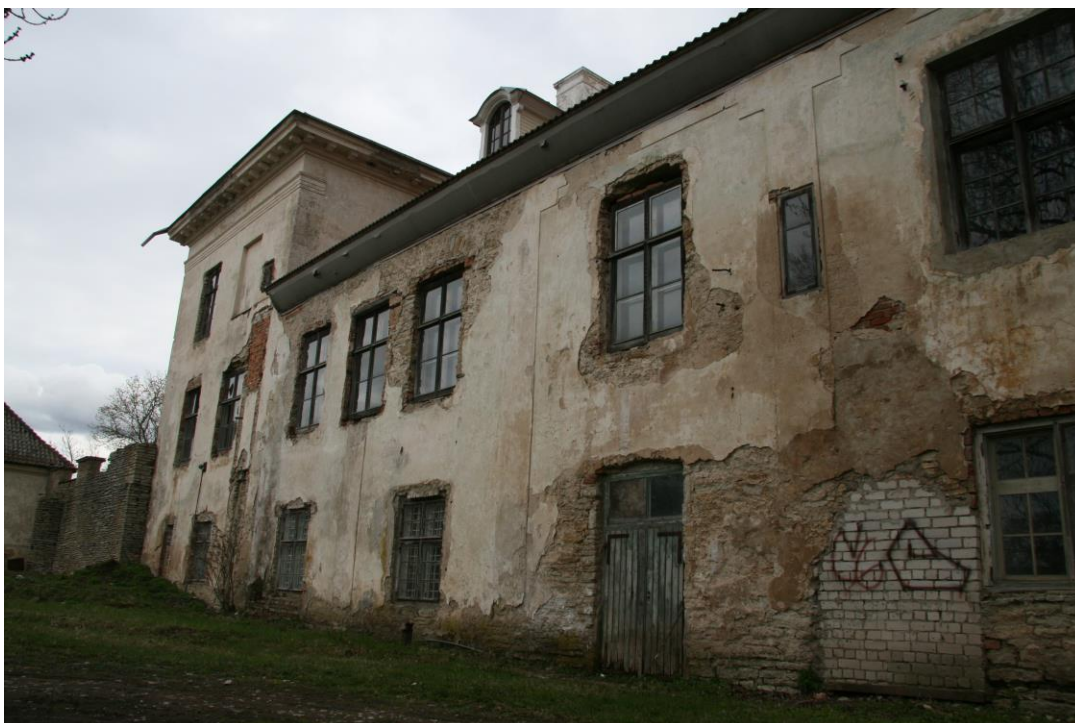
- vaade fassaadile siseõuest