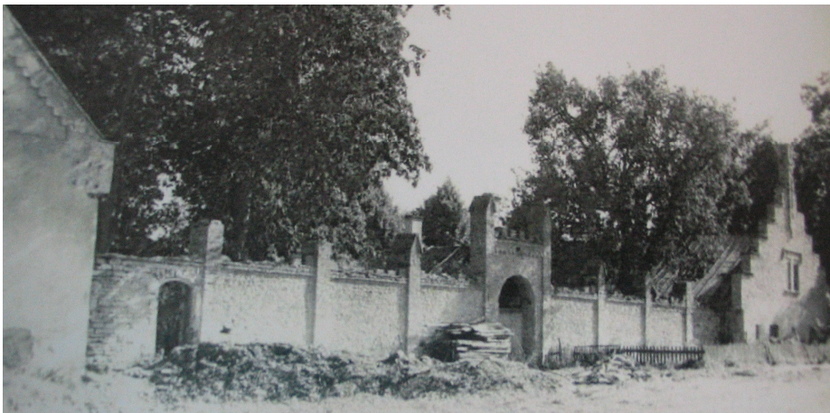
IV. Müür tallihoonega veel ühendatud. (Harku mõisa piirdemüüri rekonstrueerimisprojekt, 2006)