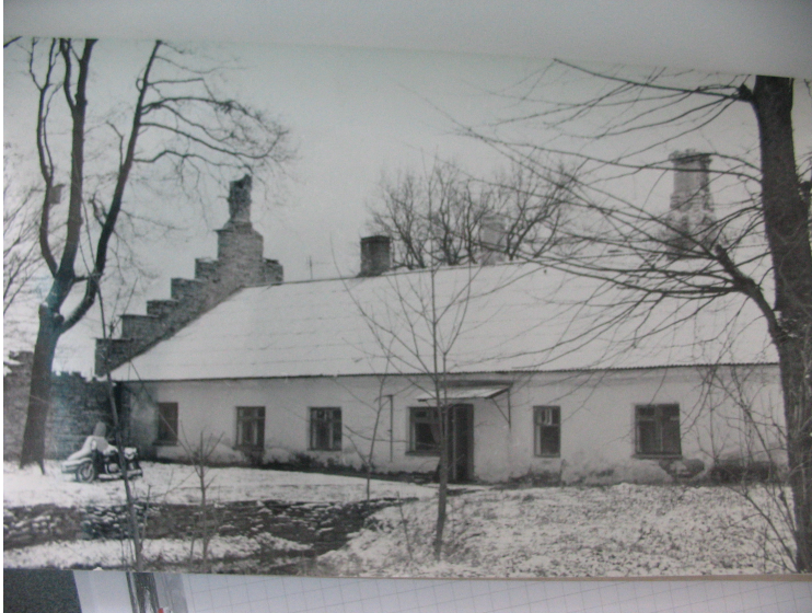
II. Laudahoone pargist vaadatuna. (Ajalooline õiend, 1980)