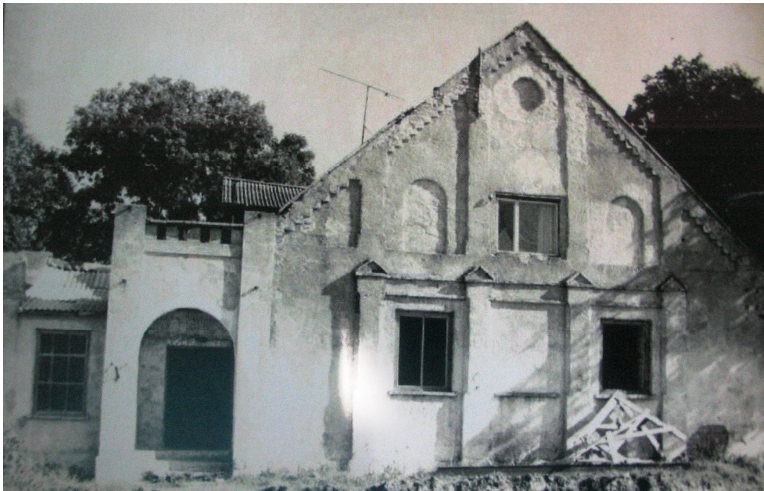
III. Tallihoone enne juurdeehitust 1970. a. (Harku mõisa piirdemüüri rekonstrueerimisprojekt, 2006)