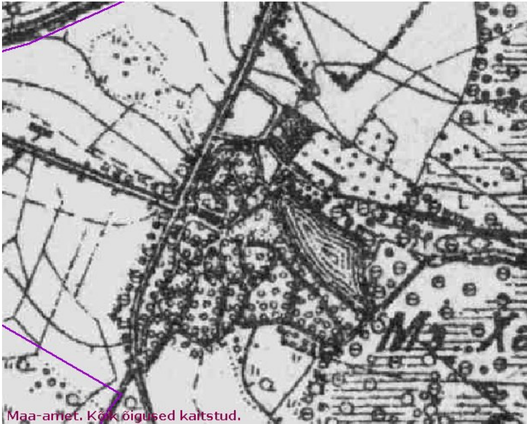
Vene verstakaart. (Maa-ameti kodulehekülje kaardiserver)