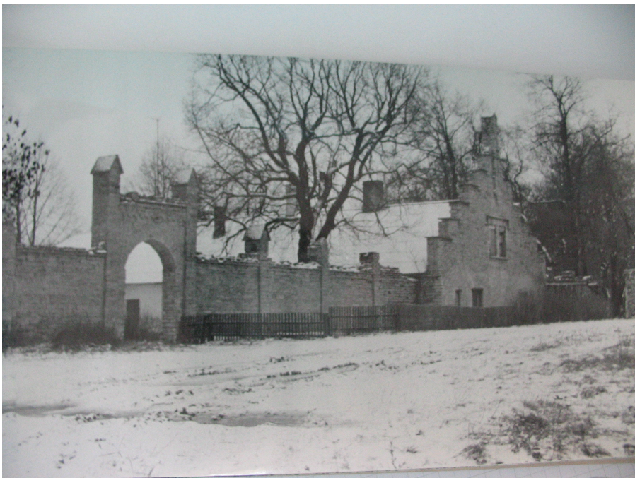
I. Karjaõue pseudogooti vahemüür koos laudahoone astmestikfrontooniga. (Ajalooline õiend, 1980)