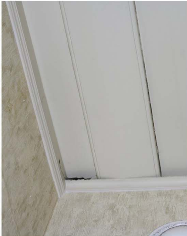
Pilt nr. 49. Katuslae laudis.