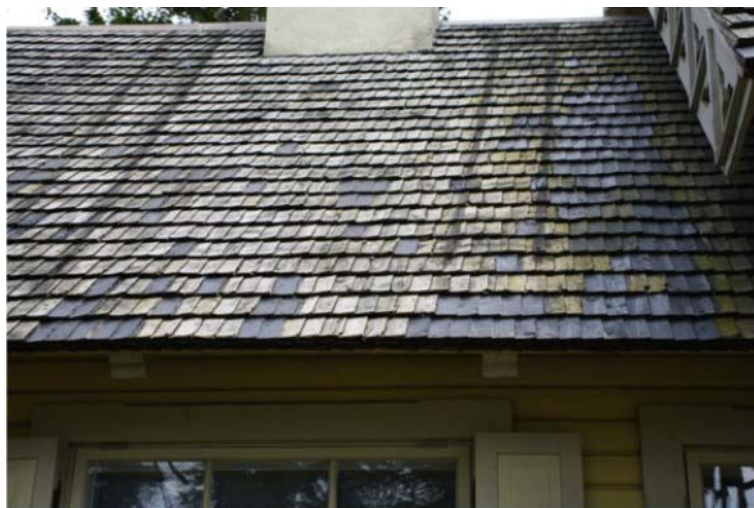
Pilt nr. 16. Vaade sindelkatusele. Tumedad jäljed on jäänud katusele eemaldatud redelist.