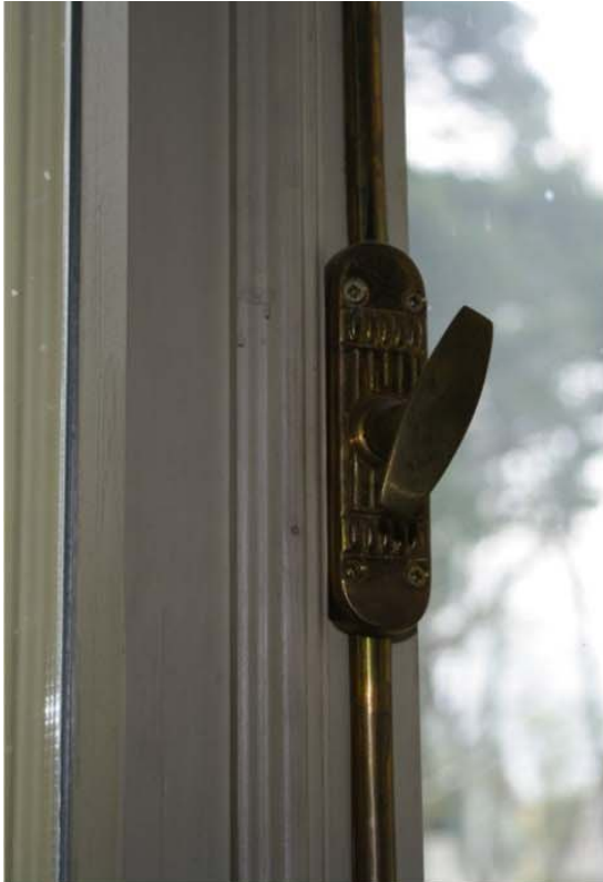
Pilt nr. 31. Akende sulused