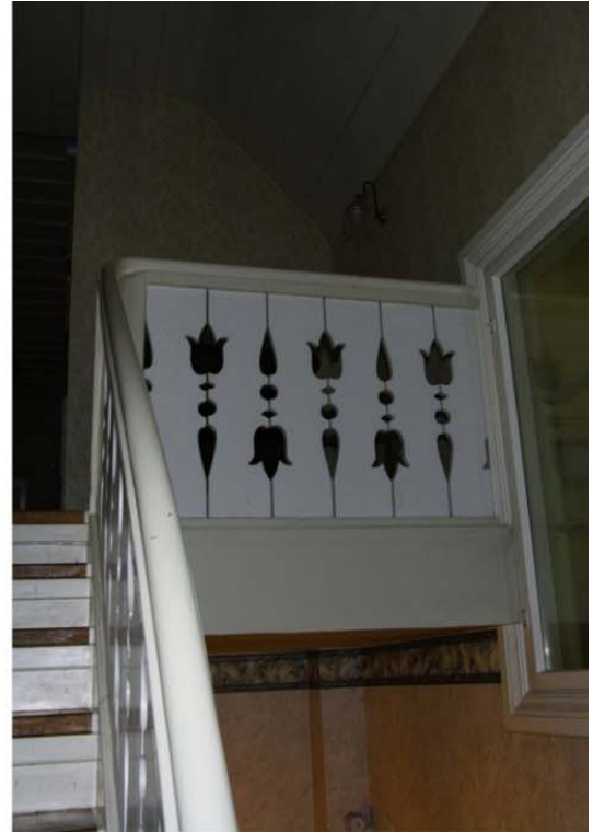
Pilt nr. 48. Kaunis saelõiketehikas piire.