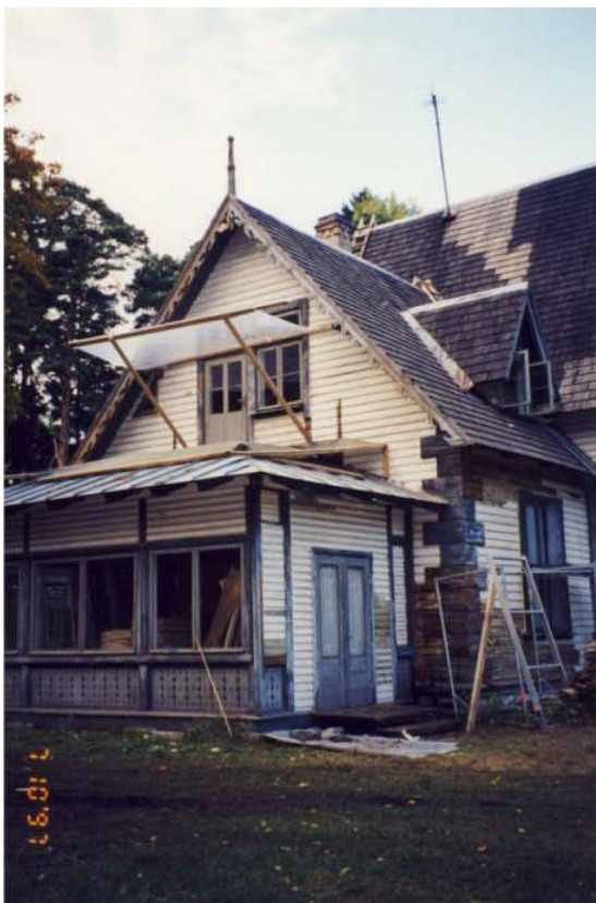
Pilt nr. 41. Laudadega suletud veranda. Pilt omaniku arhiivist, 1997