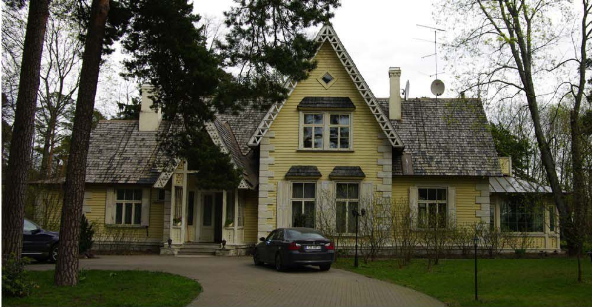
Pilt nr. 43. Maja fassaad