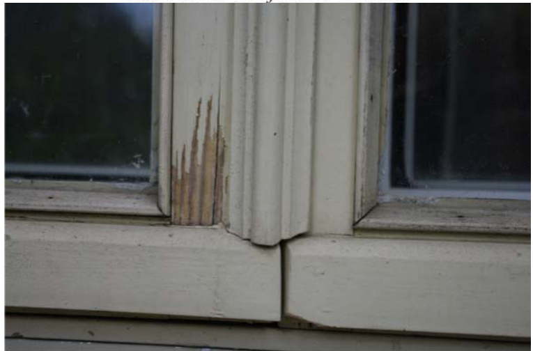
Pilt nr. 24. Aknaraamilt kooruv värv