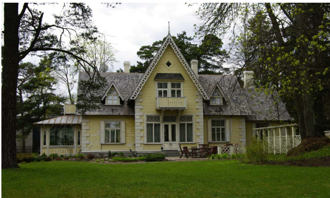
Pilt nr. 7. "Annenhof" aastal 2008.