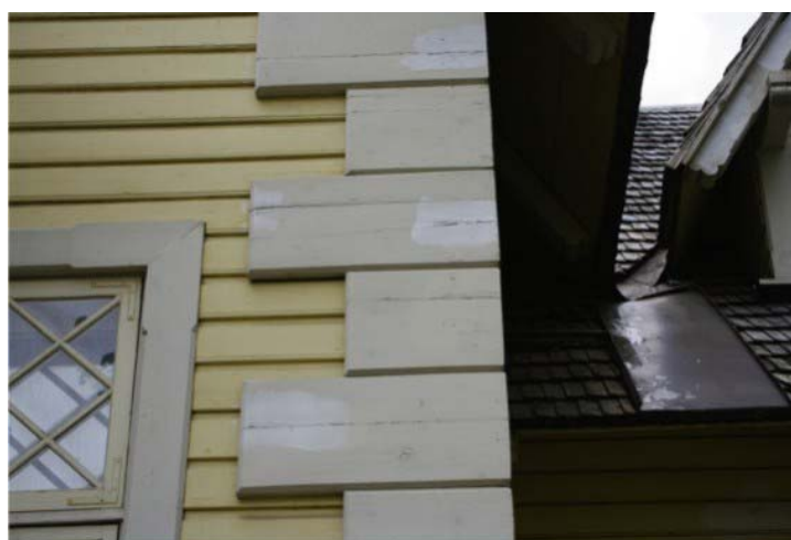
Pilt nr. 19. varasemad 2-osalised ja hilisemad 3-osalised nurgakvaadrid.