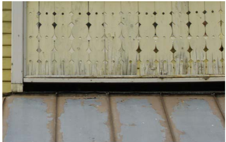
Pilt nr. 29. Niiskuskahjustused ja värvi koorumine piiretel.

Määrata põranda kalde suunad ning valmsitada uus rõdu aluspõrand koos kattega. Piirded puhastada hallitusest. Vajadusel valmistada uued piirded. Puhastatud või uued pinnad katta koheselt ilmastikukaitsega. Kasutada sama kruntimis- ja viimistlusmaterjale, mida on kasutatud varasematel puhkudel. Pinna esmane kaitse teostada fungitsiide sisaldava värvitu puidukaitsekrundiga ES Sadolin Pinotex Base. Seejärel värvida vastavalt hoone värvilahendusele naturaalse linaõlivärvidega Tikkurila LIN.