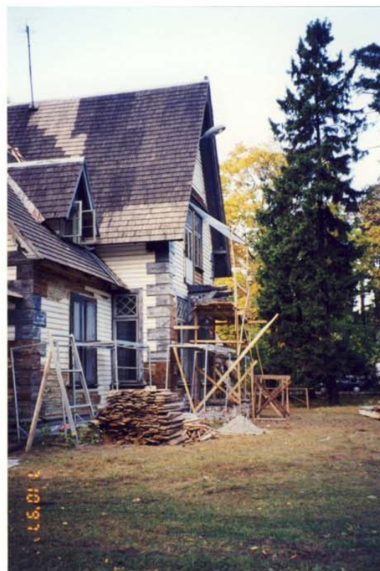
Pilt nr. 38. Vaade aiapoolsele fassaadile ja kahjustatud konsoolrõdule. 1997