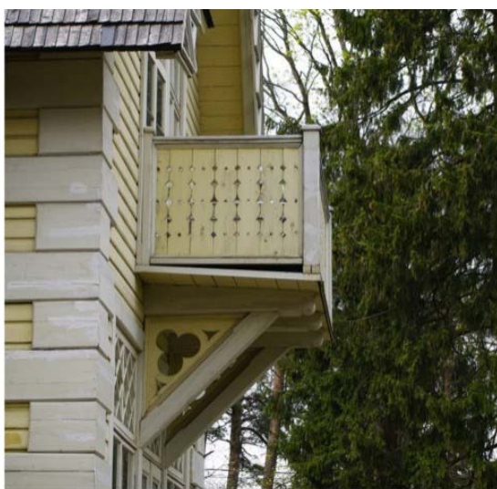
Pilt nr. 28. Konsoolrõdu küljelt. Näha on sarikaotstega sarnased talaotsad ning saelõiketehnikas kaunistused.

Seisukord ja kahjustused : mõlema rõdu puitlaudisega põrandad on kahjustatud niiskusest ja hallitavad, viimane on edasi kandunud piiretele. Põrandal puudub kalle, laudis on paigutatud liiga tihedalt üksteise vastu. Kalle on küll antud alus-põrandale, kuid puudub võimalus vee otseseks juhtimiseks rõdult. Vihma-vesi suunatakse külgedele, kuid kalle on tehtud ainult ühes suunas. Suuremate sadude ajal koguneb vesi aluspõrandale rõdu esikülje seina taha ja