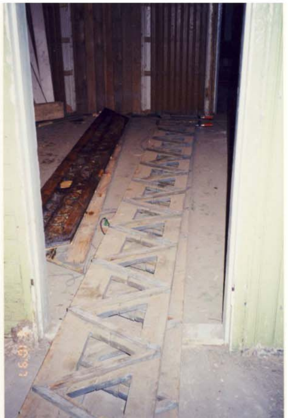
Pilt nr. 42. Korrastamiseks ja puhastamiseks maha võetud puitpits. Pilt omaniku arhiivist, 1997