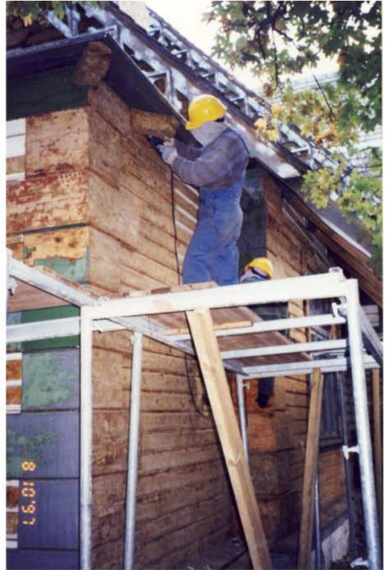
Pilt nr. 40. Värvikihtide eelmaldamine. Näha 4 erinevat kihistust.