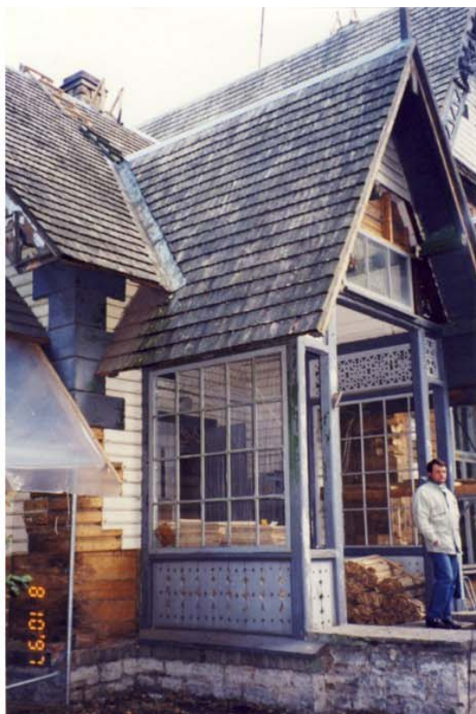
Pilt nr. 35. Viimane värvilahendus Pilt omaniku arhiivist, 1997