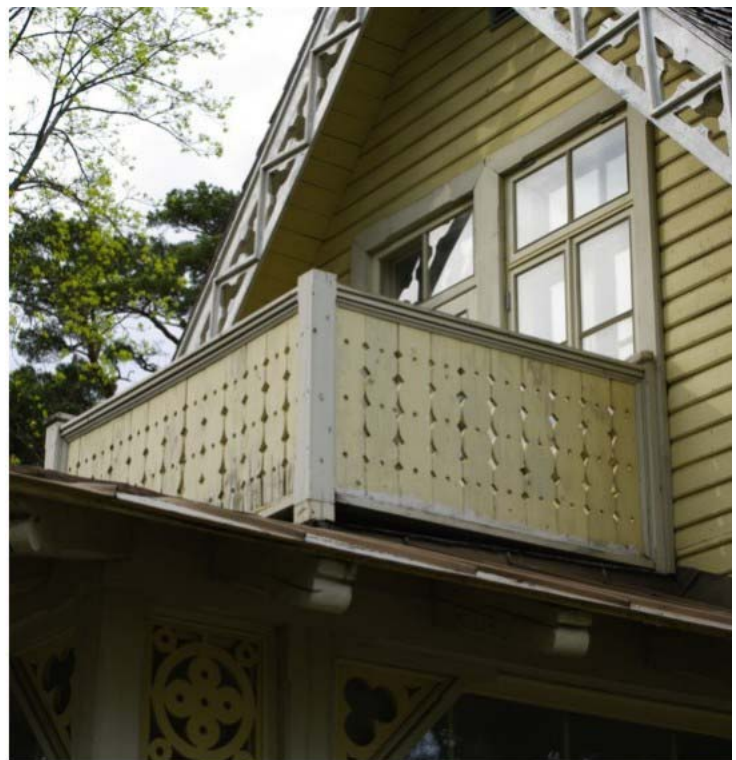
Pilt nr. 30. Niiskuskahjustused ja värvi koorumine piiretel.