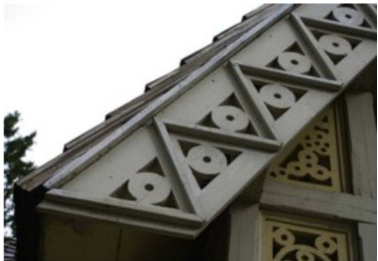
Pilt nr. 11. Element sissepääsu ees asuvalt portikuselt.

puutöökogemuste ning vormivõtete kaudu. Reeglina olid need sõrestikkonstruktsioonis plankudega üle löödud kerged ehitised, mis töötasid ainult suviti ja ega pidanud sooja. ( Karin Hallas „Puitarhitektuur stiiliajaloo kandjana” Tallinn 1999, Eesti Puitarhitektuur. )