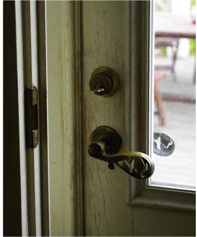
Pilt nr. 32. Uste sulused