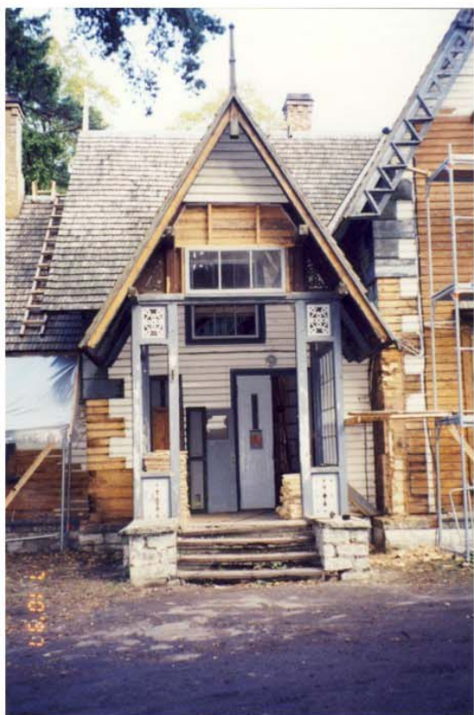
Pilt nr. 37. Portikus ja ebasümmeetrilise asetusega ukseava. Pilt omaniku arhiivist, 1997