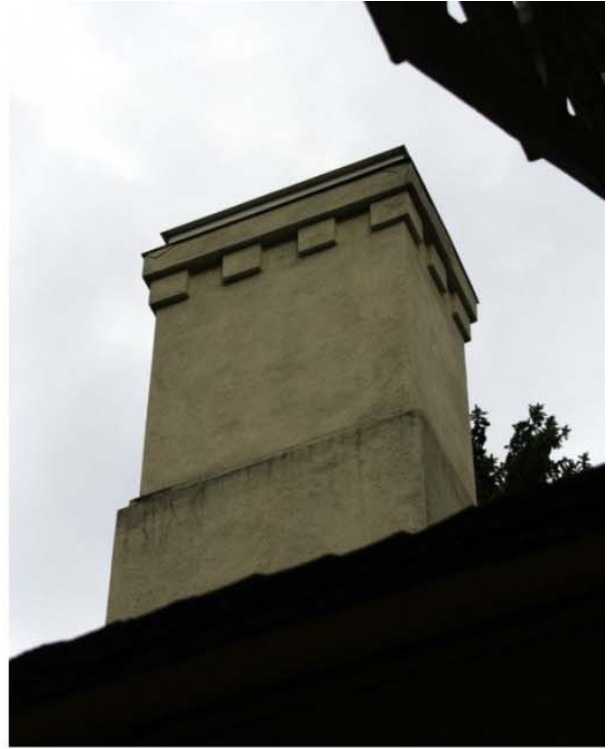
Pilt nr. 52. Korrastatud korstnapits.