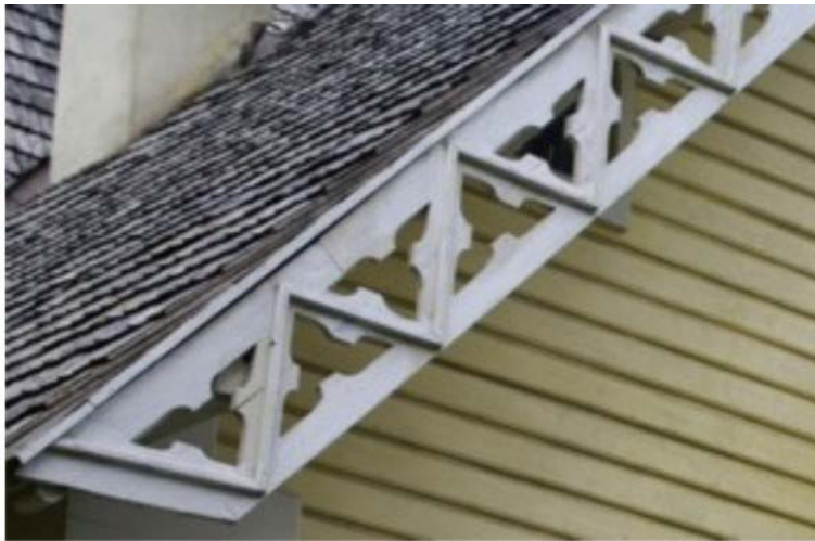
Pilt nr. 10. Annenhofi parema tiiva otsaviilu puitpitsdekoor, identne Kõltsu mõisa dekooriga.

arhitekti või ehitusmeistri kasutamist. ( Muinsuskaitseameti kodulehelt www.muinas.ee ) Mõlemad hooned ehitati väikese ajavahemiku jooksul 19 sajandi lõpul – Kõltsu mõis 1891 ( Andres Hein „Eesti Mõisaarhitektuur Historitsismist juugendini” Tallinn 2003 ) ja Annenhof 1896 aastal ( Ajalooarhiiv ).