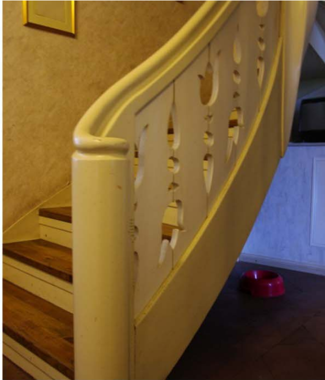
Pilt nr. 47. Kaunis saelõiketehikas treppiire. Astmelauad uued.