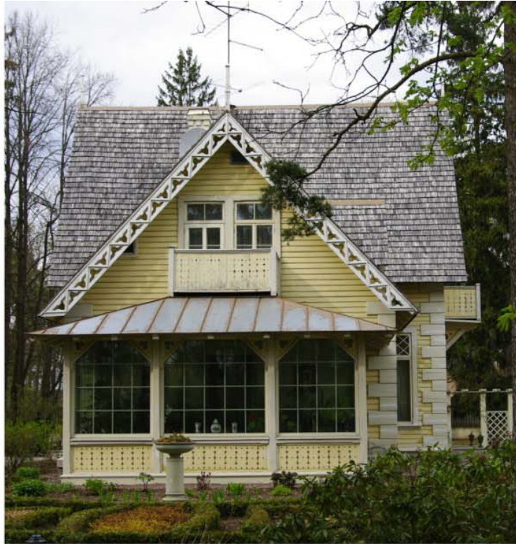
Pilt nr. 45. Maja otsafassaad koos taastatud verandaga