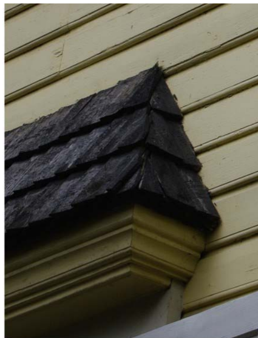
Pilt nr. 26. Sindelkattega karniis akna kohal.