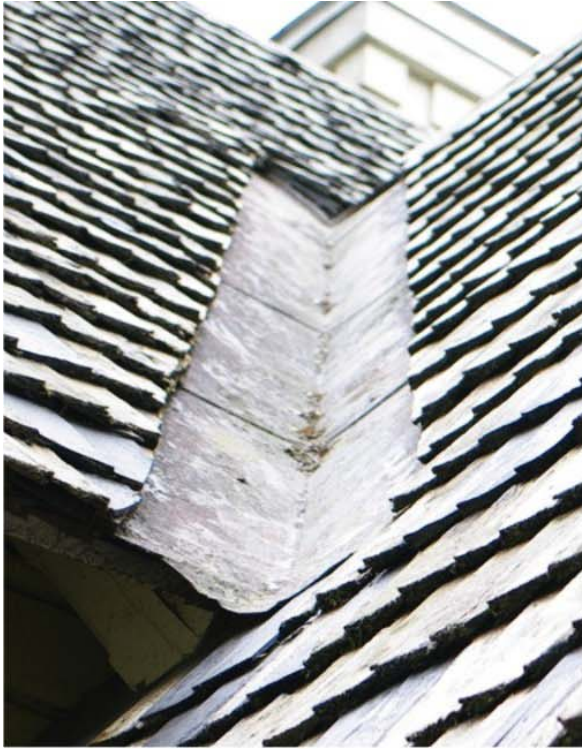
Pilt nr. 51. Katuse neelukohad on lahendatud pleki abil.