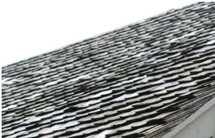
Pilt nr. 15. Kerkinud sindlid katusel.

Asendada pundunud osa uutega, jälgides, et asendatud osad oleksid võimalikult kõrgekvaliteedilisest puidust. Kaaluda võiks katuse