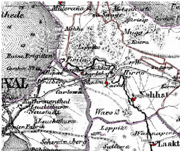
Pilt nr 2. Kose ja Vao mõisa maad enne 1917 aastat. Halduspiiride kaardiserver http://www.eha.ee/kupits/

1898 aasta 31. jaanuaril õnnestus lõpuks sõlmida kruntrendileping endise Vao (Facht) mõisa maade (Pilt nr 2) rentimiseks, mis kuulusid nüüd Tallinna linnale (raele). Leping koostati algselt 1,0925 ha suuruse maatüki kasutamiseks. Järnevate aastate jooksul -1902, 1907 - ostis E. Dehio maad juurde, laiendades kinnistu piire kuni Warsaallika ojani.