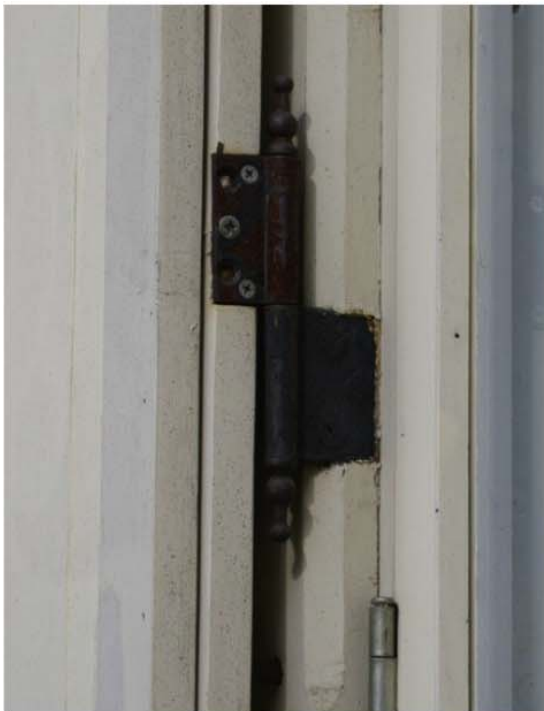
Pilt nr. 33. Luugi hing