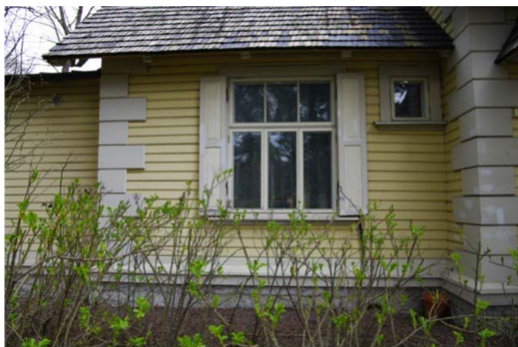
Pilt nr. 14. Hoone vasak tiib.

Seinte konstruktsioon on hästi säilinud ja kuiv. Välisseina konstruktsioonis näha kahjustusi vaid välisviimstlus).