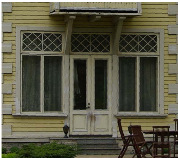
Pilt nr. 25. Aiapoolsete avarate akende ülaosa kaunistatud rombiline jaotusega.

Kahjustuste kõrvaldamine : puhastada uksed koorunud värvist. Mehaanilised kahjustused lihvida kergelt üle. Kui need ulatuvad liiga sügavale, siis asendada kahjustatud osad. Katta linaõlivärviga, kasutades välis-viimistluse passis määratud toone.