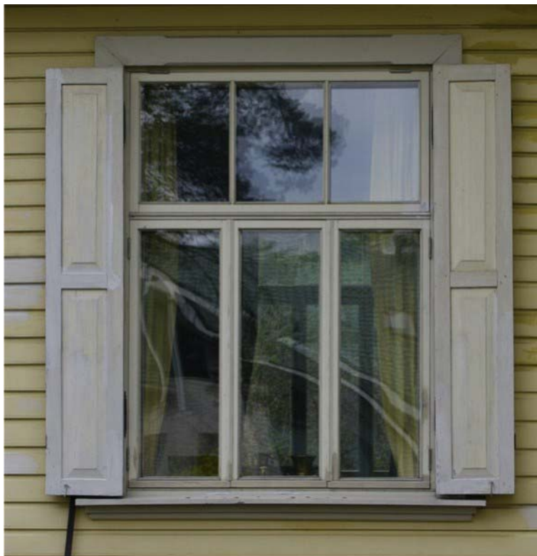
Pilt nr. 21. Hoone kolmeosaline aken

aknad ja luugid keskmises korras. Raamid on õhukesed ning klaasid kinnitatud puitliistuga. Mõnedel akendel on vana piida ja uue raami vahel näha suuri pilusid (Pilt nr. 22).