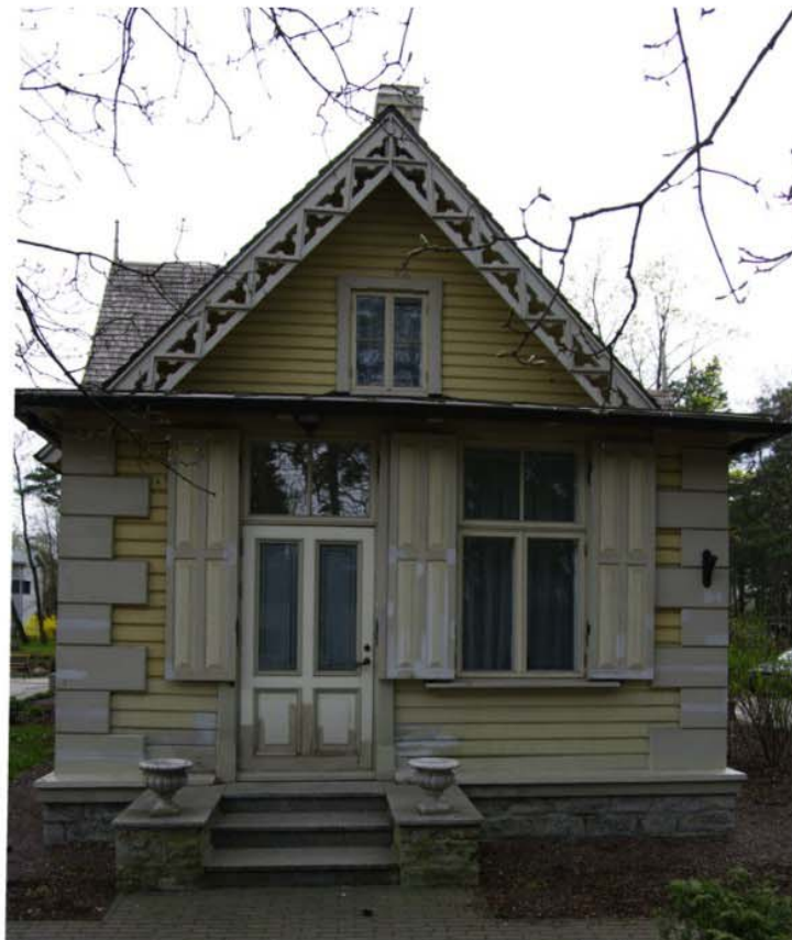
Pilt nr. 46. Ilmastikutingimuste poolt enim kahjustatud fassaad