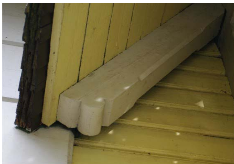
Pilt nr. 17. Kolmekihiline sindelkatus ja sarikaots.