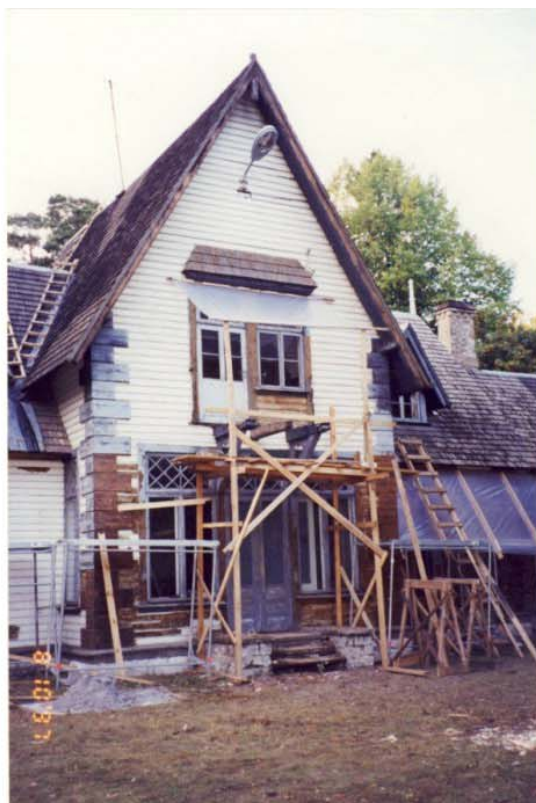
Pilt nr. 36. Laudise ja nrugakvaadrite puhastamine Pilt omaniku arhiivist, 1997