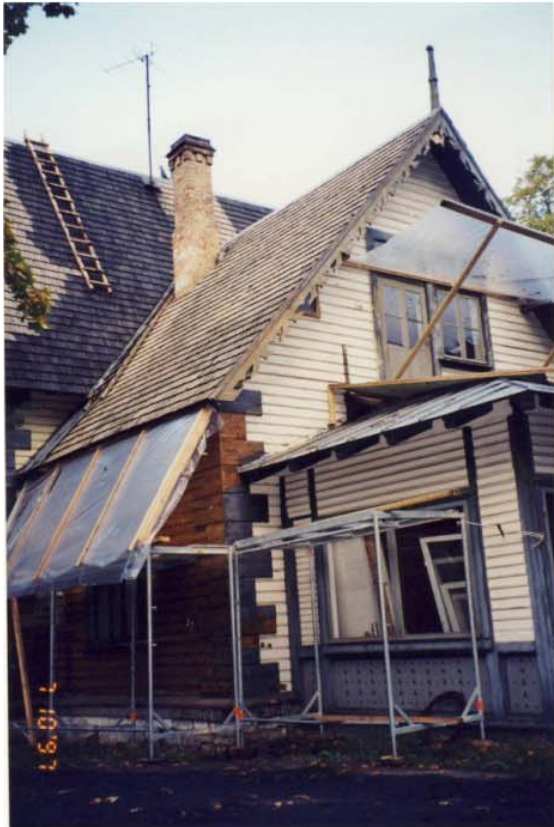
Pilt nr. 39. Vaade läänepoolsele otsale