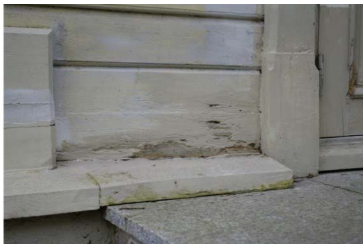
Pilt nr. 18. Graniitplaadile toetuv soklilaud on tihedalt seotud laudvoodriga. Niiskuskahjustused liiguvad seina mööda ülespoole.

Ühelt poolt toetub soklipealne laud treppide juures kivipinnale ning