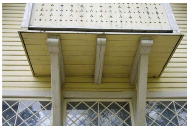
Pilt nr. 27. Konsoolrõdu hoiab seda niiskena.

Sadeveed kogunevad põrandale, seal puudub korralik äravool.