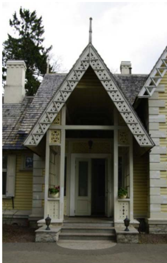
Pilt nr. 12. Saelõikeornamendiga kaunistatud portikus