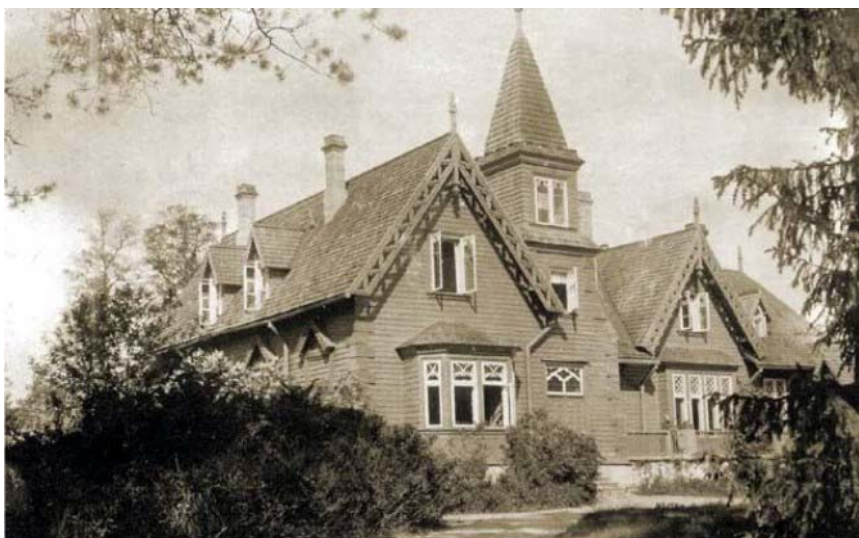
Pilt nr.9. Kõltu mõis. Vasakpoolse viilu puitpitsmuster identne „Annenhof”i parema tiiva otsaviilu puitpitsmustriga. Foto J.Vali kogust 1910.

„Annenhof” suvmõisal on puitpitsdetailide osas äratuntav sarnasus Laulas-maal asuva Kõltu mõisaga (pilt nr 9). Neil on ühel viilul identne puitpitsdekoor (pilt nr 10), kõrged telkkatused ning puidust nurgakvaadrid. Ei saa välistada ka sama