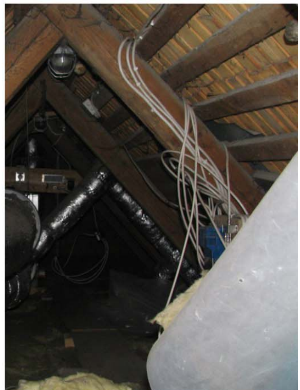
Pilt nr. 50. Katuse kandekonstruksioon Pildi autor Kaire Rjadnev-Meristo