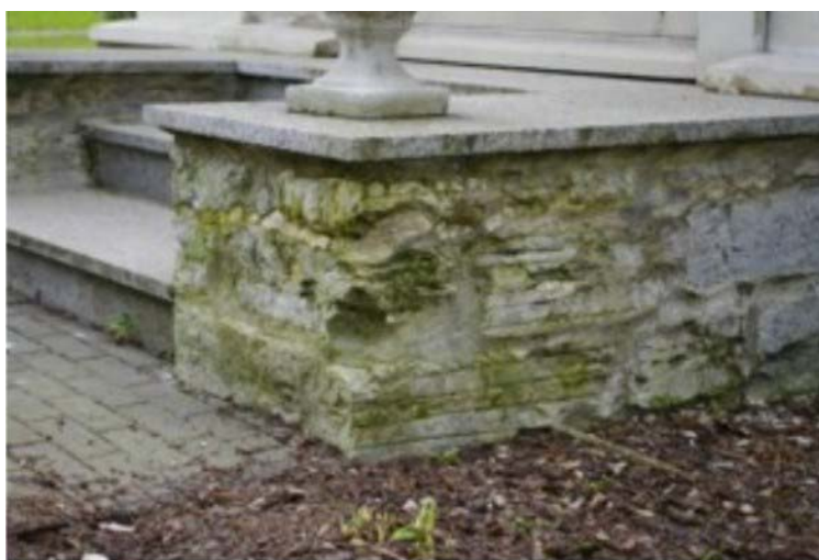
Pilt nr. 13. Hoone vasaku tiiva sokkel

Tekkepõhjus : ümber maja rajatud ~80 sm laiune peenest