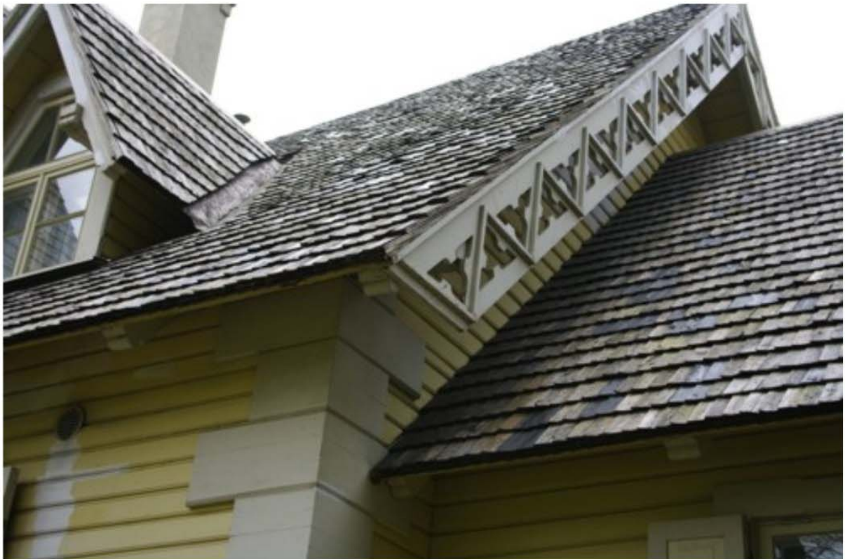
Pilt nr. 53. Kõrge katus on mitmeastmeline ja keerukas.