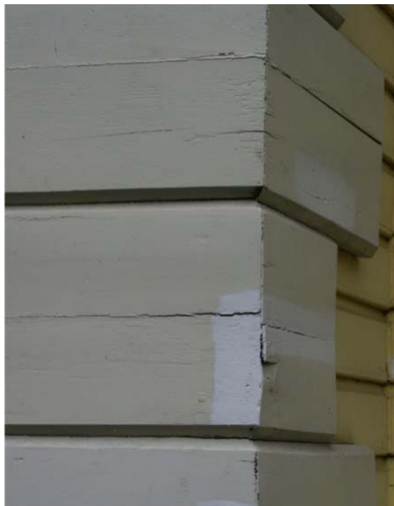
Pilt nr. 20. Lagunenud nurgakvaadrid.

Puhastatud või uued pinnad katta koheselt ilmastikukaitsega. Kasutada sama kruntimis- ja viimistlusmaterjale, mida on kasutatud varasematel puhkudel. Pinna esmane kaitse teostada fungitsiide sisaldava värvitu puidukaitsekrundiga ES Sadolin Pinotex Base. Seejärel värvida vastavalt hoone värvilahendusele naturaalse linaõlivärvidega Tikkurila LIN.