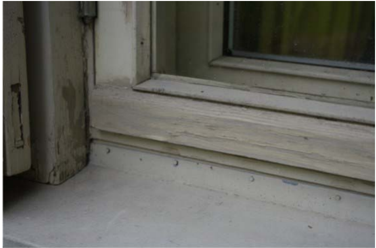
Pilt nr. 23. Aknaraamilt kooruv värv

sarnaselt akendele koorub ustel värv. Suurem osa põhjustatud ilmastikutingimustest, osadel välisustel mehaanilised kahjustused, mis on põhjustatud pere lemmiku – iiri hundikoera läbematust soovist tuppa pääseda.