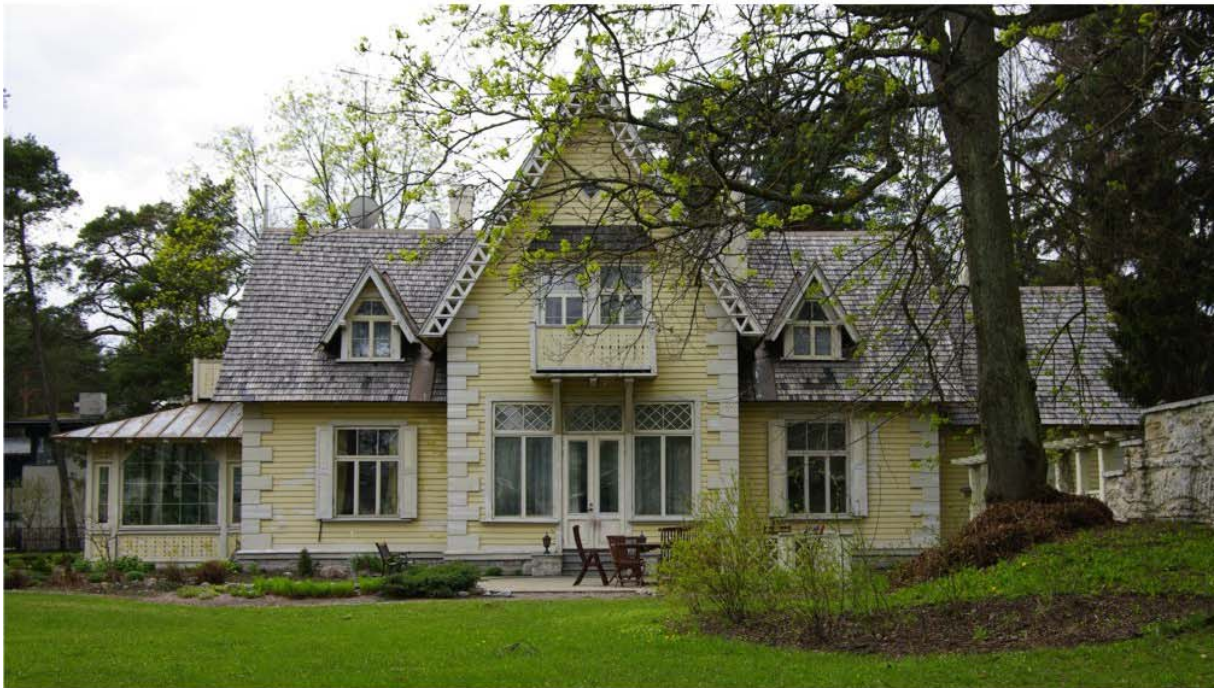
Pilt nr. 44. Maja aiapoolne fassaad