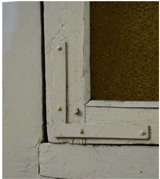
Pilt nr. 34. Akna nurgik