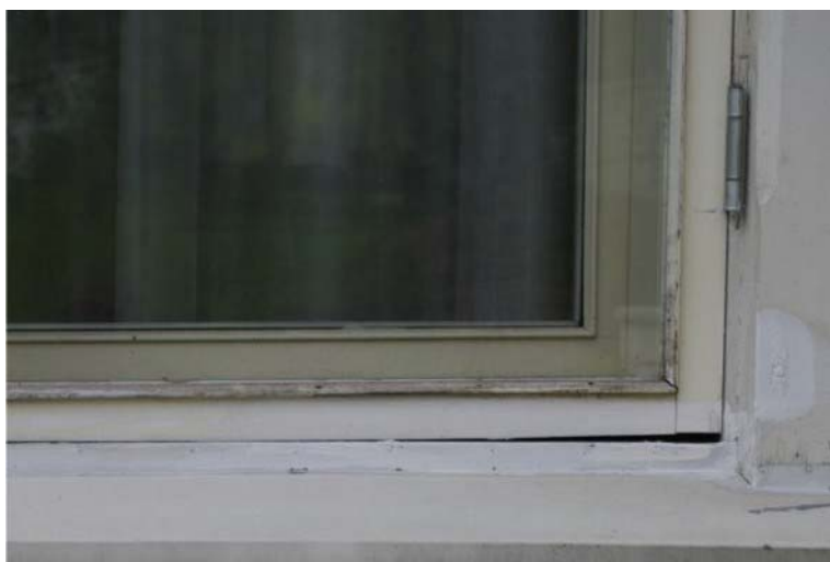
Pilt nr. 22. Pilu akna ja raami vahel