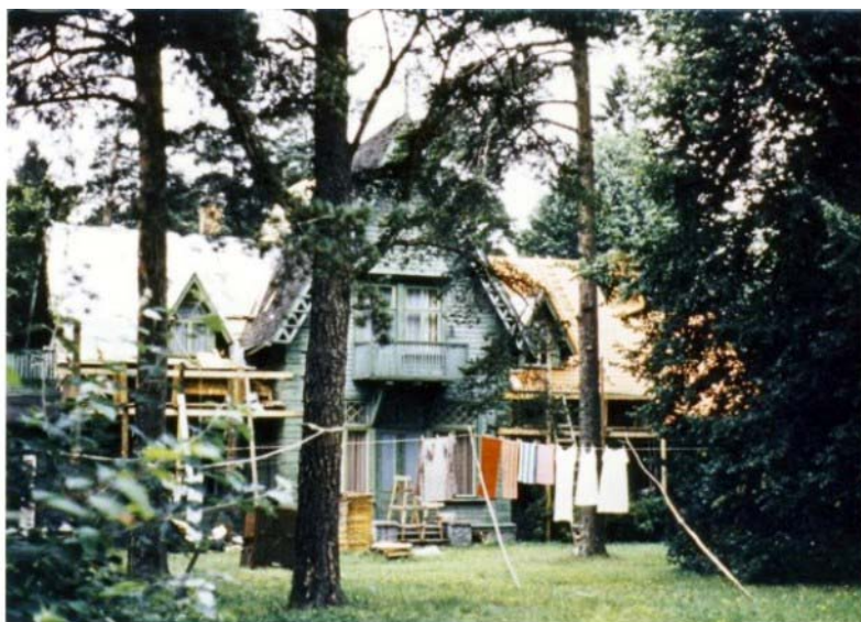
Pilt nr. 6. Maja kasutusel korteritena. Hoone fassaad värvitud roheliseks uuringute järgi teine värvikiht).

18.06.1953.a. anti vabriku „Punane Koit”bilanssi. Makstud 1335 rubla. Tallinna Linnaarhiiv Seejärel oli maja pikka aega Majandusministeeriumi halduses olev vara. Suviti korraldati seal laagreid, nagu endiste „pikakoivaliste gümnasistide” päevil mängisid lapsed metsas indiaanlasi. Vahepeal oli kasutusel elamuna - hoone jagati korteriteks (Pilt nr. 6). Kasutajate