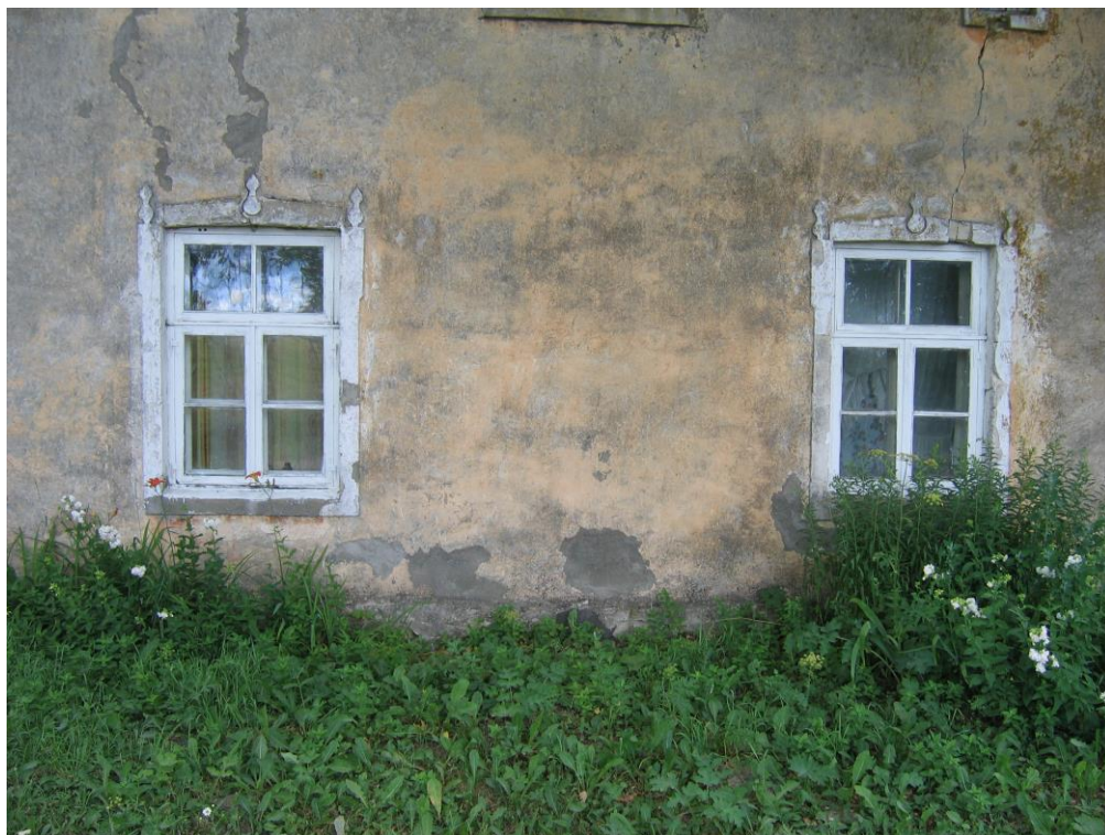
Foto nr 1 - Liuka talu eluhoone 2006.a.