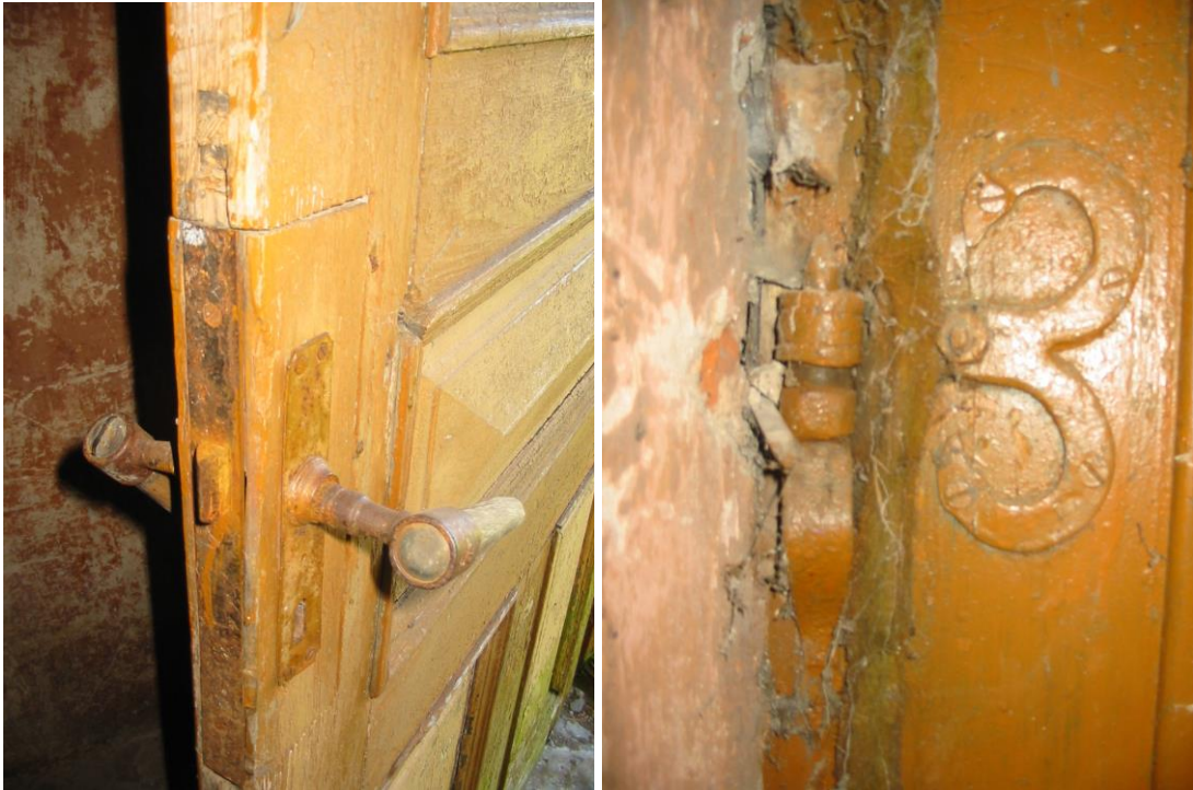
Fotod nr 34, 35 – VU-3 sulused.