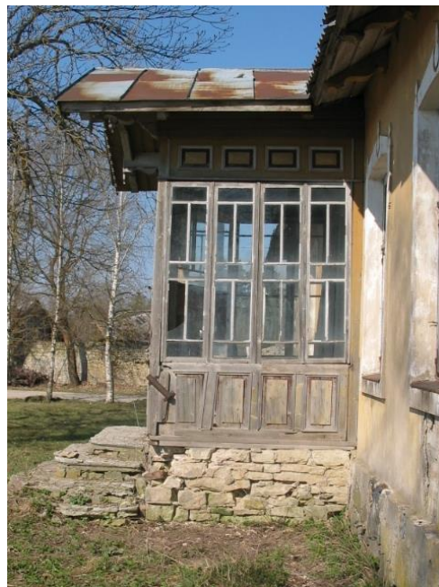
Fotod nr 11, 12 – Veranda vaated.