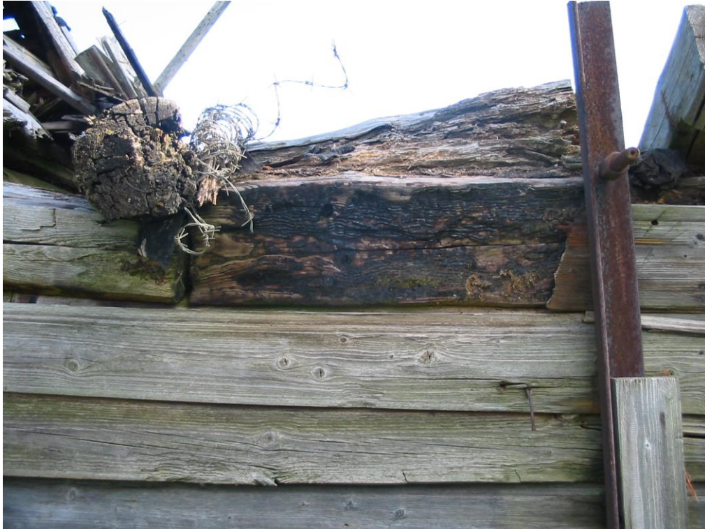
Foto nr 40 – 1893.a. põlengu jälg vana voodrilaua all aastal 2008.