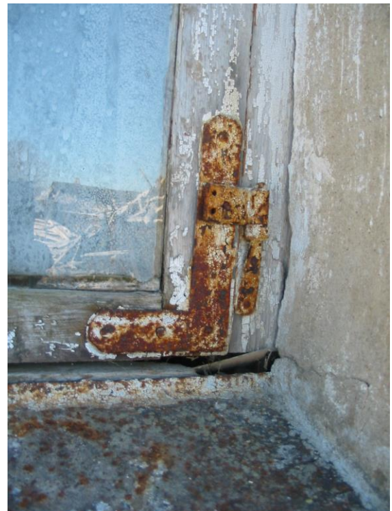
Fotod nr 22-25 – Akna manused.