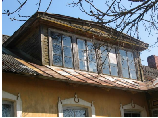
Fotod nr 4, 5 – Katuse väljaehitised.