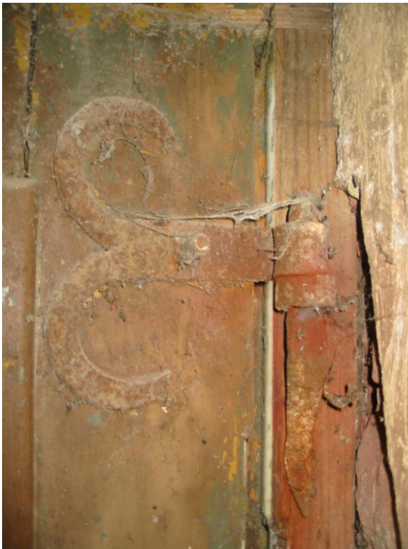
Fotod nr 30-32 – VU-2 sepišmanused.