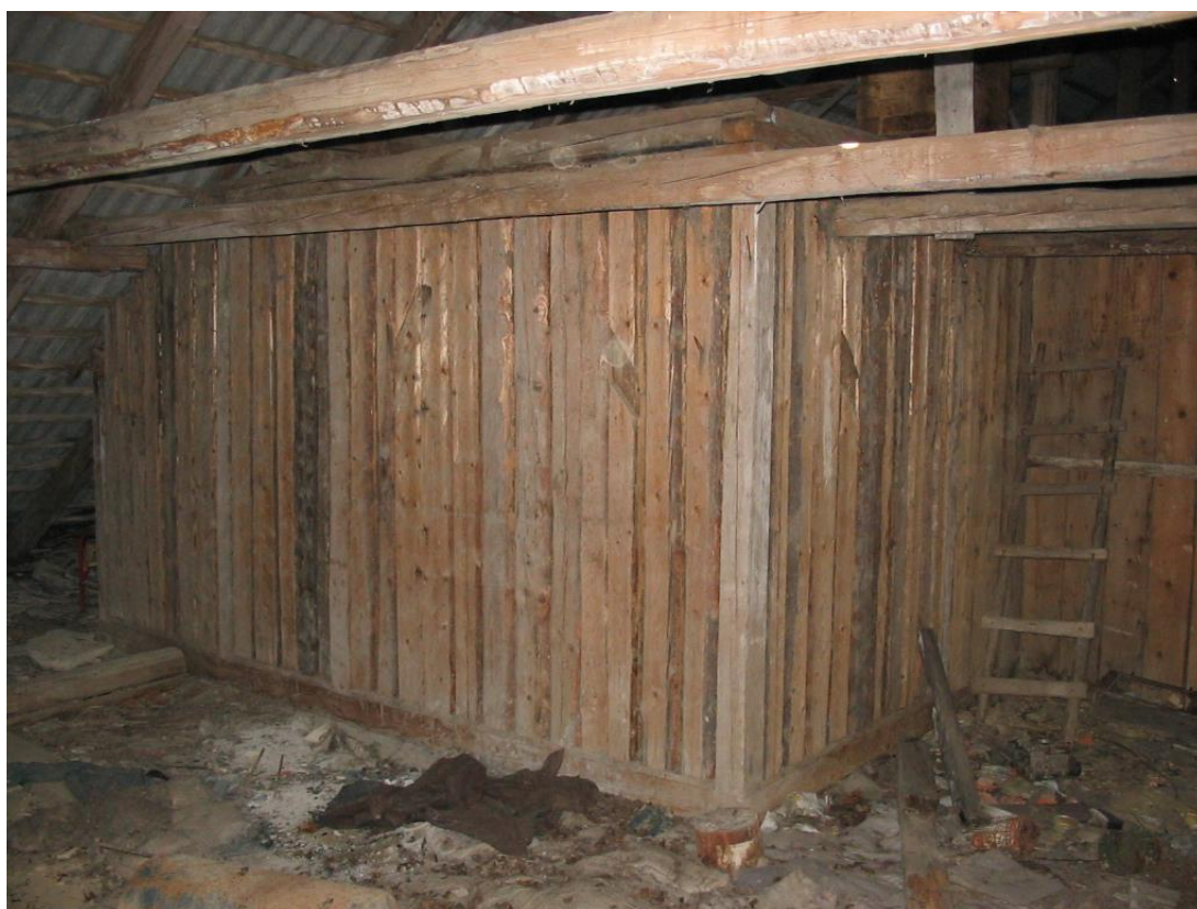
Foto nr 2 - Ärklitubade püstpalksein pööningul.