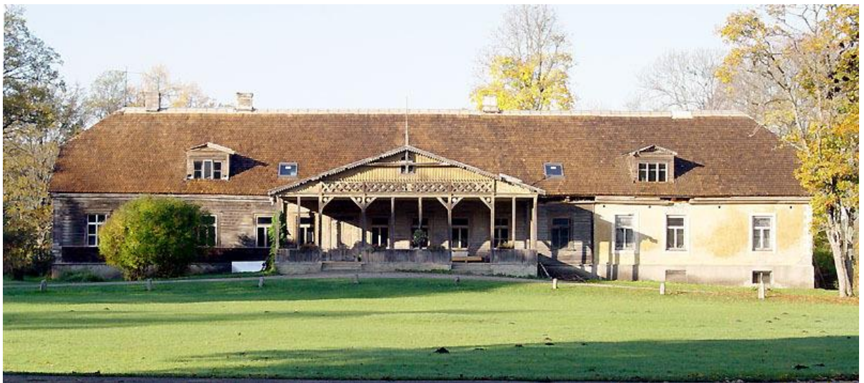
Foto nr 41 - Esna mõis kaasajal.