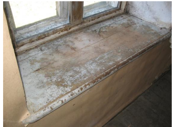
Foto nr 27 - Aknalaud.