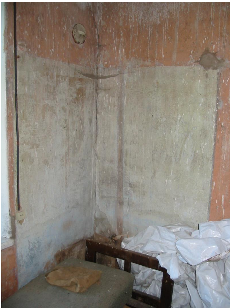
Foto nr 1 - Tuba nr 4, hävinud peldiku (lepingu termin) jäljed seinal.