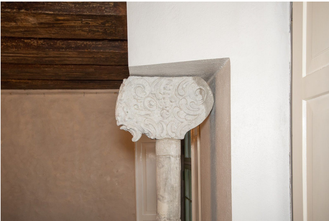
Pilt 4: Kuninga 6 kapiteel.