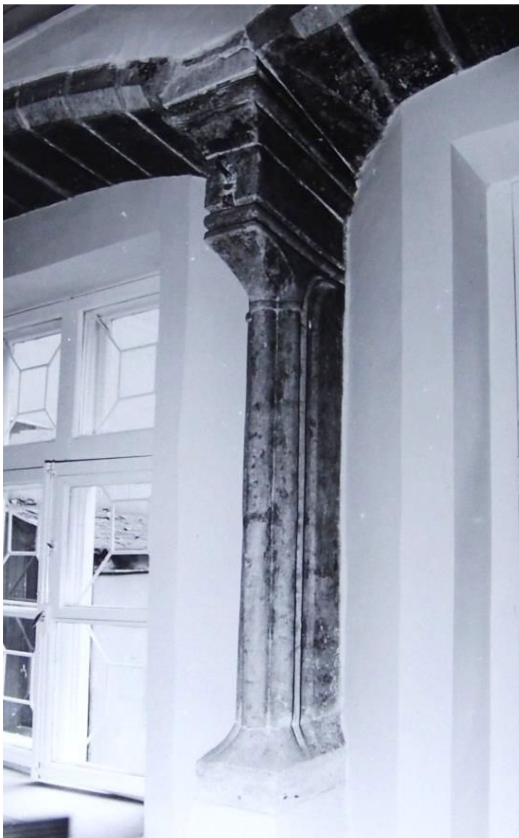
Pilt 9. Lai 40 aknapiilar.