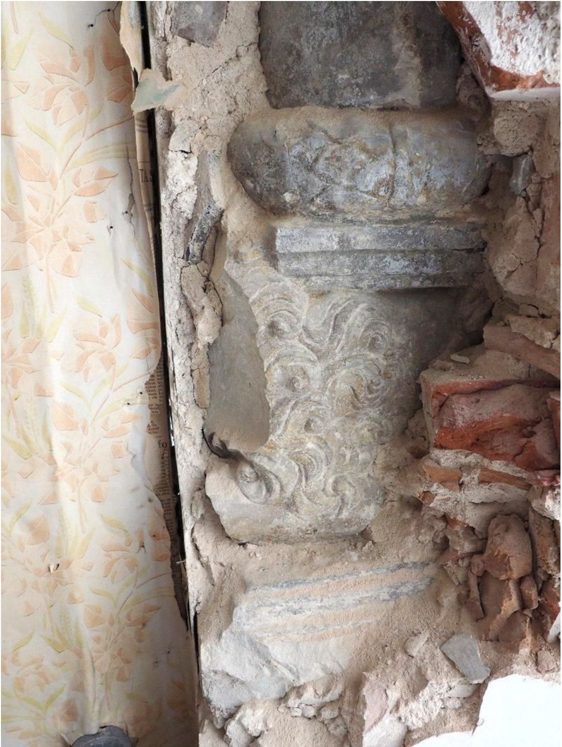
Pilt 20. Pikk 60 samba fragment.