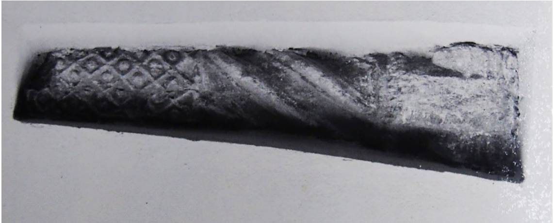
Pilt 34. Fragment Rüütli 16 fassaadil.