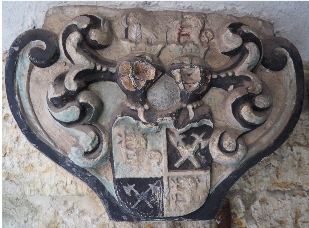
Pilt 30. Von Uexkülli vapiga konsool.