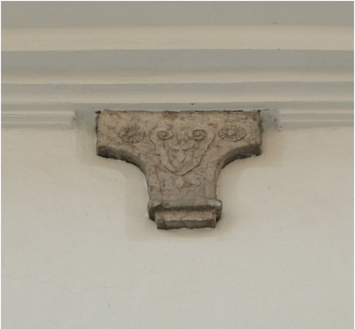
Pilt 10. Lühike jalg 5 konsool.