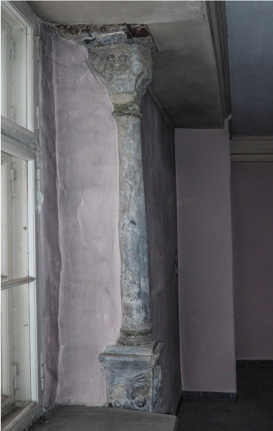
Pilt 29. Rataskaevu 5 aknasammas.