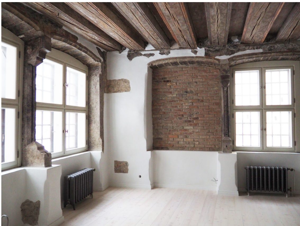
Pilt 28. Rataskaevu 14 aknapiilarid.