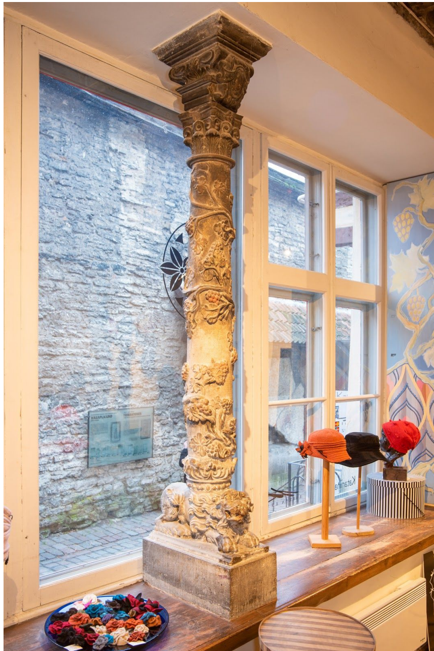
Vene 12, kübaratöökoda