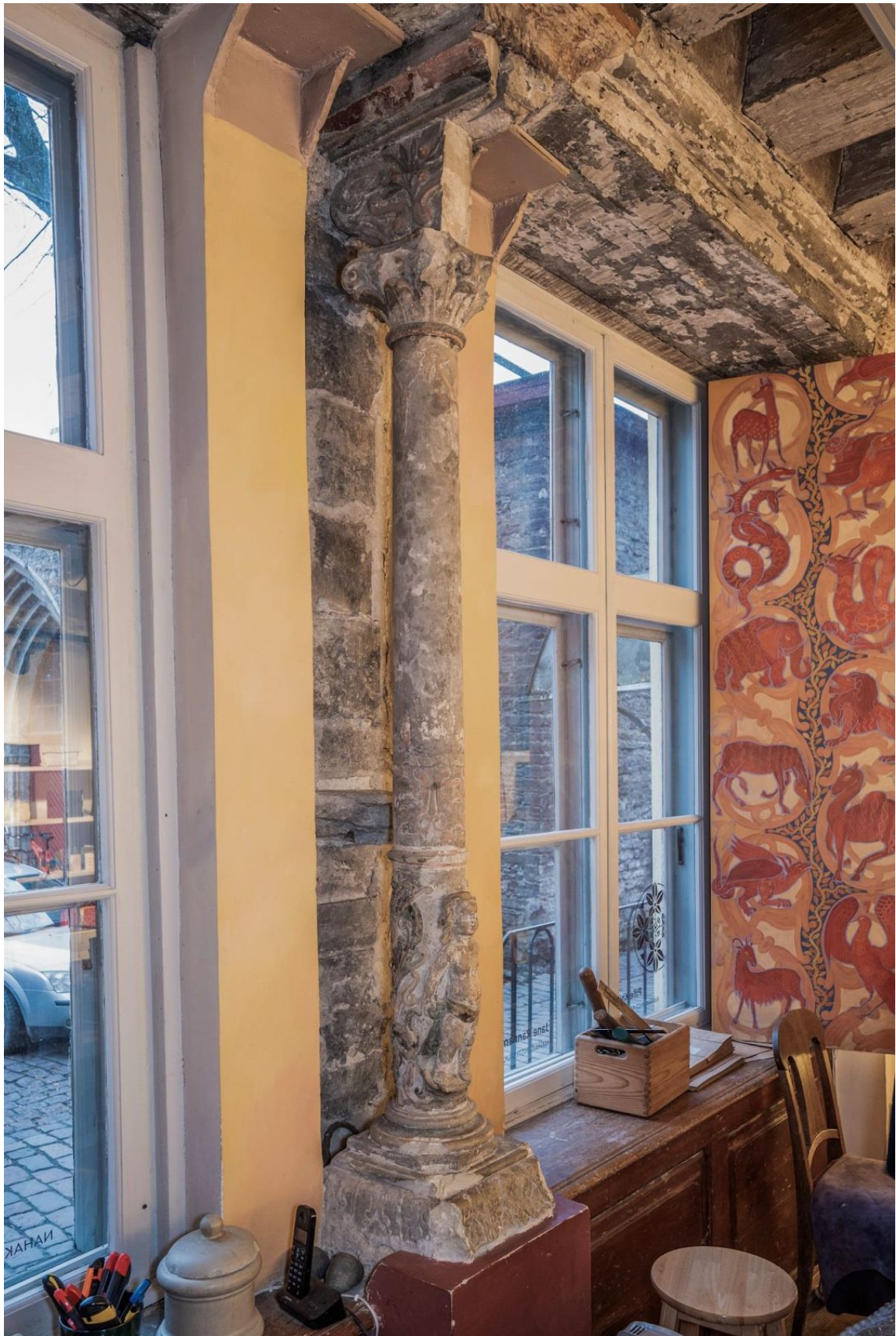
Pilt 43. Vene 12 putoga aknasammas.