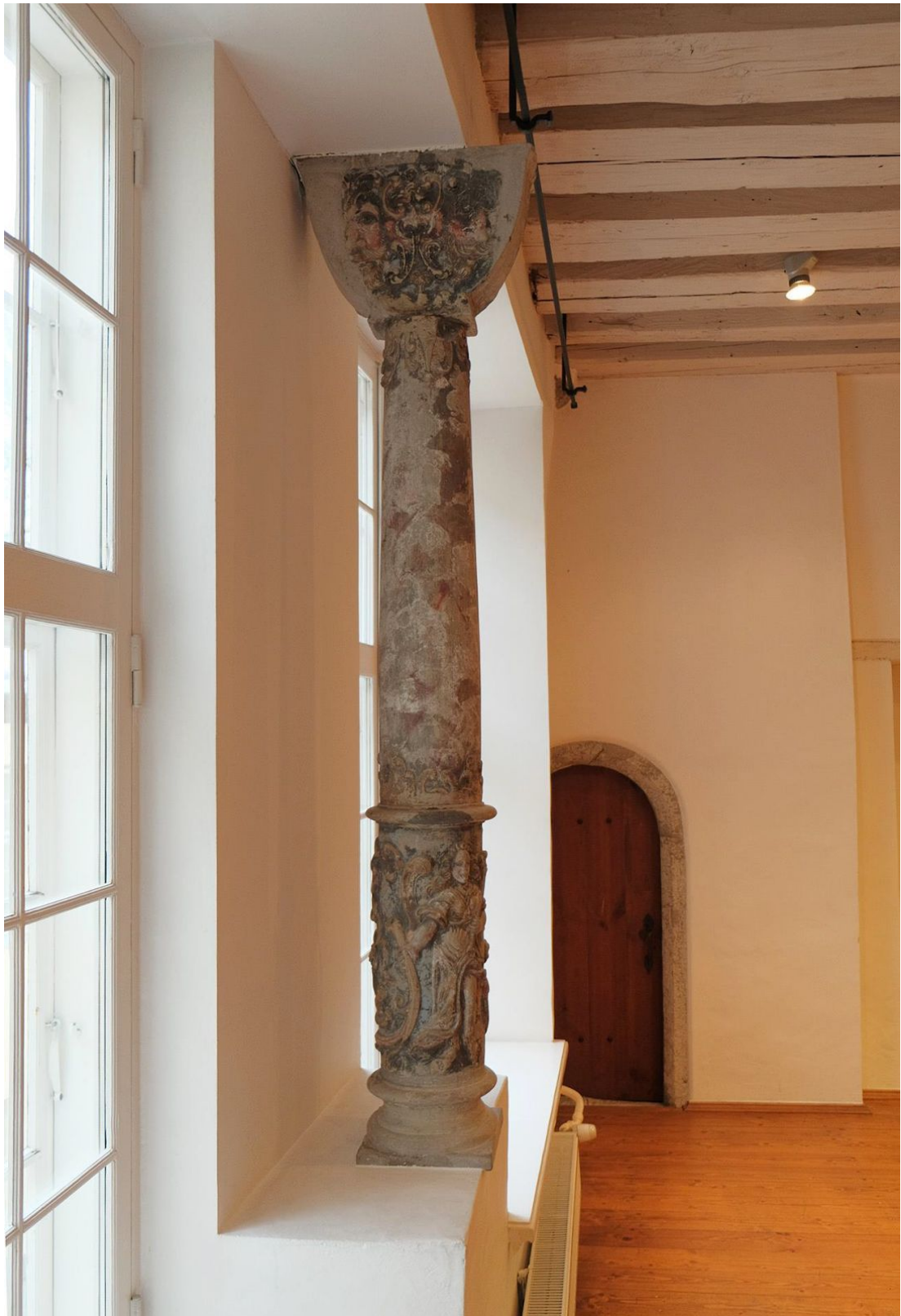
Pilt 39. Tolli 4 asuv aknasamams.