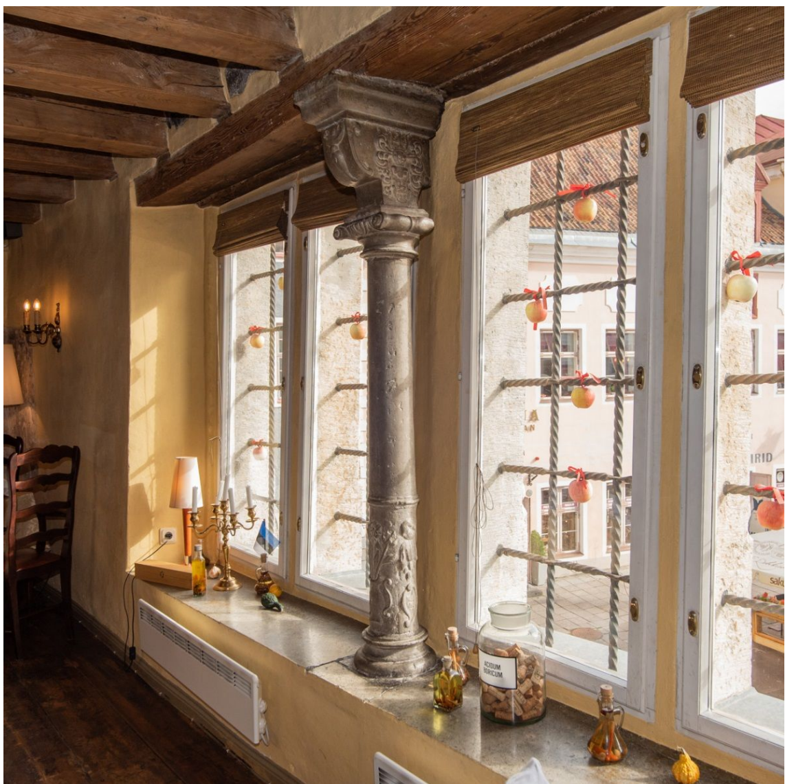
Pilt 26. Raekoja plats 11 tagumise ruumi aknasammas.