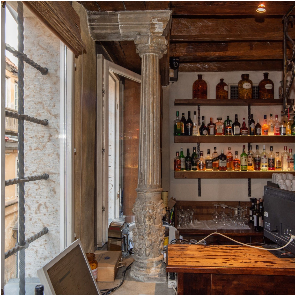
Pilt 24. Raekoja plats 11 II korruse Passeri aknasammas.