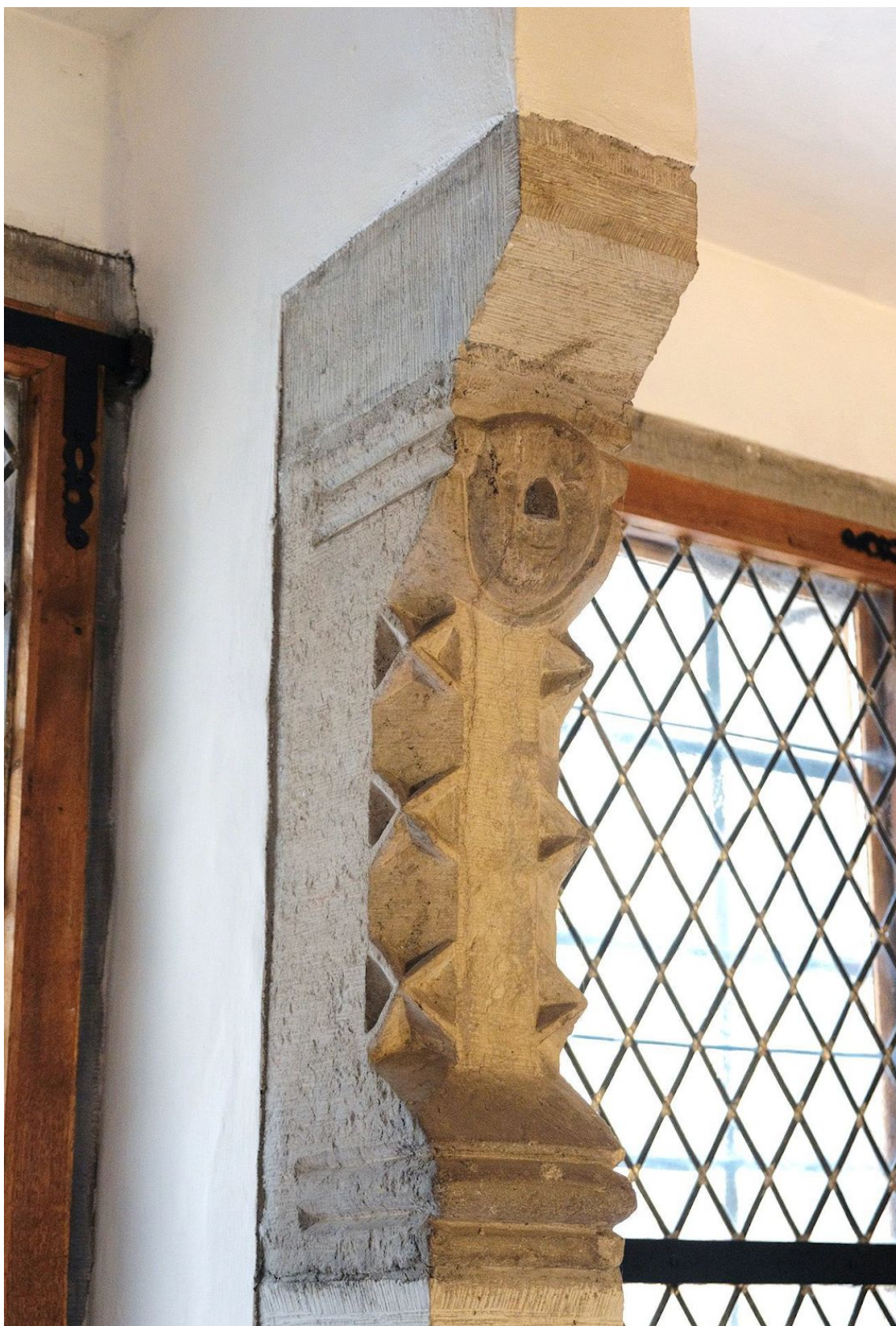
Pilt 40. Toli 6 aknasamba fragment.