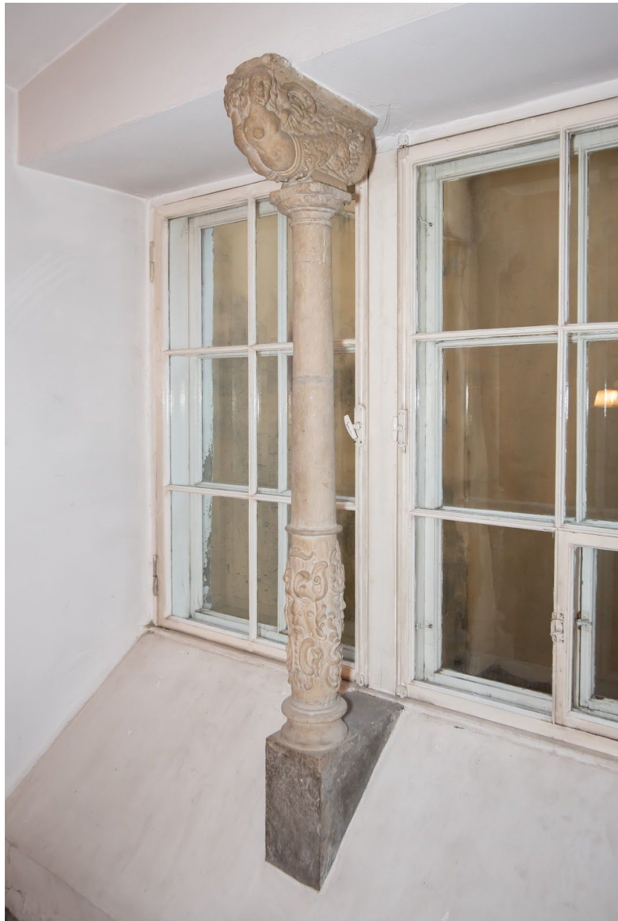
Olavi saal, Mustpeade maja