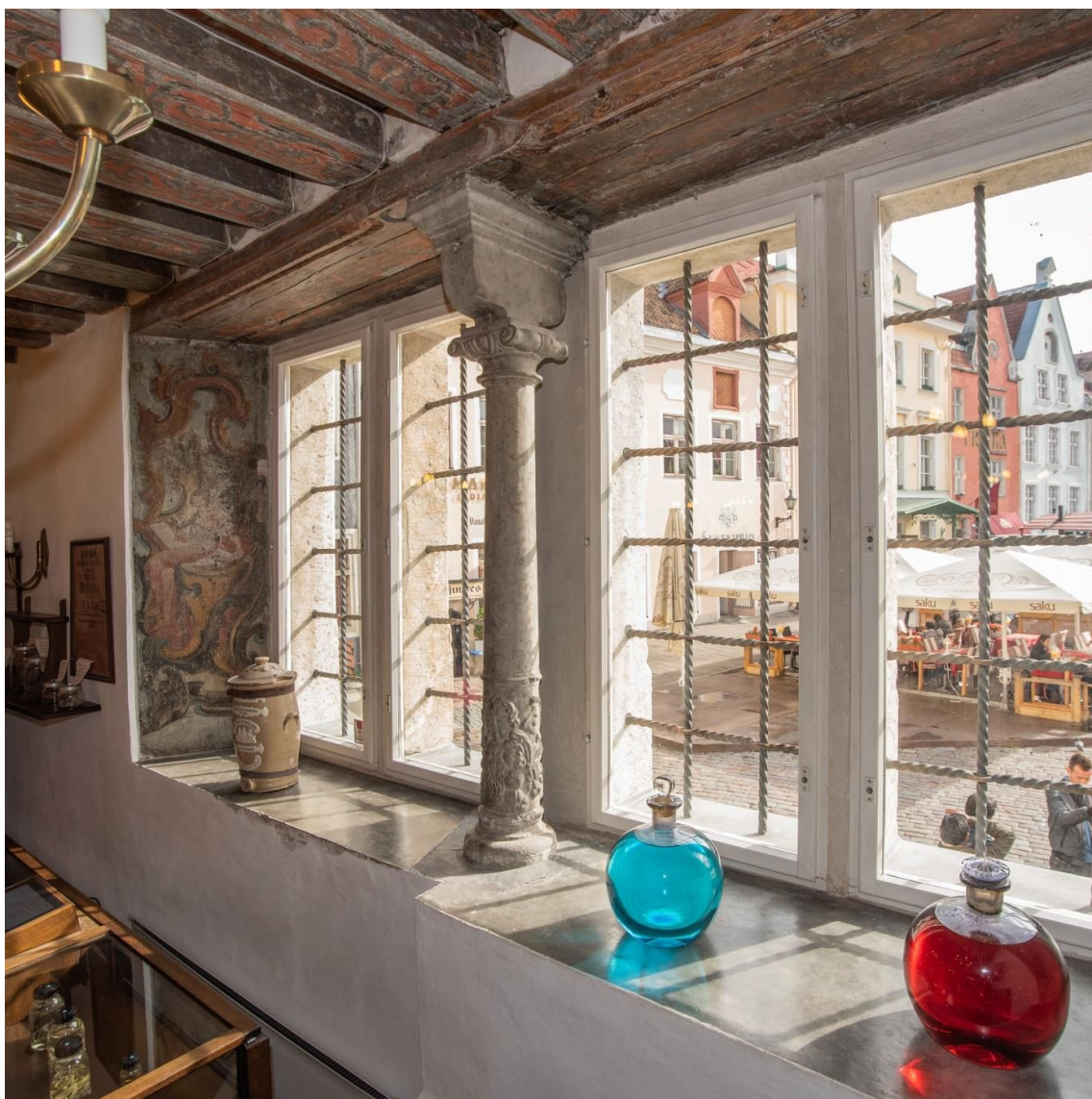
Pilt 23. Raekoja plats 11 aknasammas Raeapteegis.