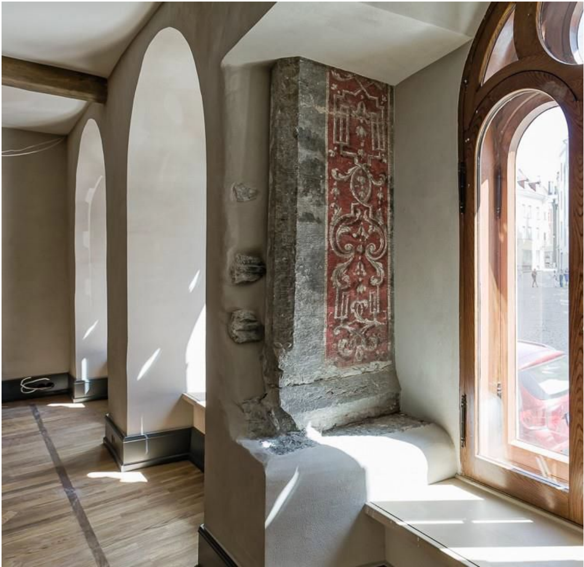
Pilt 6. Lai 9 aknapiilar.