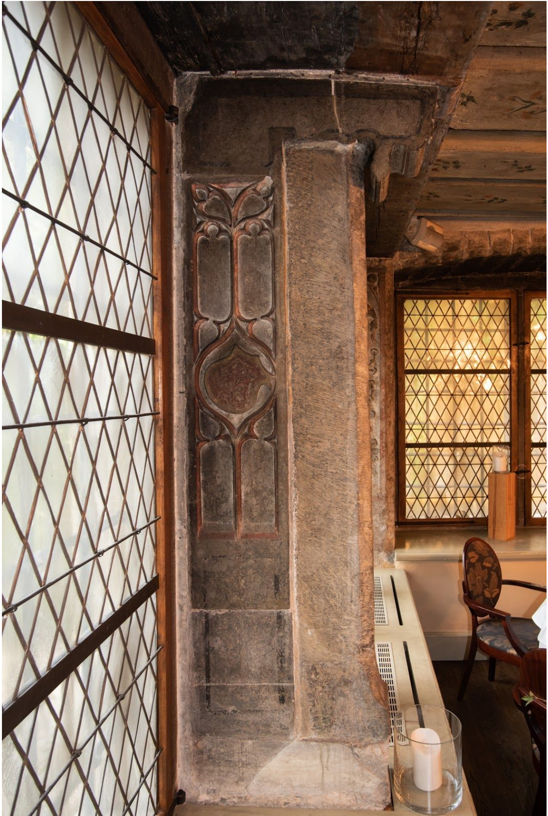
Pilt 41. Vene 10 vasakpoolne aknapiilar.