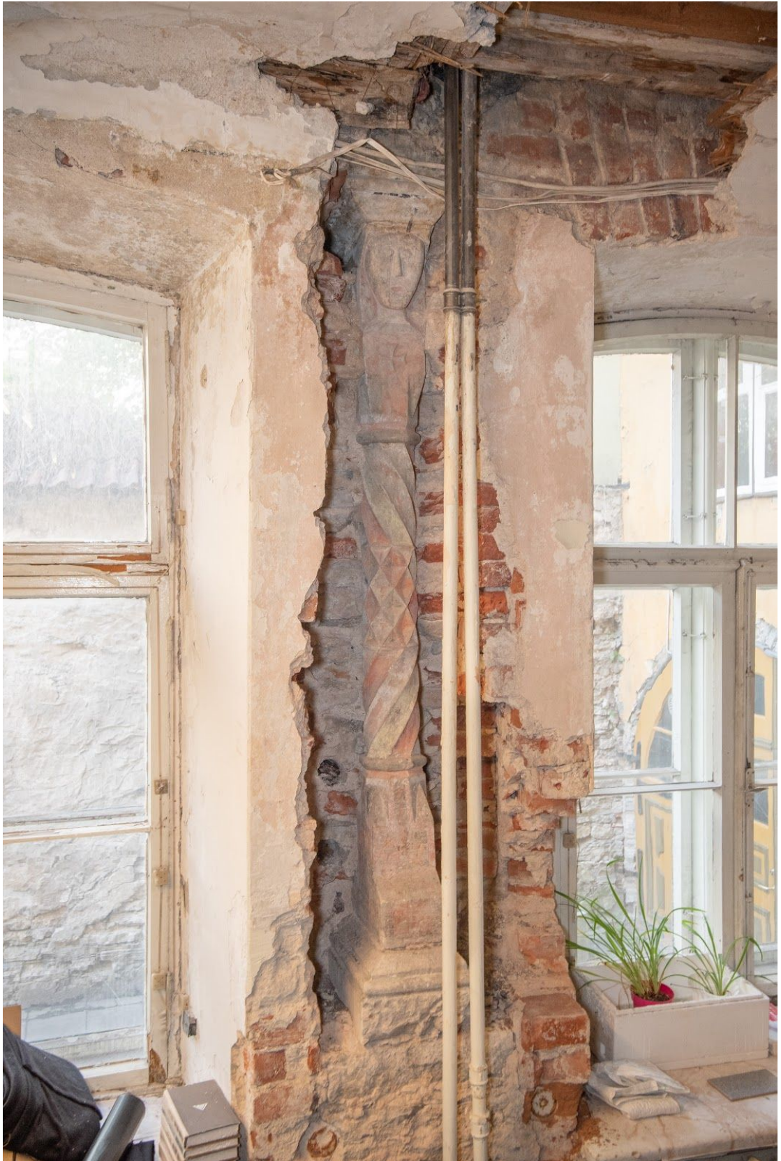
Pilt 8. Lai 25 aknasammas.