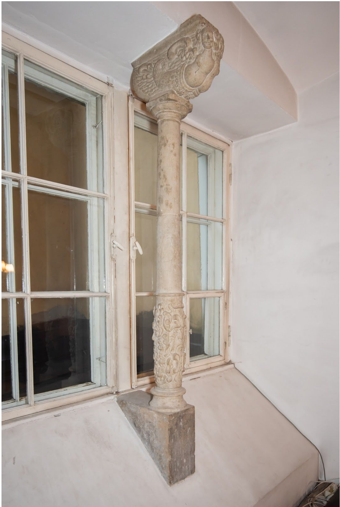
Pilt 15. Olavi saali aknasamba koopia.