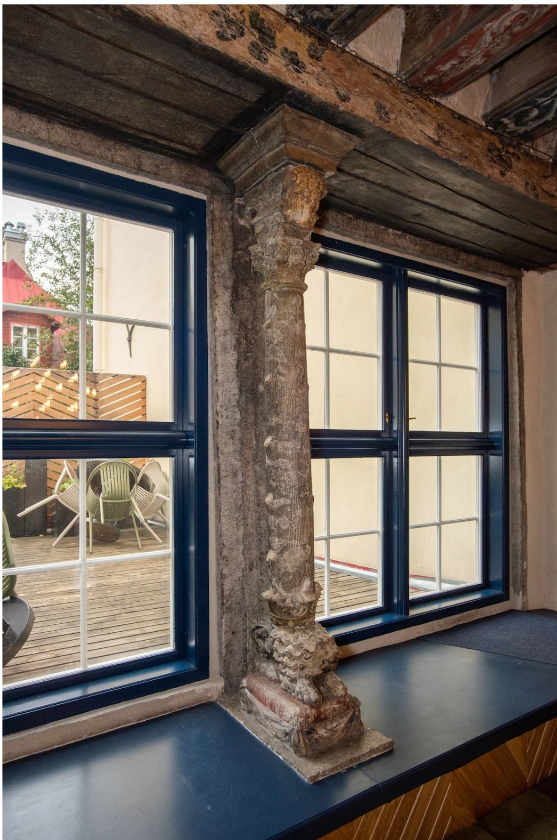
Pilt 17. Pikk 45 aknasmmas.