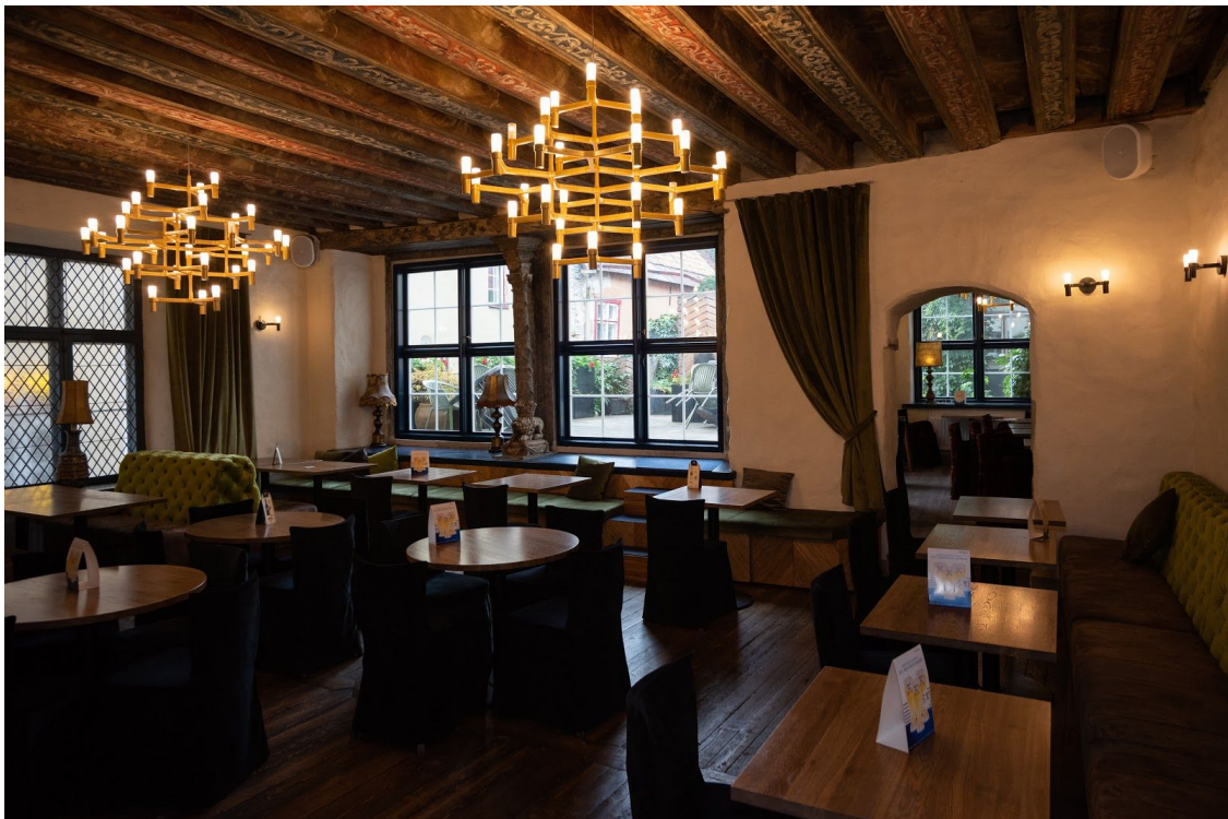
Pikk 45 dornse