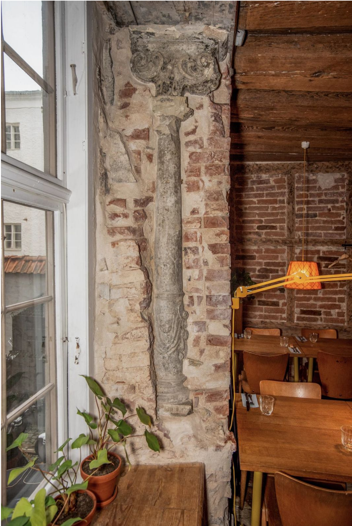
Pilt 11. Niguliste 6 aknasammas.