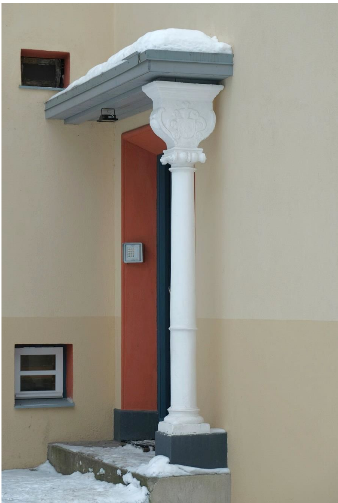
Pilt 36. Süda 2A eksterjööris asuv aknasammass.