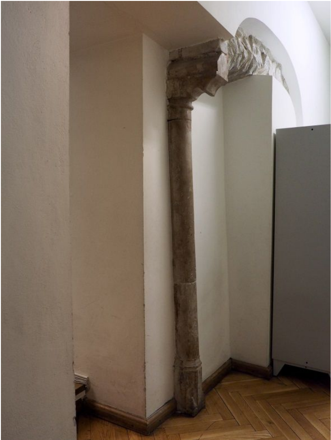
Pilt 32. Rüütli 6 piilar.