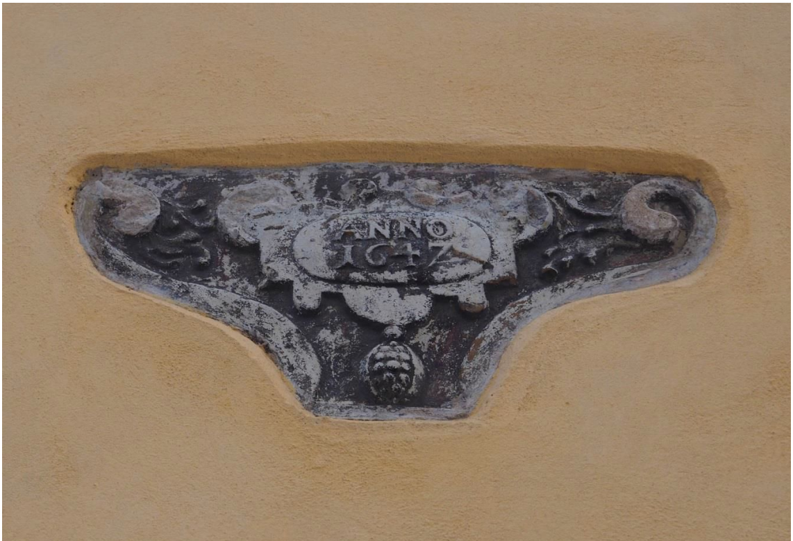
Pilt 13. Oleviste 3 konsool tänapäeval.