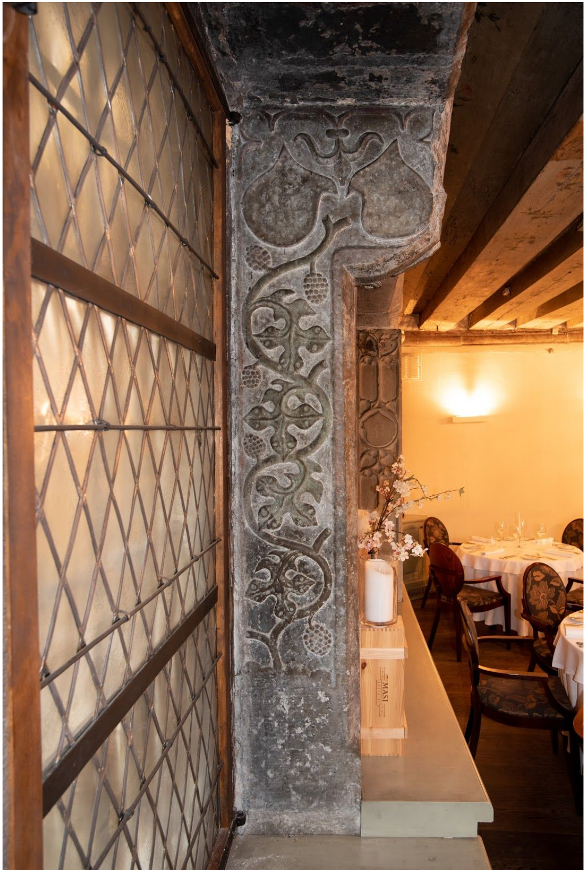
Pilt 42. Vene 10 parempoolne aknapiilar.