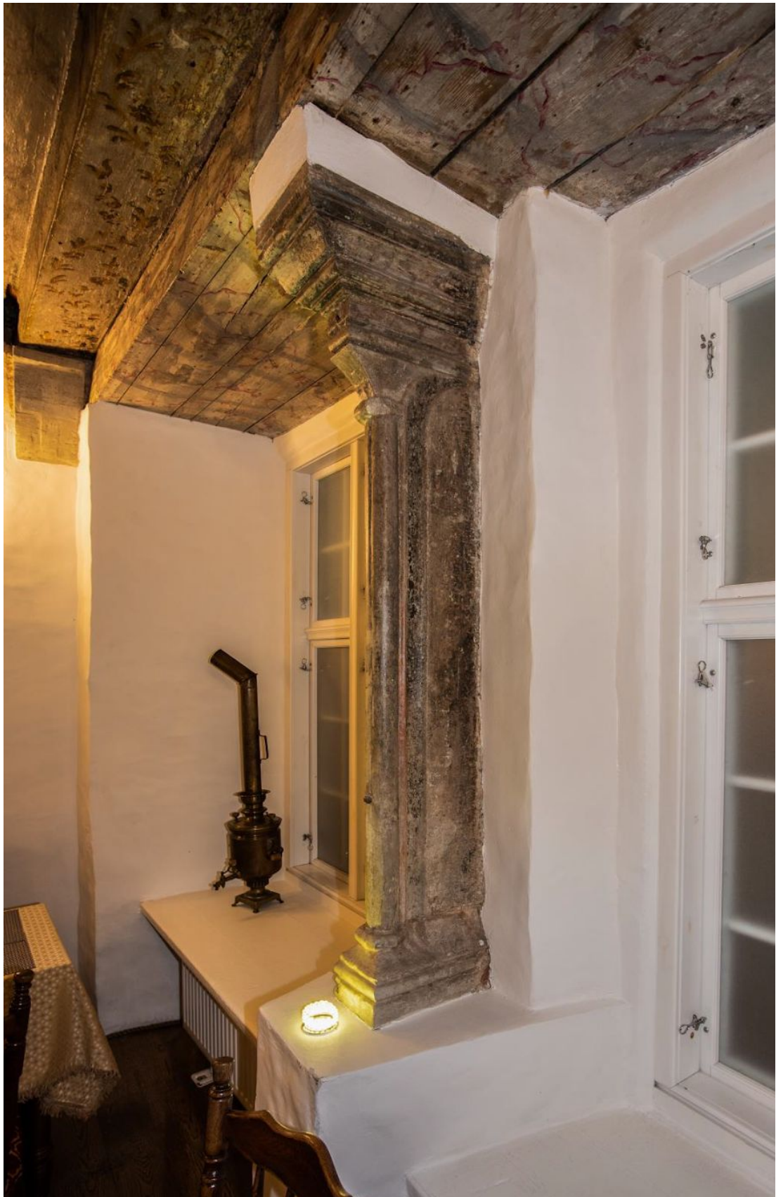
Pilt 21. Pikk 66 aknapiilar.