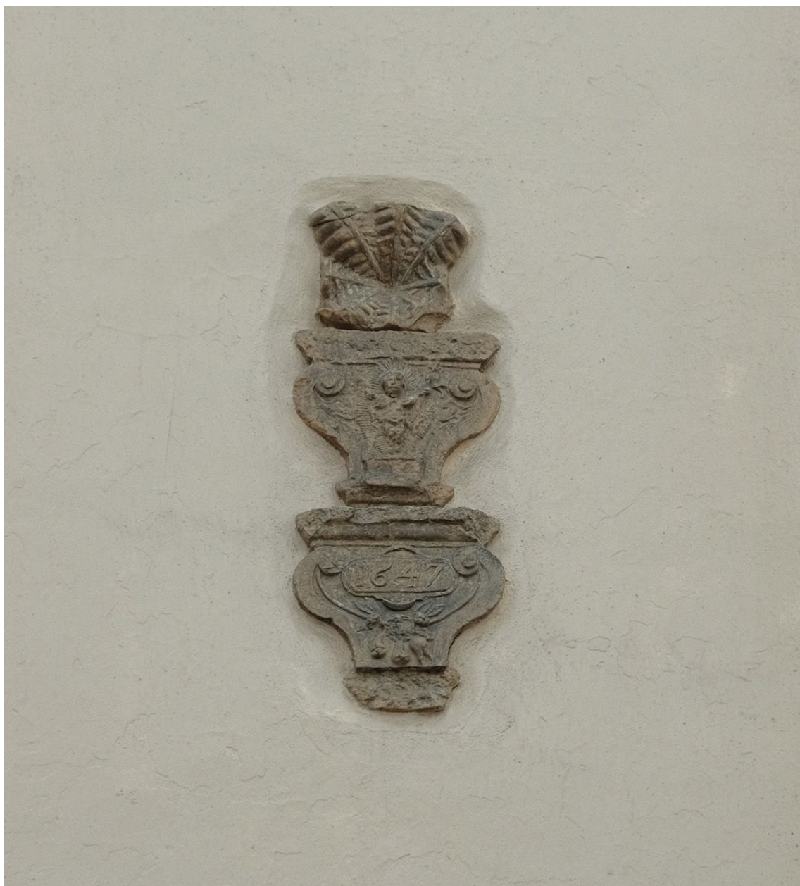
Pilt 37. Sambakonsolid Sulevimägi 2 fassaadil. Isabel Aaso-Zahradnikova.