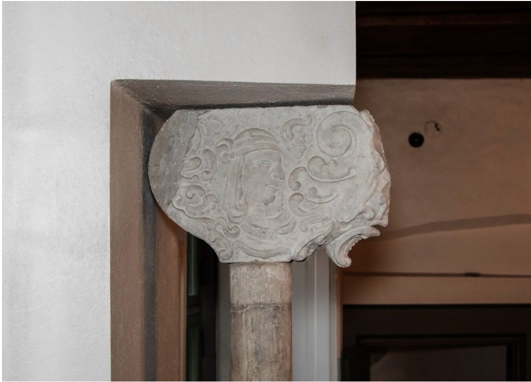
Pilt 3: Kuninga 6 kapiteel.