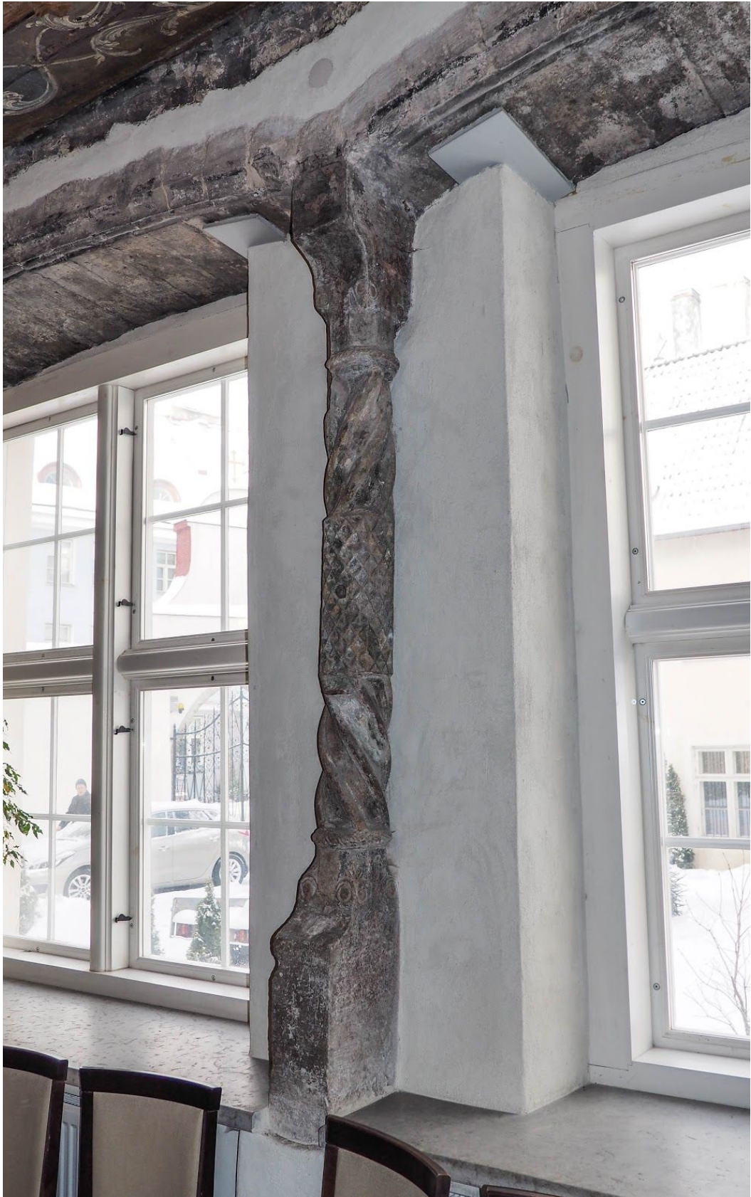
Pilt 45. Vene 16 dornse aknasammas.