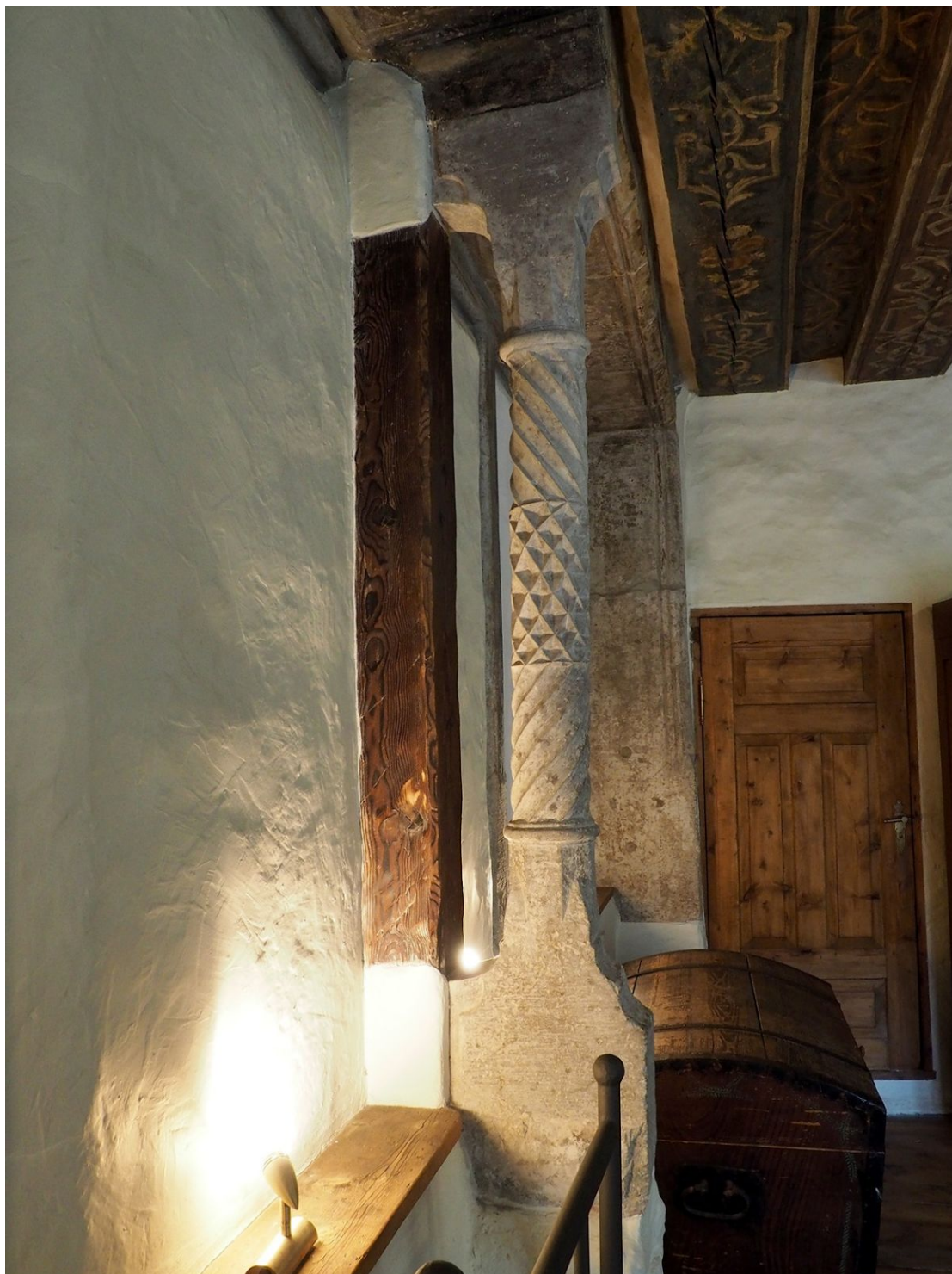
Pilt 2. Hobusepea 12.