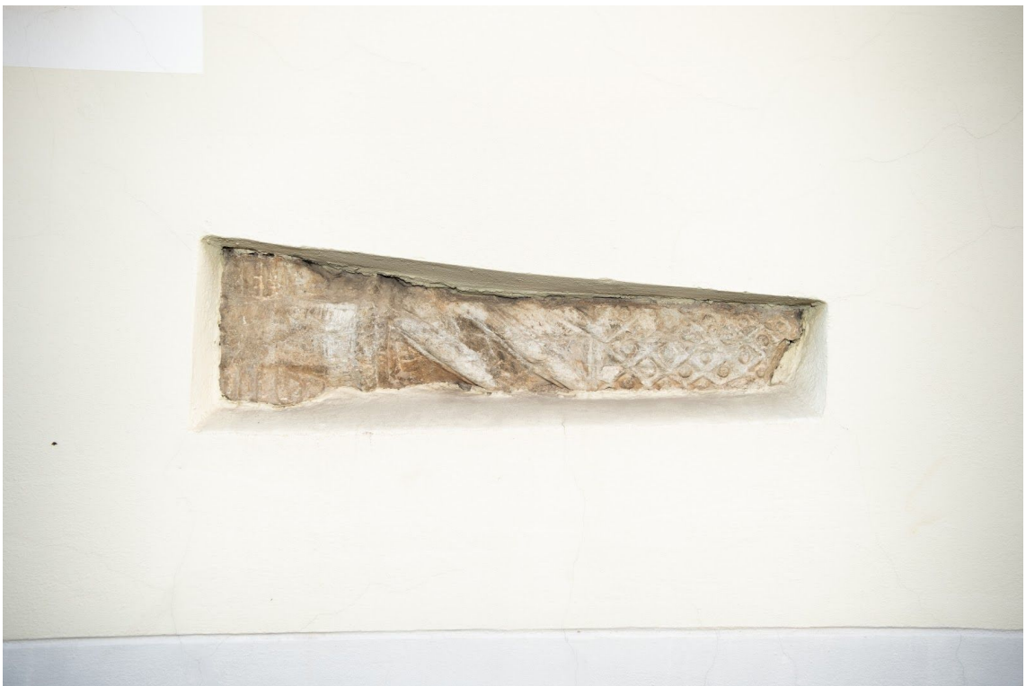
Pilt 35. Rüütli 16 fragment tänapäeval.