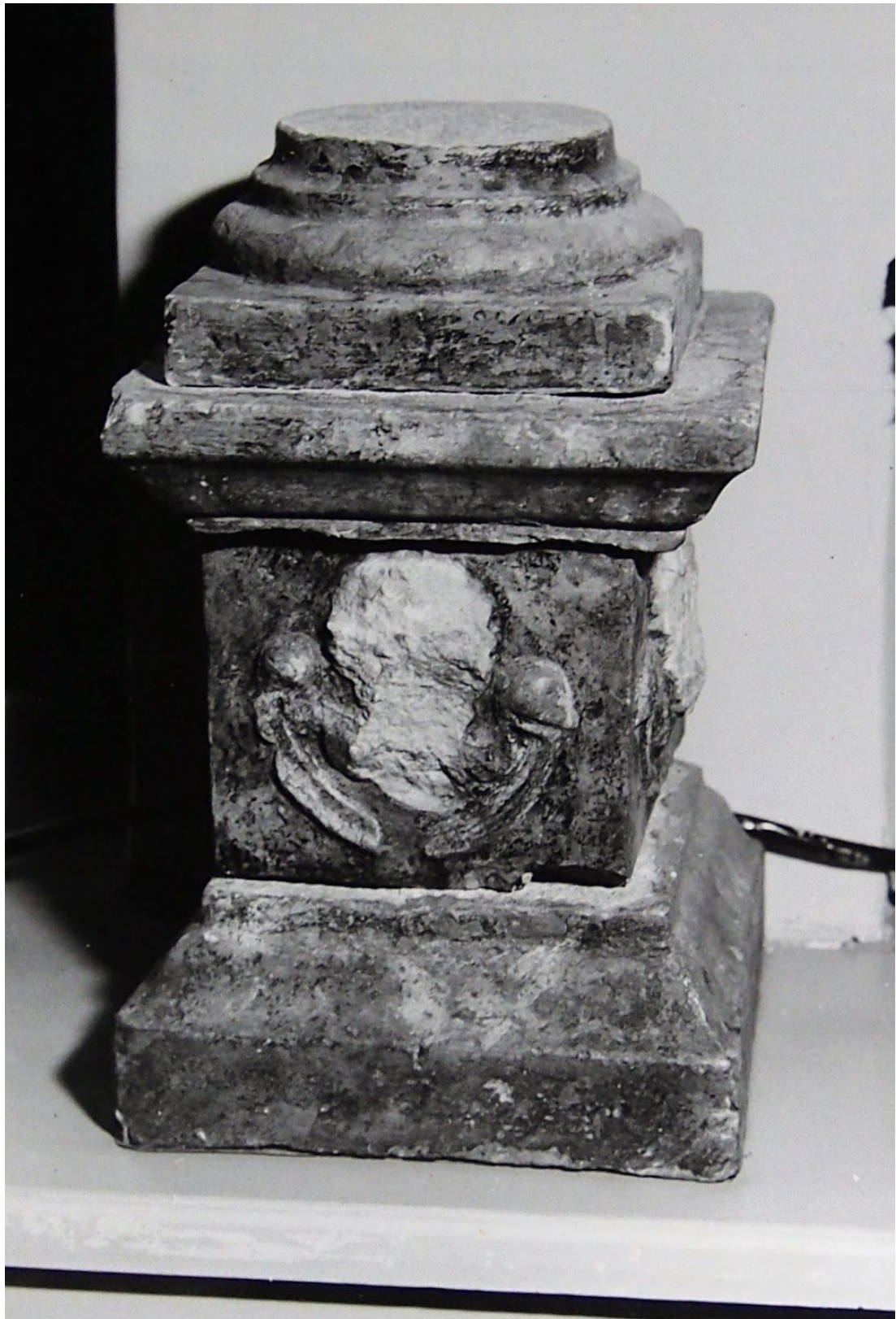
Pilt 27. Raekoja plats 12 samba fragment.