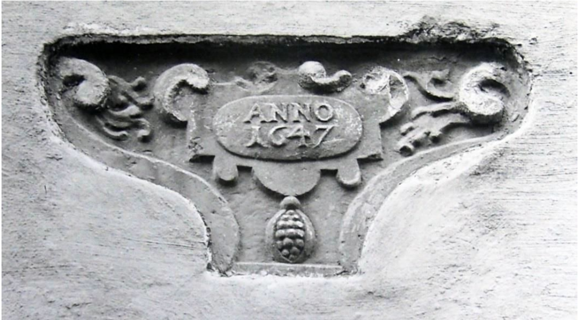
Pilt 12. Oleviste 3 konsool arhiivifotol.