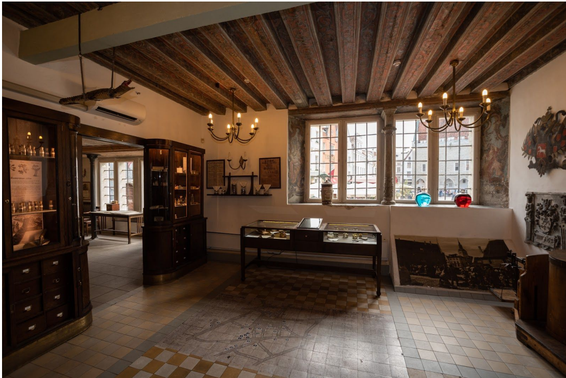
Pilt 1. Raekoja plats 11 interjäär.

Näiteid: Raekoja plats 11 (C), Sulevimägi 2, Vene 12 jt.