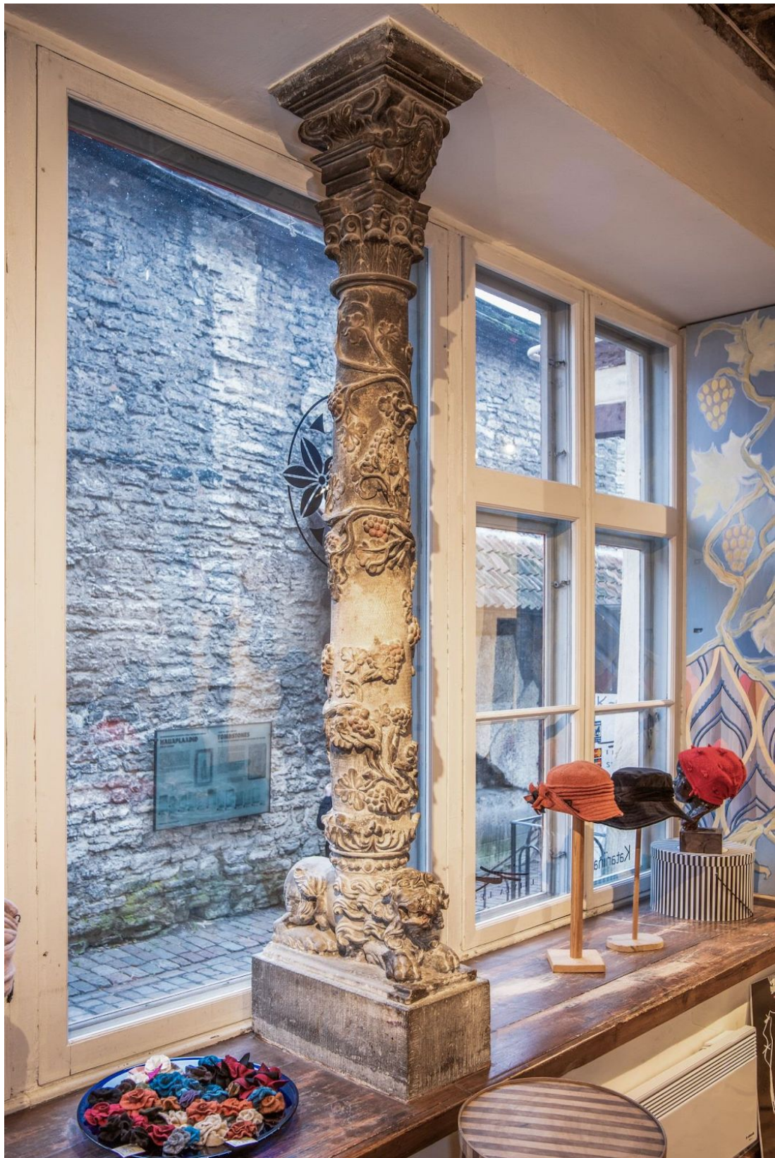
Pilt 44. Vene 12 tagumise ruumi aknasammas.