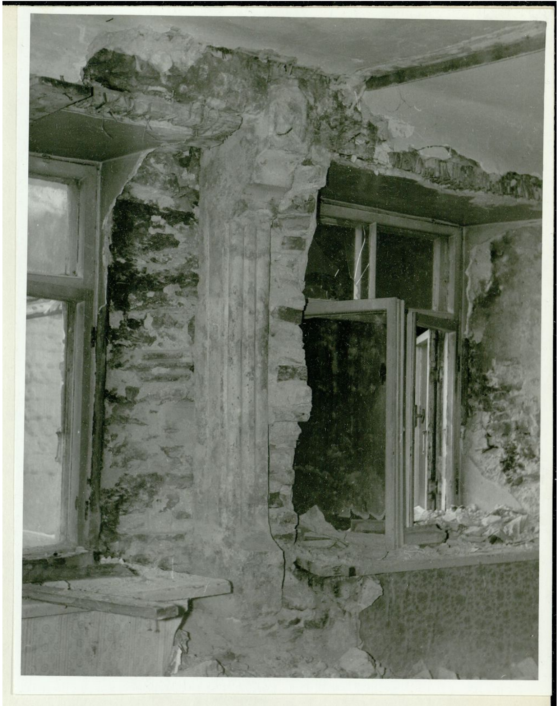
Pilt 18. Pikk 46 sammas arhiivifotol.