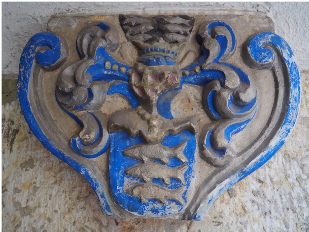
Pilt 31. Von Derfeldeni vapiga konsool.