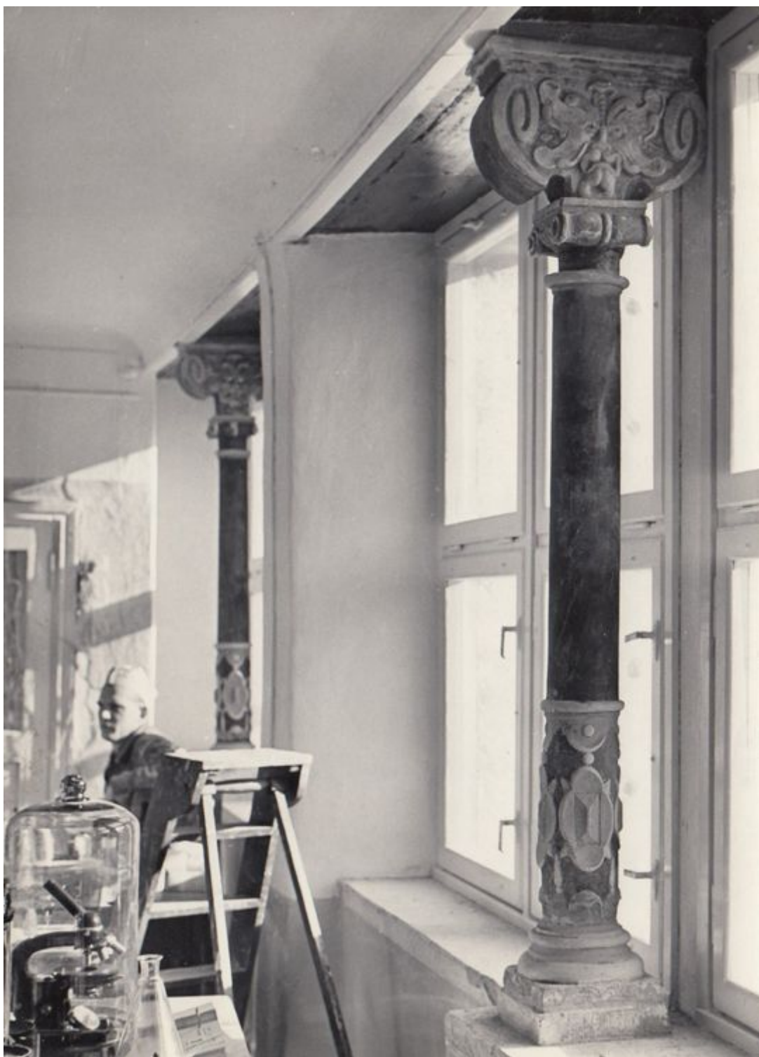
Pilt 25. Raekoja plats 11 NE-nurga aknasambad.