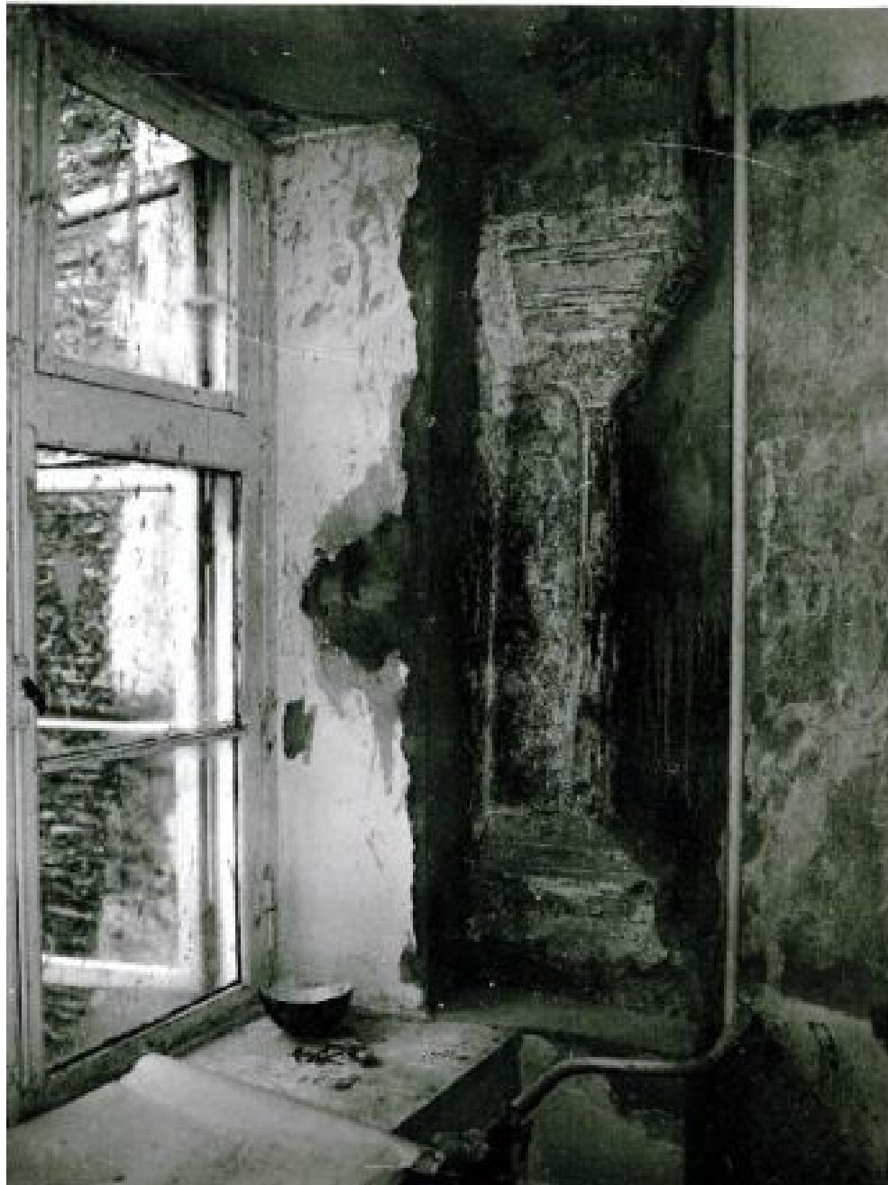
Pilt 47. Vene 23 aknapiilari arhiivifoto.