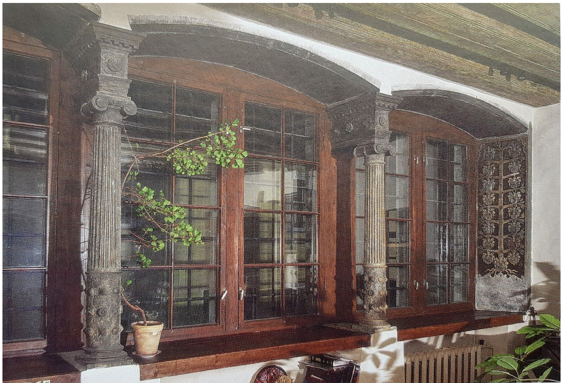
Pilt 33. Rütli 14 aknasambad.