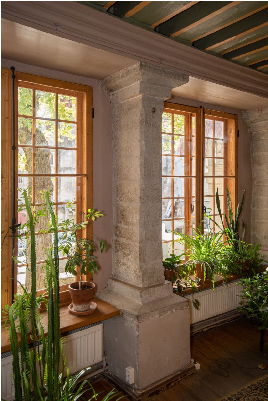
Pilt 7. Lai 23 aknasammas.