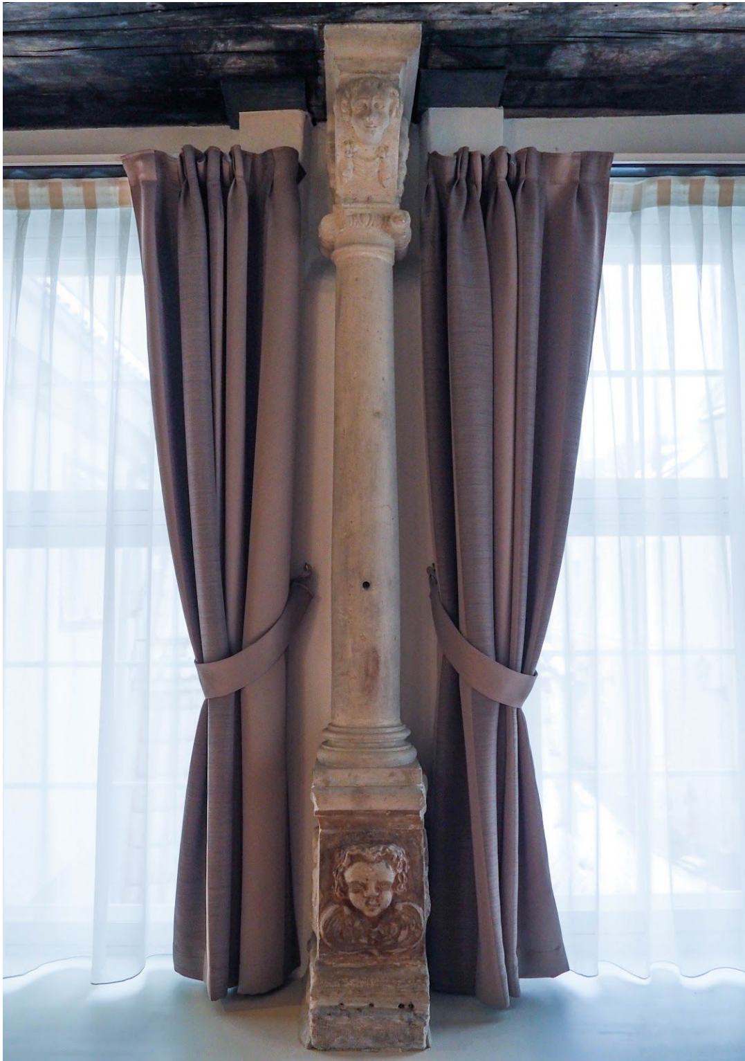
Pilt 22. Pikk 69 aknasammas.