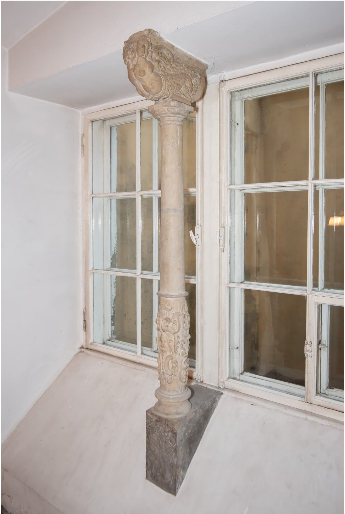
Pilt 14. Olavi saali aknasammas.