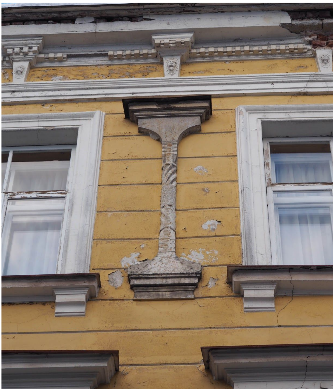
Pilt 5. Lai 7 fassaad.