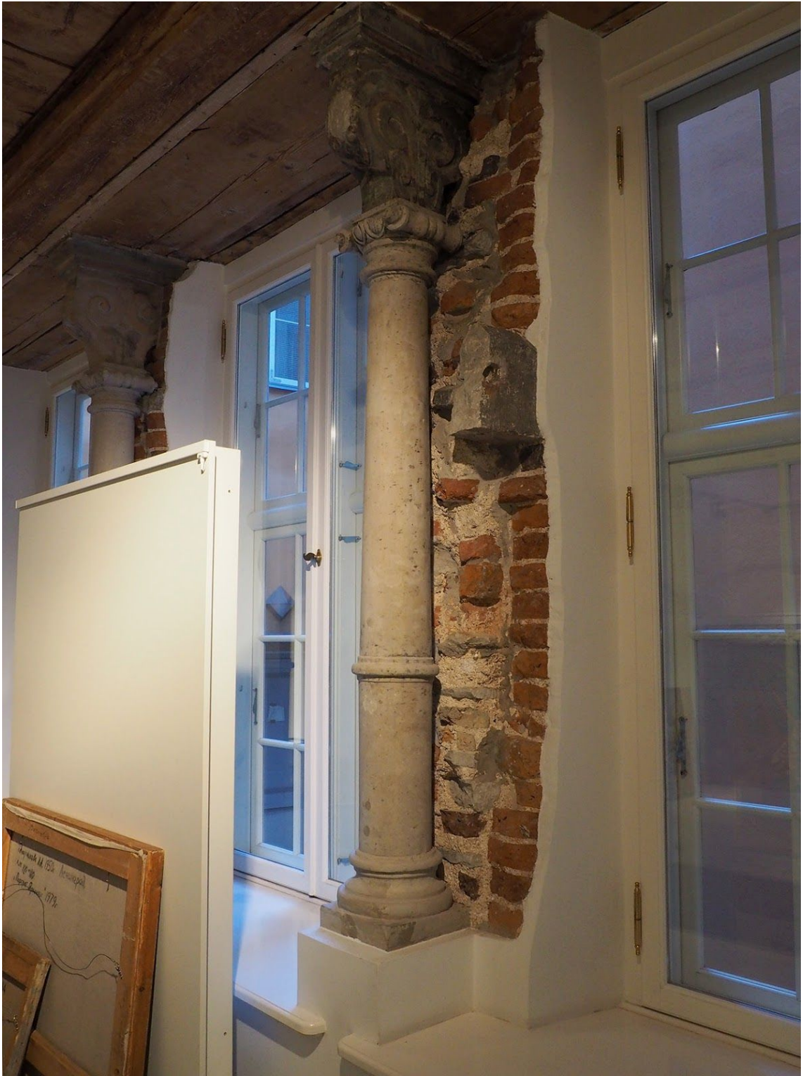
Pilt 38. Suur-Karja 2 aknasambad.