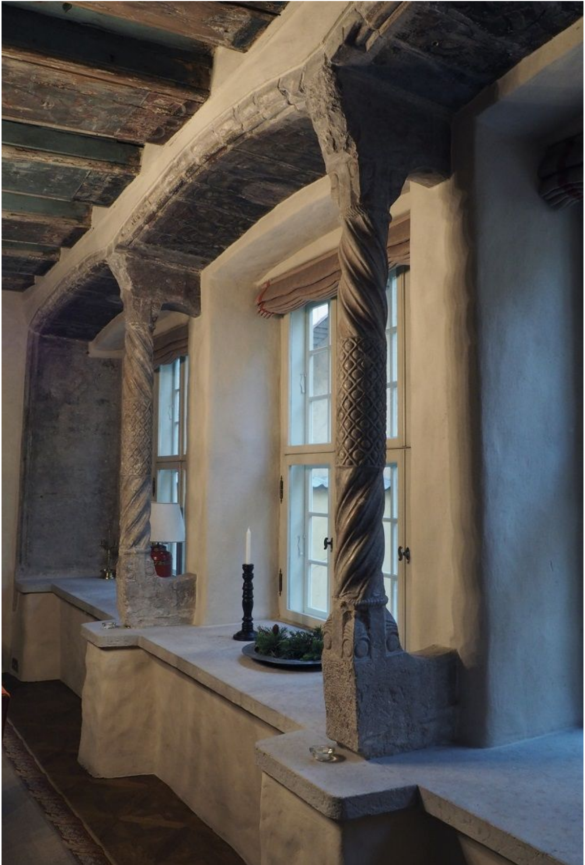
Pilt 19. Pikk 57 aknasambad.