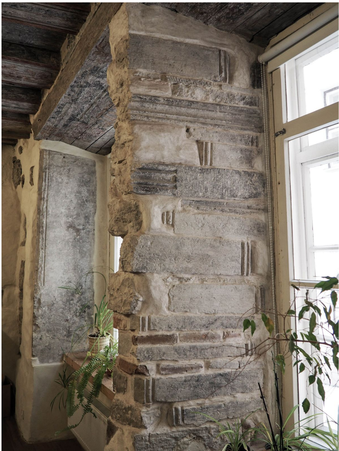
Pilt 46. Vene 16 tagaruumi aknasammas. Foto: Isabel Aaso-Zahradnikova.