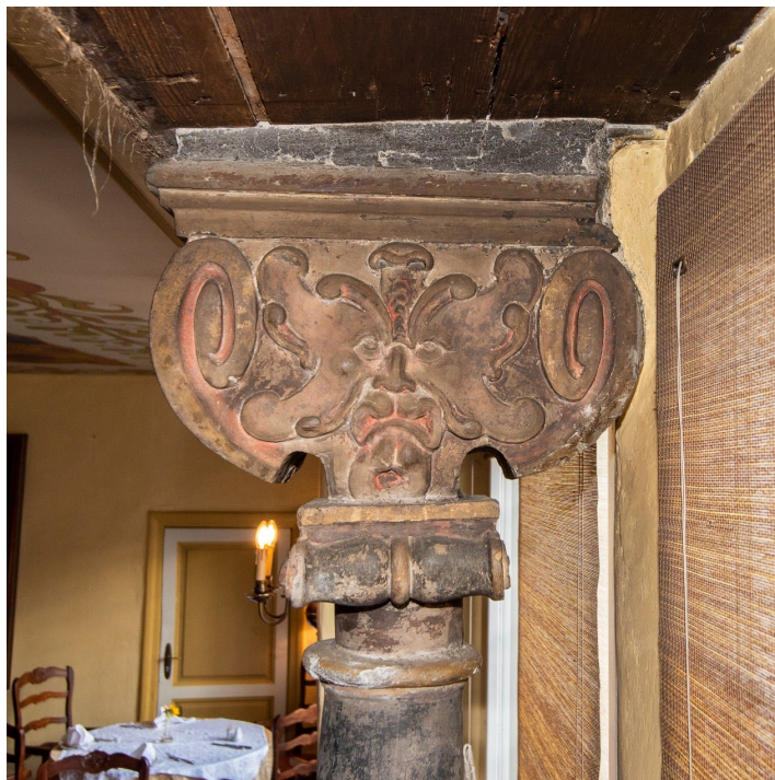
Raekoja plats 11, II korrus

Bakalaureusetöös esitatud aknasammaste kataloog on mõeldud ideeliseks aluseks edasistele uuringutele, mis võiksid keskenduda Tallinna vanalinna säilinud raidkividekoorile veelgi laiemal perioodil ning hõlmaksid peale aknasammaste teisigi ehisdetaile. Sel moel kujuneks mahukas Eesti raidkivikunsti andmebaas, mis võimaldaks kunstiajaloolastel ja muinsushuvilistel vaadelda huvipakkuvaid objekte ilma hoonetesse ligipääsu otsimise vaevata. Usutavasti oleks see tulevikus heaks abiks ajaloolise kunstipärandi uurimisel ja säilitamisel.