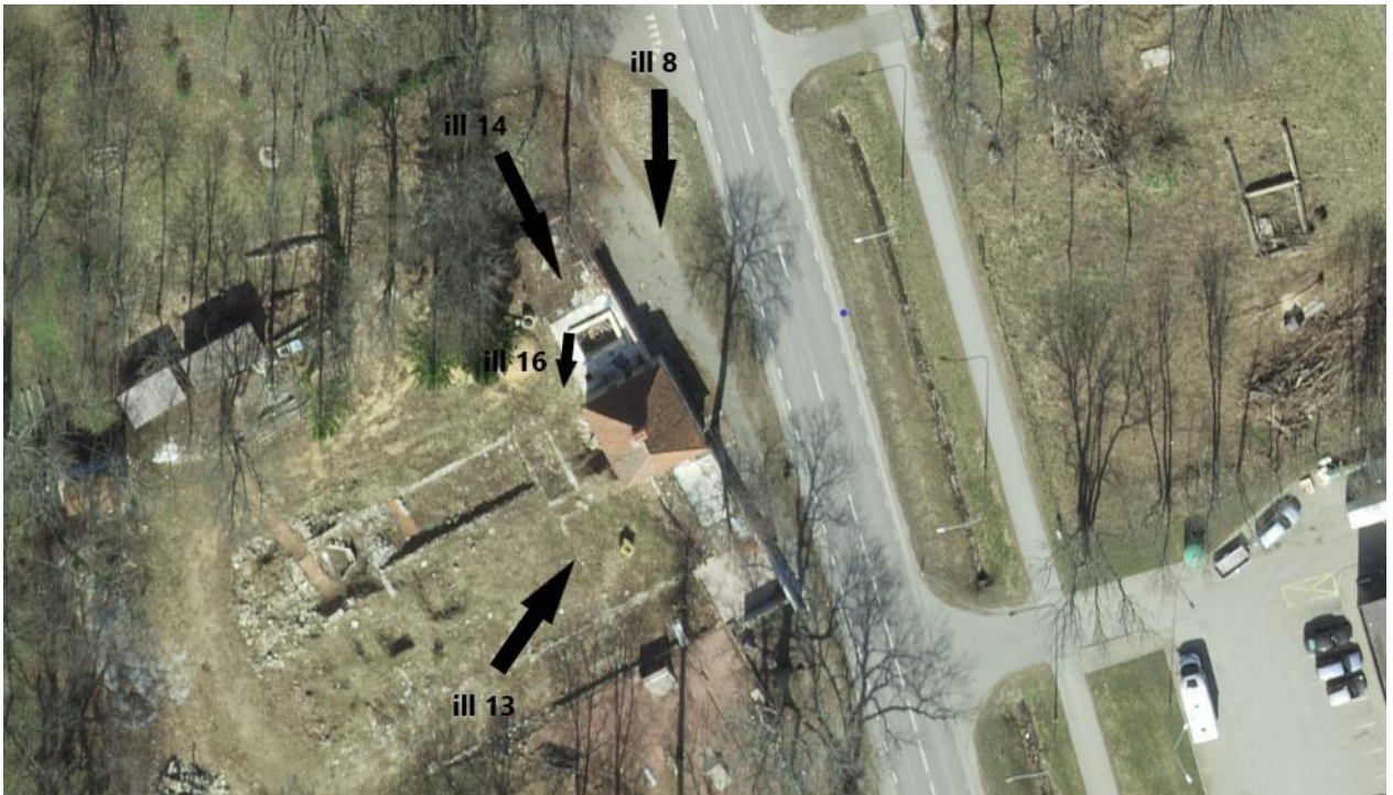
18. Töös kasutatud fotode pildistamise suunad. Autori töötlus.