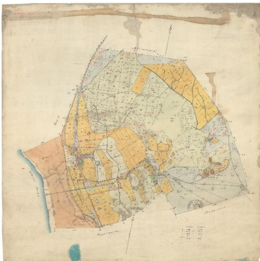
1. Laulasmaa mõisa üldplaan 1

Eesmärk on välja selgitada milline oli mõisakompleksi arhitektuur, asendiplaanid, omanikud. Samuti on eesmärk teada saada milline oli hoone materjalikasutus, kas on säilinud väärtuslike detaile, millistel tingimustel saaks hoonet konserveerida.