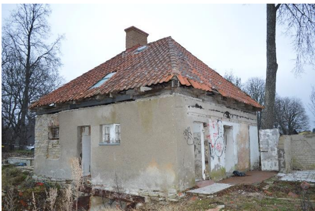
13. Aidahoone. Laulasmaa, jaanuar 2020.

Probleemidest, mida saaks omanik lihtsasti ära hoida, toaksin välja paar olulisemat.