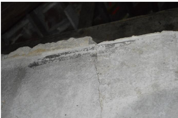
9. Tõendamata bordüür aidahoone seina ülaservas.