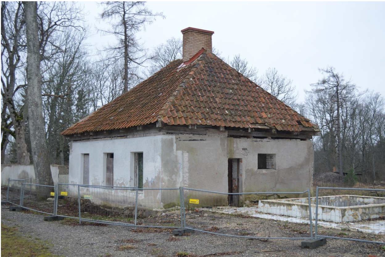
8. Mõisa aidahoone, Laulasmaa, 01.2020.

Kuna mõisa peahoonet ei ole, saan kirjeldada aidahoonet (ill 8), mis on säilinud.