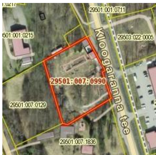
2. Laulasmaa mõisa krundiplaan 2