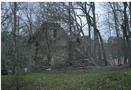
7. Lauda otsasein, Laulasmaa, 01.2020, autori foto.