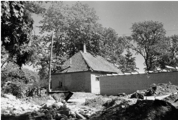
5. Tallinna kaubandusvalitsuse puhkekodu ehitus 11

Mõisa laudast on järgi vaid üks otsasein (ill 7), mille Kuti-Muti noorte laager laiendamise plaanide kohaselt ära hävitab. Sellele lisaks on laagri juhtkond aastaid tagasi lauda seinte paekividest laagrisse välikamina ladunud. 10