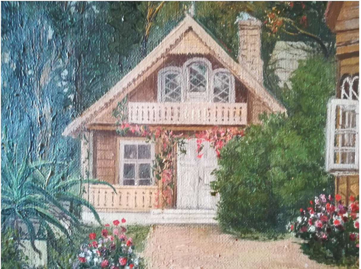
15. O. Arrongi maal. Laulasmaa, märts 2020