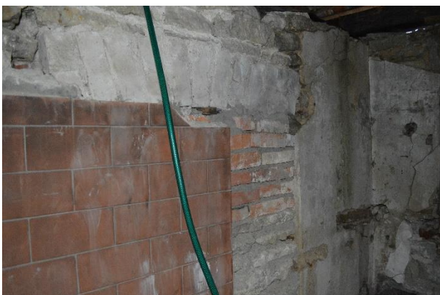
11. Aidahoone seest. Laulasmaa, 01.2020.

Avanguid pole vaja teha nägemaks ja tõdemaks, et on kasutatud erinevaid telliseid ja segusid erinevatel ajaperioodidel (ill 10, ill 11).