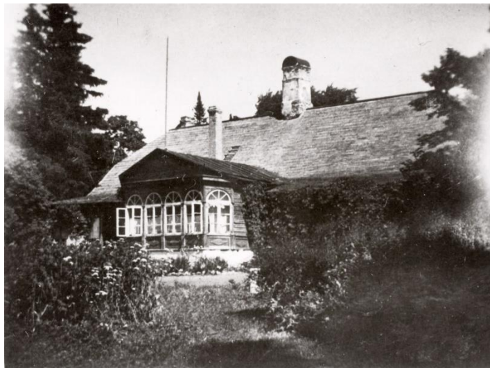
1. Laulasmaa mõisahooned 5