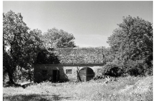
6. Mõisa laut 12