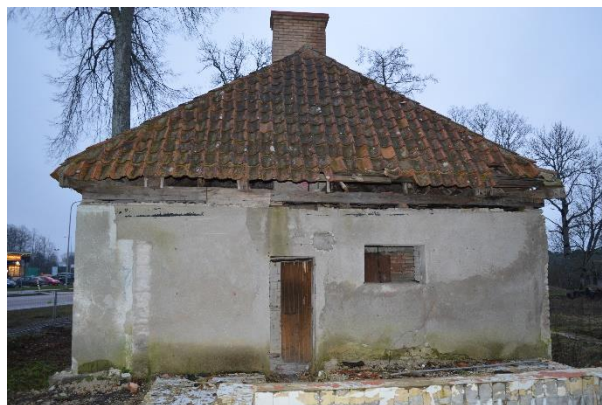
14. Aidahoone. Laulasmaa, jaanuar 2020.

Korrektse katusekatte puudumise (ill 13) tulemusel on müürlatt tõenäoliselt pehkinud, kaetud L-profiil plekiga, lootuses talale niimoodi tugevust juurde anda ja toetatud selgelt eristatavalt uute kiiludega. On välja vahetatud ka sarikaots (valgeks värvitud), näha on selle kõrval müürlati märgumine ja selle all krohvipinnal veekahjustus. See kõik võib olla tingitud korstna kõrval katusekivide puudumise tõttu. Edasiste kahjustuste ära hoidmiseks tuleb viivitamatult katus kriitilise pilguga üle vaadata ja vead kõrvaldada kasutades vastavaid oskusi omavaid ehitustöölisi ning vastavalt ajastule sobilikke materjale. Kui katus remonditud siis tuleb vajadusel pehkinud palk välja vahetada.