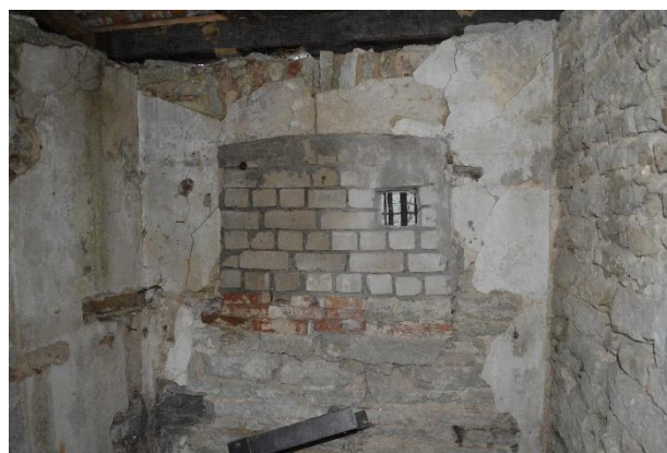
12. Aidahoone seest. Laulasmaa, 01.2020.