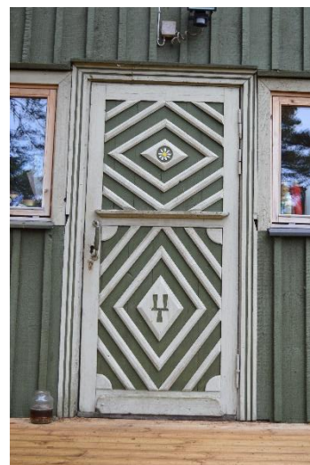
4. Uks Lohusalus, Sambla tee 5, 01.2020, autori foto.