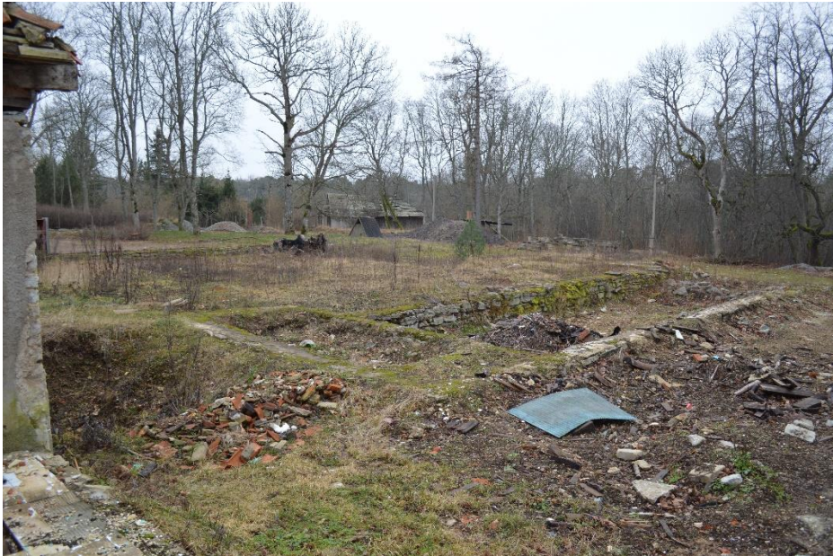
16. Mõisahoonde vundamendimüür. Laulasmaa, jaanuar 2020.