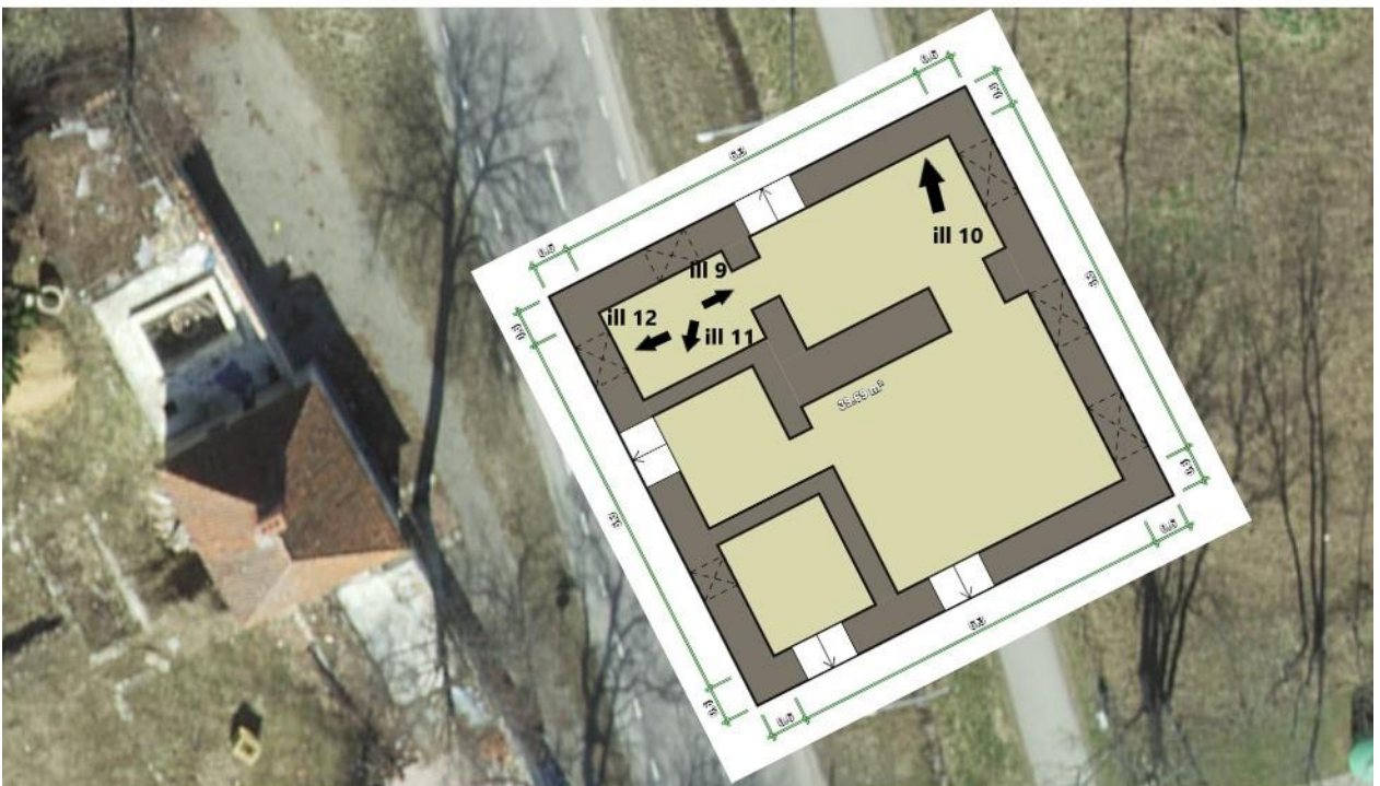
17. Töös kasutatud siseruumide fotode pildistamise suunad. Autori töötlus.