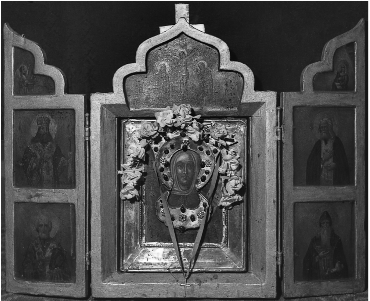
Joon. 10. Püha Paraskeva pühane kuzov'is. Foto: R. Sillasoo, 1981. (MA fotoarhiiv 8063)