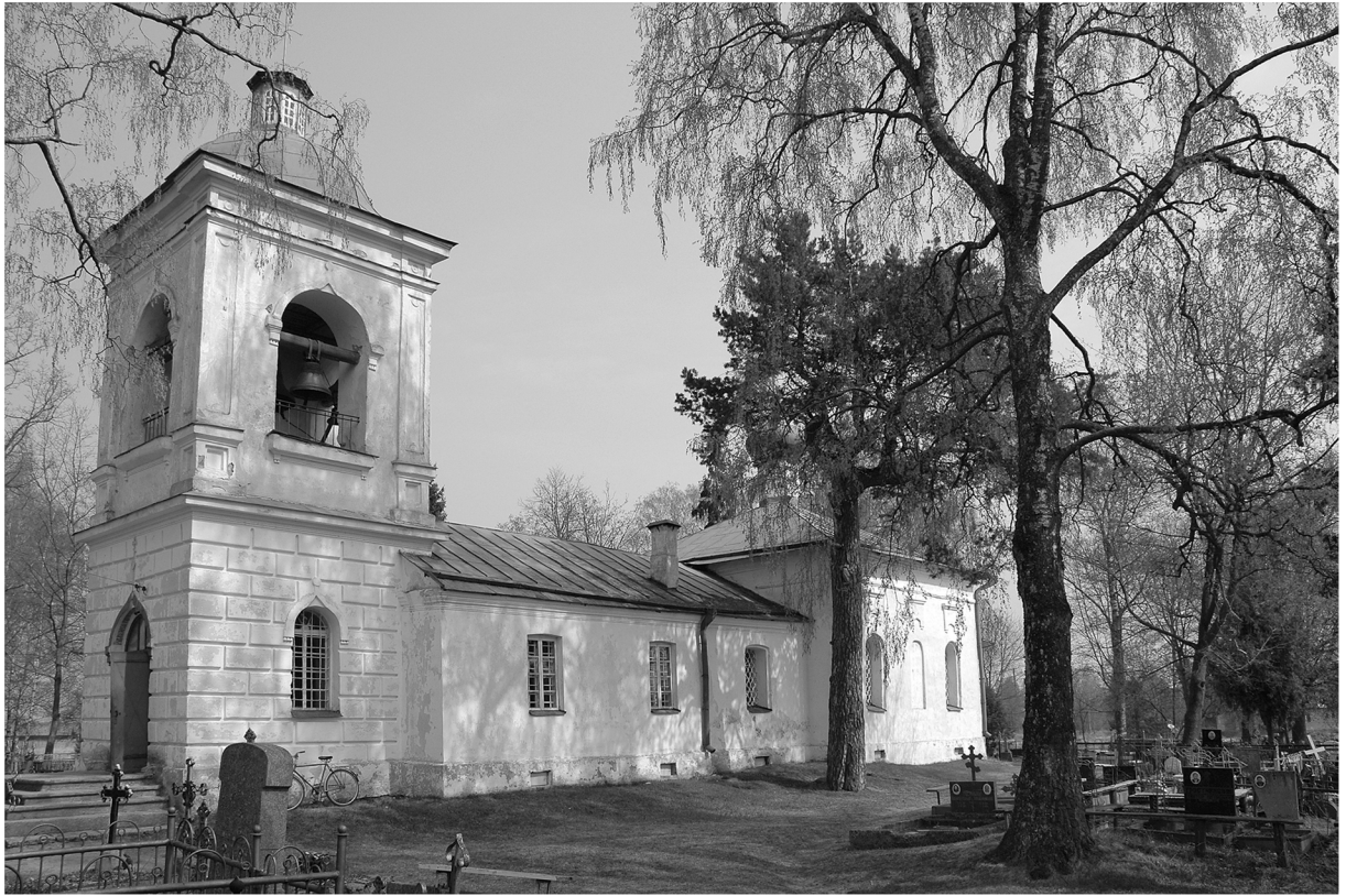
Joon. 2. Vaade Satserinna kirikule endise puukiriku asukohast. Foto: G. Baranov, 2005