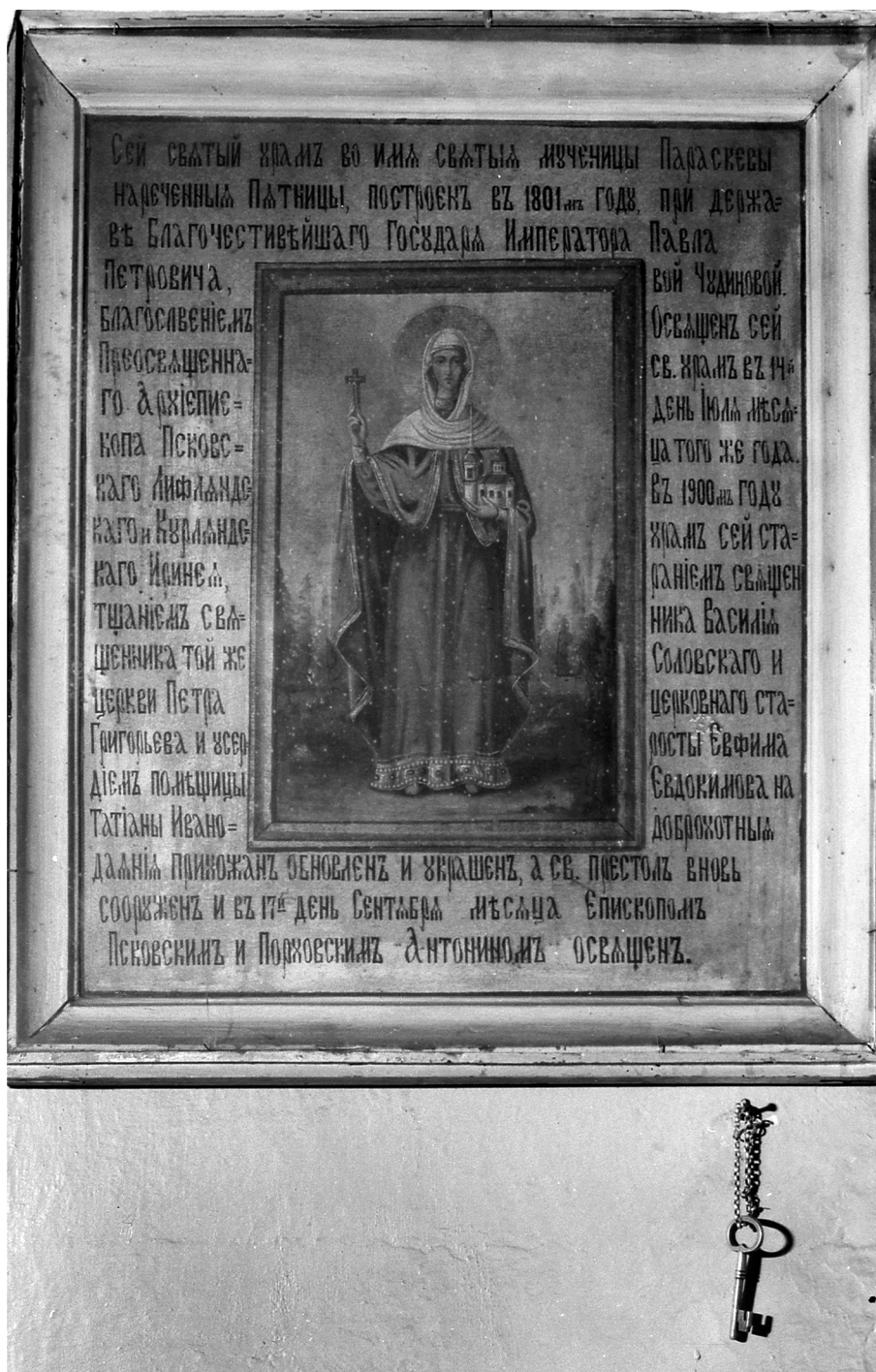
Joon. 4. Püha Paraskeva, 1900. Satserinna püha Paraskeva kogudus. Foto: R.Sillasoo, 1981. (MA fotoarhiiv 8014)