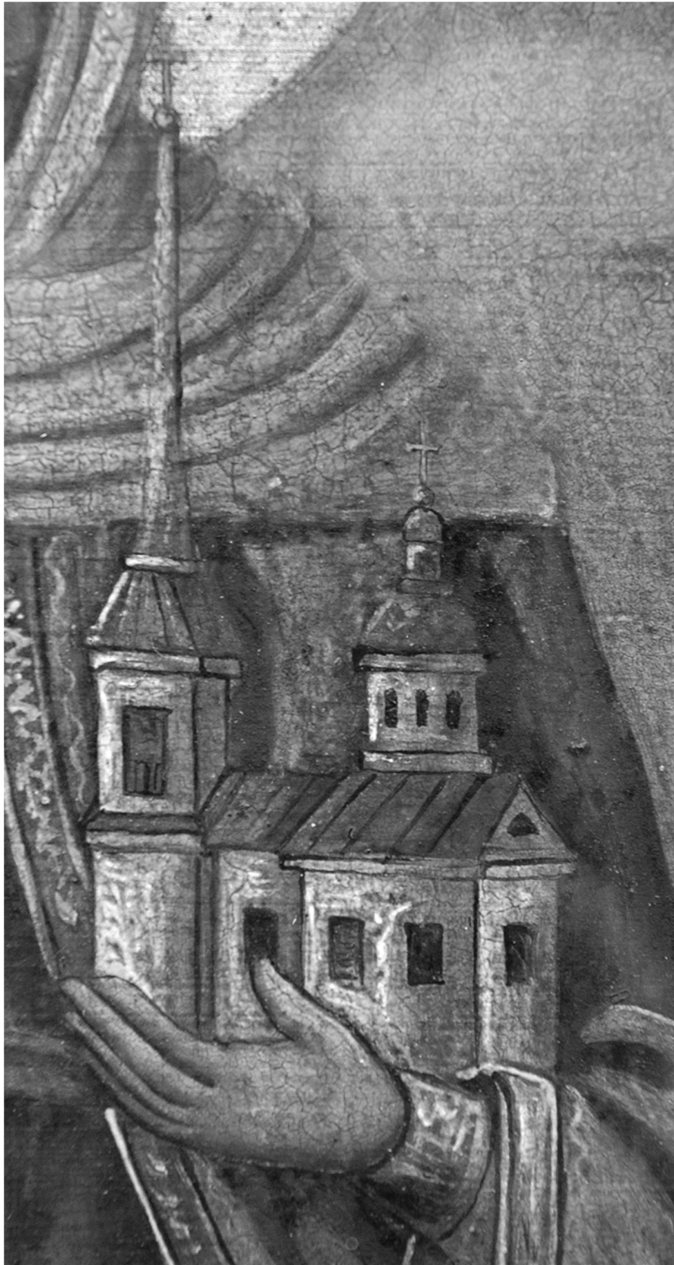
Joon. 3. Detail Püha Paraskeva pühasesest (Püha Paraskeva hoidmas Satserinna kirikut), 1900. Satserinna püha Paraskeva kogudus. Foto: G. Baranov, 2005