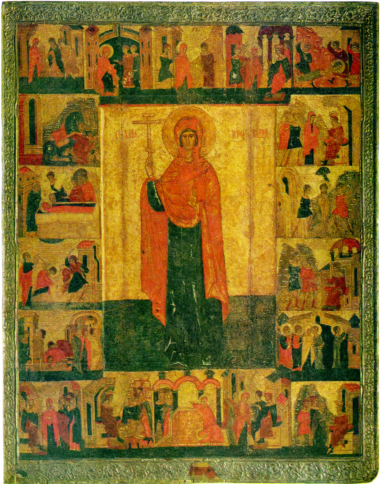
Joon. 5. Püha Paraskeva-Pjatnitsa eluloopühane (15.–16. sajandi vahetus). Riiklik ajaloomuseum Moskvas (inv nr 5762)