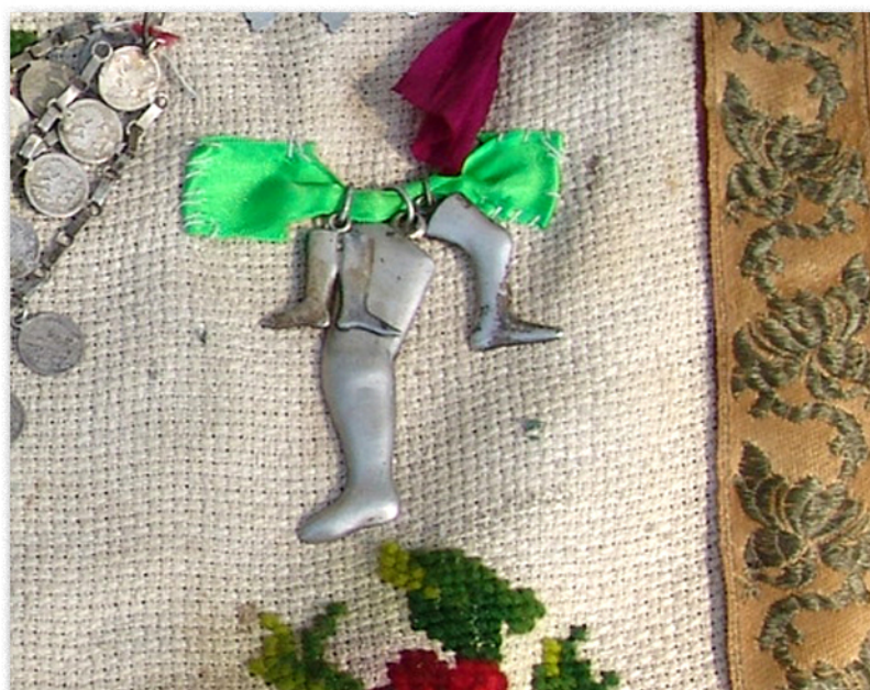
Joon. 6. Annetused/kingid pühale Paraskeevale. Satserinna püha Paraskeva kogudus.