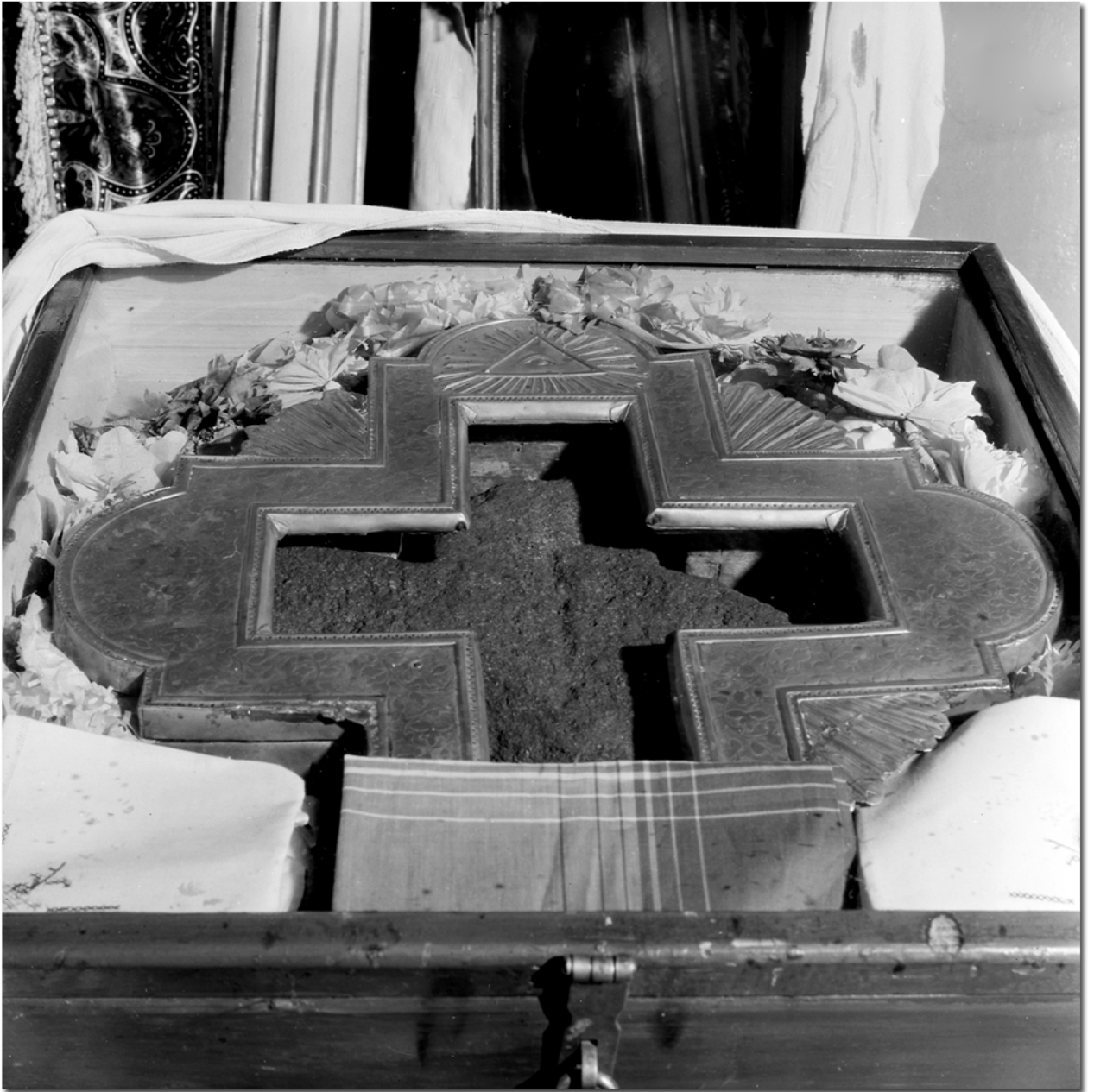
Joon. 1. Liivakivist rist (14.–16. sajand) hõbetatud messingraamistuses (19. sajand) Satserinna püha Paraskeva kogudus. Foto: R. Sillasoo, 1981. (MA fotoarhiiv 8025)