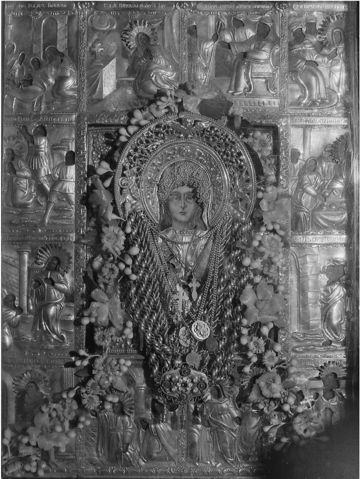
Joon. 7. Püha Paraskeva pühane pühaseseinal (19. sajand). Satserinna püha Paraskeva kogudus. Foto: R.Sillasoo, 1981 . (MA fotoarhiiv 8047)