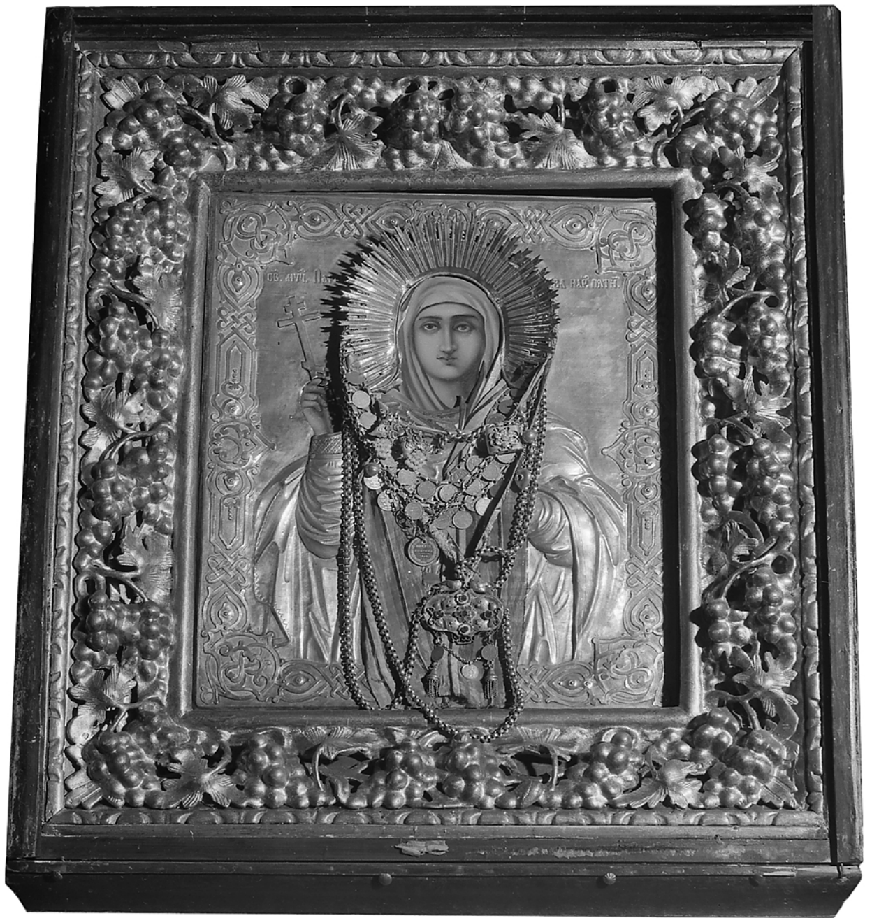
Joon. 9. Püha Paraskeva (MA arhiivi andmeil dateeritud 19. saj viimane veerand, 20 saj ülemaaling). Satserinna püha Paraskeva kogudus. Foto: R.Sillasoo, 1981. (MA fotoarhiiv 8008)