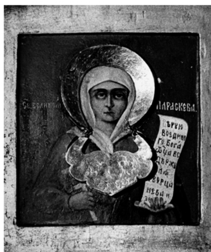
Joon. 11. Püha Paraskeva. Foto: 1980ndad aastad (MA fotoarhiiv)