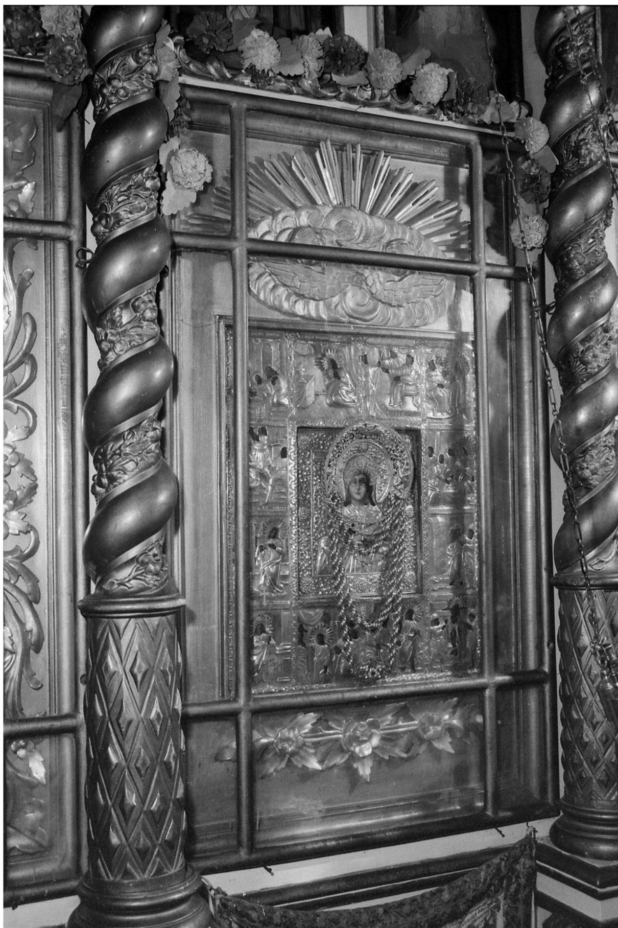
Joon. 8. Püha Paraskeva pühane pühaseseinal (19. sajand). Satserinna püha Paraskeva kogudus. Foto: V. Ahonen, 1996. (MA fotoarhiiv 15 908)